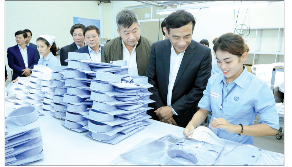
Đồng chí Đặng Trọng Thăng, Phó Bí thư Tỉnh ủy, Chủ tịch UBND tỉnh thăm dây chuyền may của Công ty Cổ phần Đô Lương.