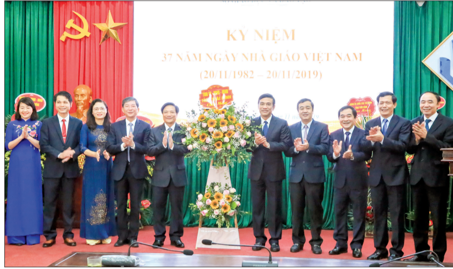
Các đồng chí lãnh đạo tỉnh chúc mừng ngày Nhà giáo Việt Nam tại Sở Giáo dục và Đào tạo.