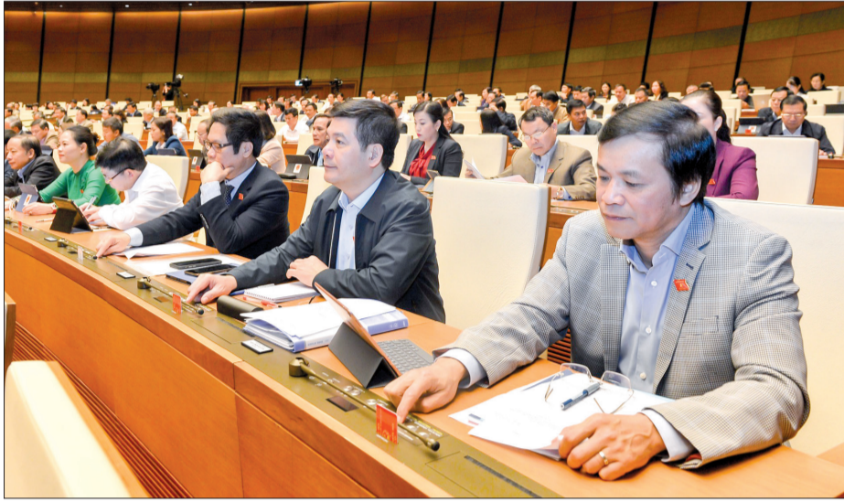
Các đại biểu Quốc hội biểu quyết.