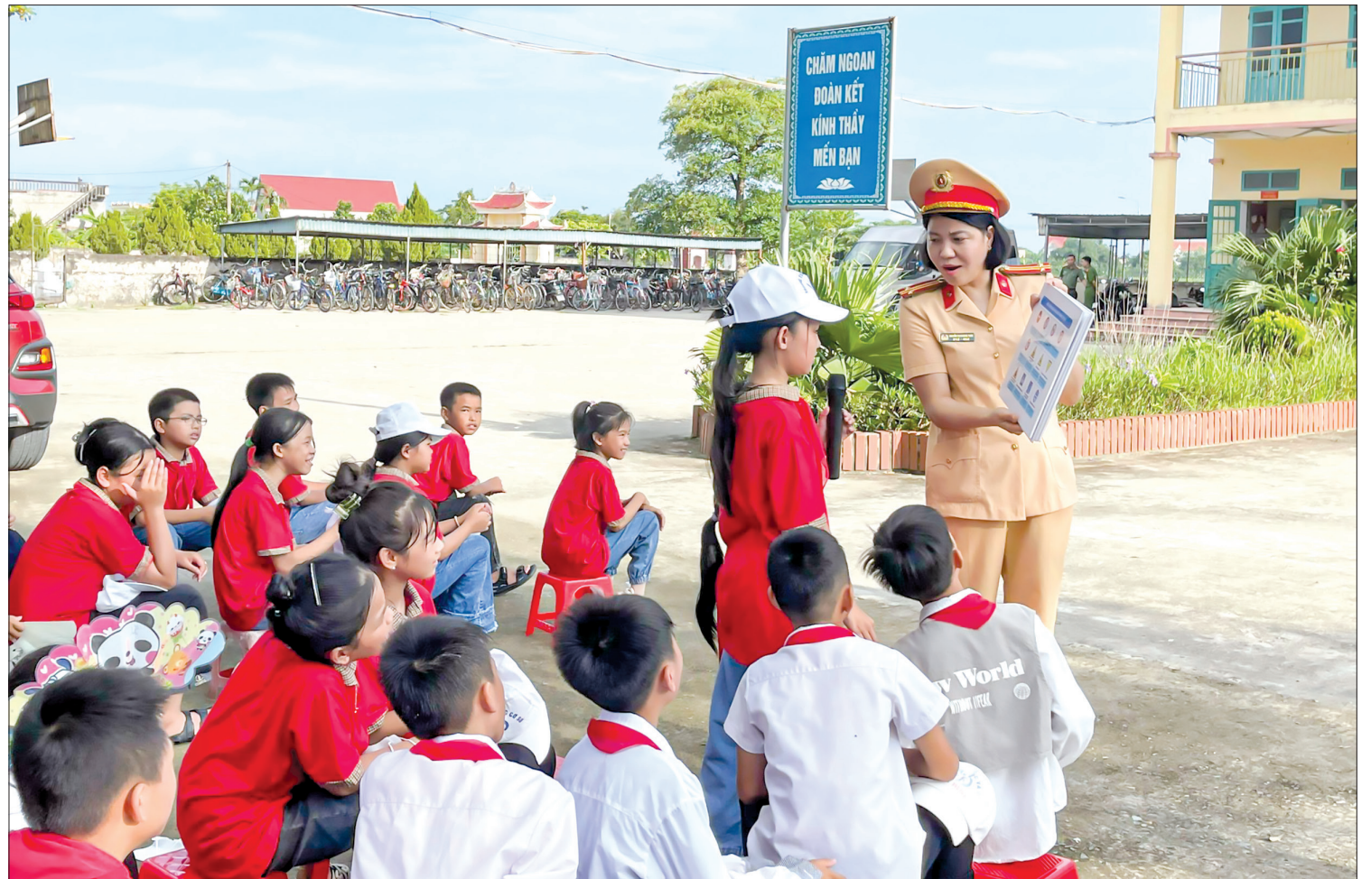
Cán bộ Phòng Cảnh sát giao thông, Công an tỉnh tuyên truyền pháp luật về ATGT cho học sinh Trường THCS An Bình (Kiến Xương).