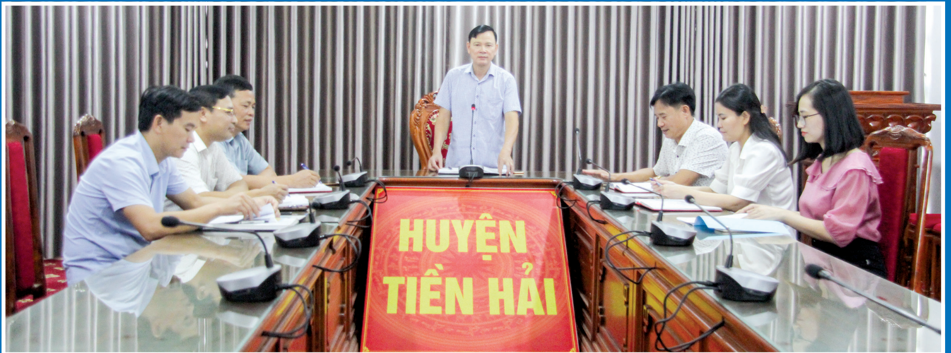
Ủy ban Kiểm tra Huyện ủy Tiên Hải tổ chức giao ban công tác kiểm tra, giám sát.

Những năm qua, cấp ủy, ủy ban kiểm tra (UBKT) hai cấp của Đảng bộ huyện Tiên Hải đã bám sát nhiệm vụ chính trị, thường xuyên quan tâm tới công tác kiểm tra, giám sát (KTGS), công tác xử lý, khắc phục sai phạm, góp phần củng cố, tăng cường đoàn kết, thống nhất trong Đảng, nâng cao năng lực lãnh đạo, sức chiến đấu của tổ chức đảng và đảng viên.