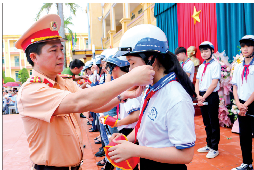
Cán bộ Đội Cảnh sát giao thông, Công an huyện Tiên Hải trao mũ bảo hiểm cho học sinh Trường THCS Nguyễn Công Trứ (Tiên Hải).

Thực hiện tháng cao điểm ATGT cho học sinh đến trường, từ ngày 15/8 - 14/9, lực lượng cảnh sát giao thông toàn tỉnh đã phối hợp tổ chức trên 40 buổi tuyên truyền pháp luật về giao thông tới gần 58.000 học sinh, giáo viên các trường học trong tỉnh. Ký cam kết chấp hành quy định về ATGT cho 48.000 học sinh, giáo viên; ký 1.800 bản cam kết không giao xe cho học sinh, sinh viên không đủ điều kiện.