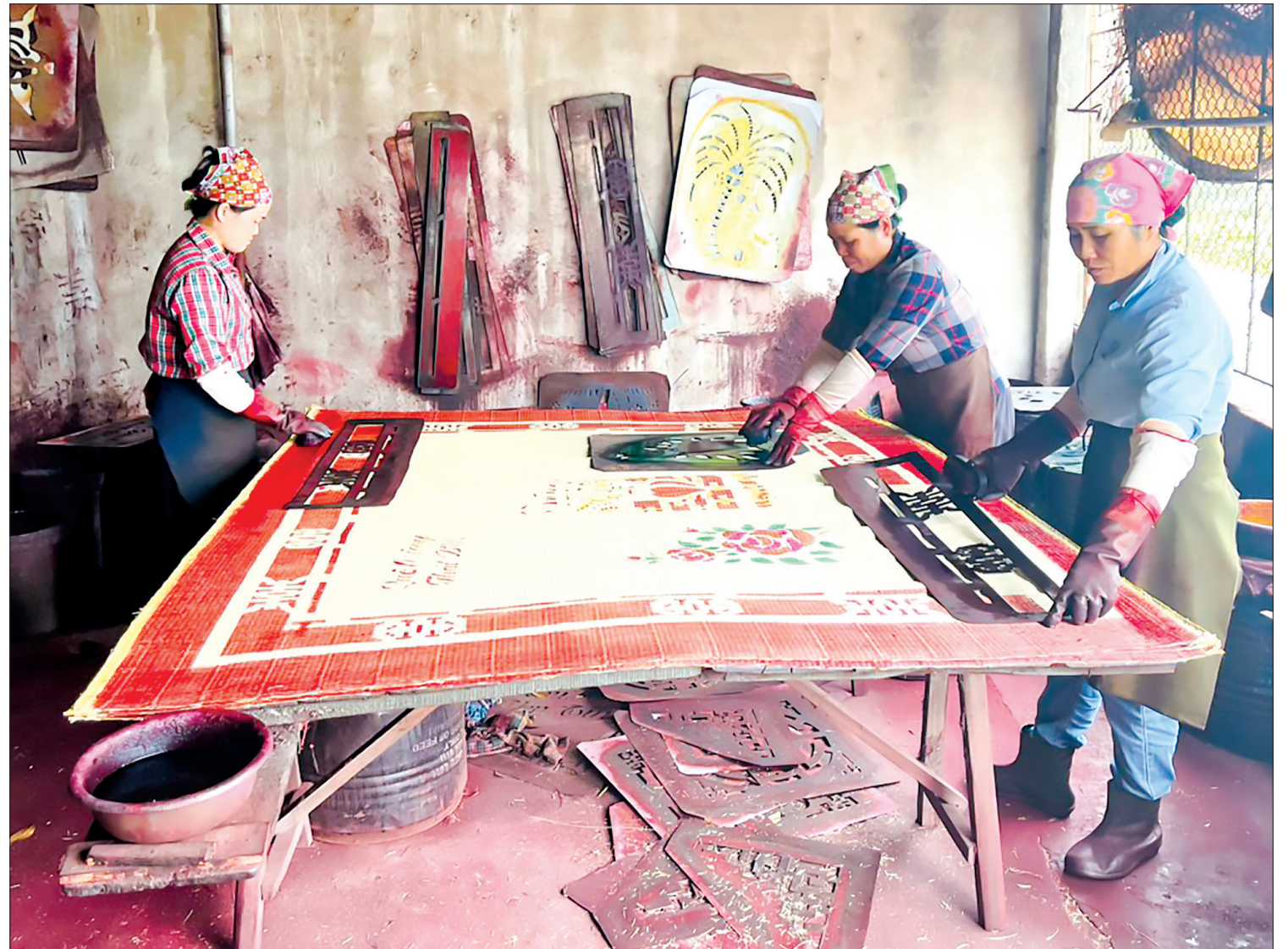
Công đoạn in hình thủ công chiếu Hới.

Khi ngoài chợ đang chen vai, thích cánh xem chiếu, mua bán chiếu thì trong sân đình lại náo nức với cuộc thi dệt chiếu của các giáp trong làng. Theo xếp đặt của từng giáp, các đàn dệt đã sẵn sàng mắc sợi và chuẩn bị đầy đủ các loại cỏi màu. Đề bài thi do chủ khảo xin Thánh ban và được giữ bí mật đến phút chót. Có thể là dệt một lá chiếu cài hoa hình rồng, phượng. Cũng có thể dệt chiếu cài màu thành chữ song hỷ hoặc chữ phúc, chữ lộc, chữ thọ... Mỗi giáp được phép chọn hai thợ giỏi vào dự thi. Một người trao gon, một người đập go, phối hợp nhịp nhàng. Khi trống hiệu nổi lên, cuộc thi bắt đầu, tiếng hò reo vang dậy của mỗi giáp cổ vũ cho giáp của mình. Theo thời gian quy định, chiếu phải dệt xong. Tiêu chí chấm là dệt nhanh, đúng kỹ thuật và đẹp. Giải cao thấp với mỗi giáp không chỉ là điểm may đầu năm mà còn là tiếng tăm