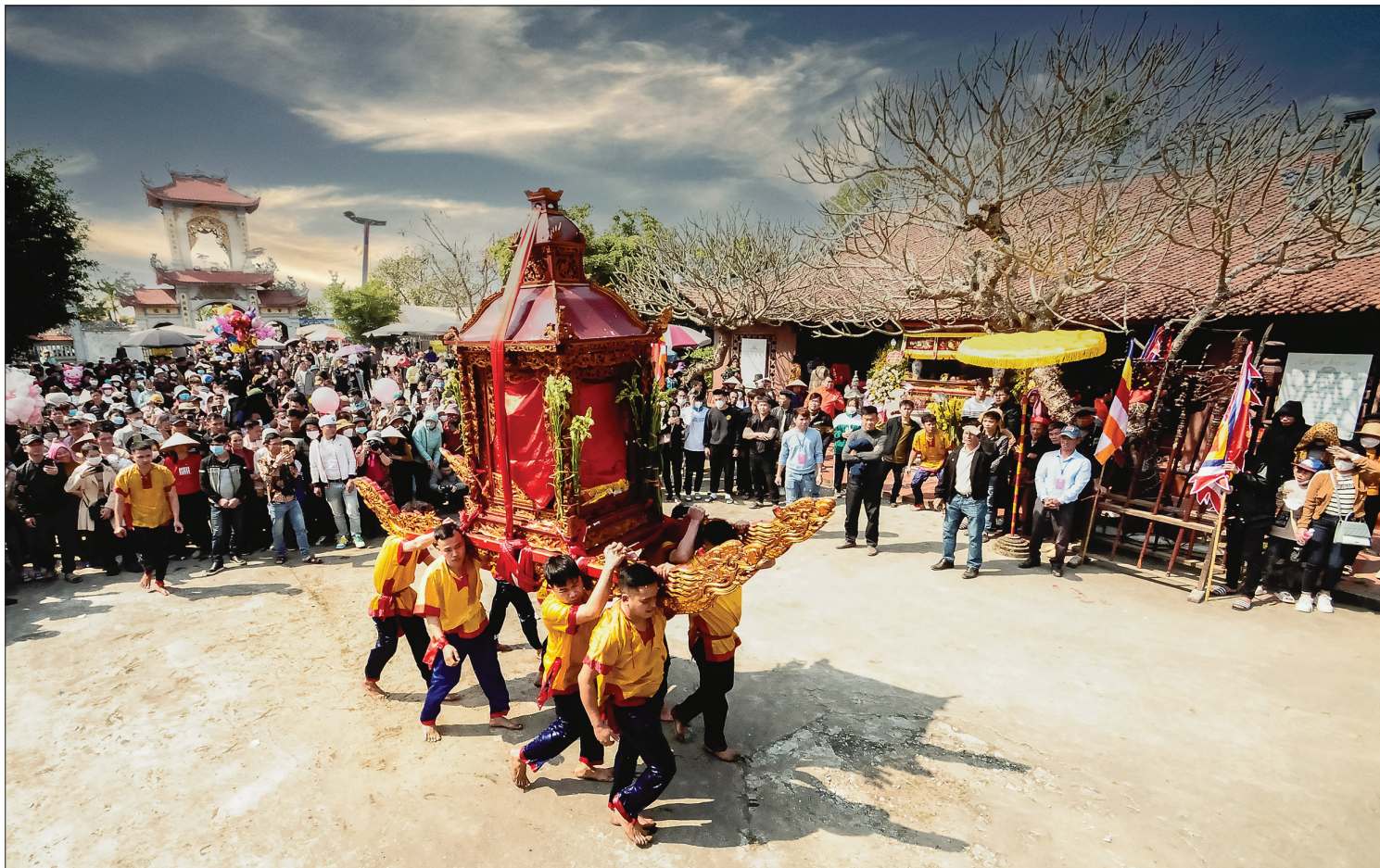
Lễ hội chùa Phương Vũ hay còn gọi là chùa Múa, làng Thọ Lộc, xã Minh Khai, huyện Vũ Thư, nơi thờ Thiền sư Từ Đạo Hạnh.

Cả thiên niên kỷ đã trôi qua nhưng những câu chuyện ly kỳ về Thiền sư Từ Đạo Hạnh vẫn thấm đẫm huyền thoại gắn với mảnh đất làng Thọ Lộc (xã Minh Khai, huyện Vũ Thư) và ngôi chùa nhỏ mang tên Phương Vũ (dân gian gọi là chùa Múa). Mặc dù sự tích thiền sư Từ Đạo Hạnh đã được các nhà nghiên cứu lịch sử thống kê khá đầy đủ trong các tư liệu và thư tịch cổ như “Việt Điện u linh”, “Linh Nam chích quái”, “Thiền uyển tập anh ngữ”, “Đại Việt sử lược”, “An Nam chí lược”, “An Nam chí nguyên”, “Việt sử tiêu án”, “Đại Việt sử ký toàn thư”, “Đại Nam nhất thống chí...” nhưng với người dân làng Thọ Lộc thì chuyện về Thiền sư vẫn nhuộm màu huyền bí.