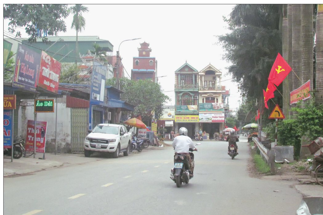
Đổi thay trên quê hương Hưng Nhân.

Những năm qua, Đảng bộ, chính quyền và nhân dân thị trấn Hưng Nhân (Hưng Hà) đã nâng cao năng lực lãnh đạo, sức chiến đấu của Đảng bộ, xây dựng hệ thống chính trị trong sạch, vững mạnh, phát huy dân chủ, đoàn kết, kỷ cương, trách nhiệm; huy động các nguồn lực, khai thác mọi tiềm năng, đẩy mạnh phát triển kinh tế - xã hội, xây dựng thị trấn ngày càng giàu đẹp, văn minh, phát triển bền vững.