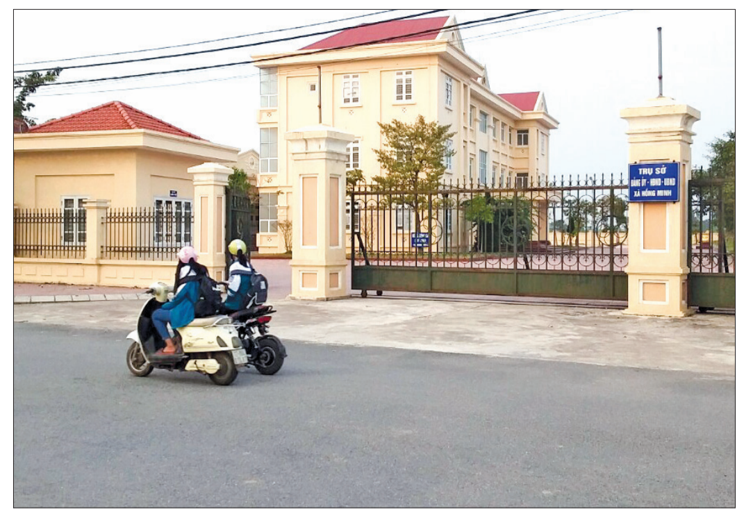
Cơ sở hạ tầng xã Hồng Minh (Hưng Hà) được đầu tư xây dựng khang trang.

Đặc biệt, phải kịp thời phát hiện, khai thác, sử dụng có hiệu quả các nguồn lực, tiềm năng, lợi thế của địa phương; khơi dậy và phát huy sức mạnh vật chất, tinh thần của mỗi người dân, gia đình, dòng họ, đây là nguồn lực chủ yếu, bền vững để phát triển sản xuất và xây dựng NTM. Để tạo sự đồng thuận trong xây dựng NTM, Hưng Hà đã phát động và tổ chức thực hiện hiệu quả phong trào "Đảng bộ và nhân dân Hưng Hà chung sức xây dựng nông thôn mới" gắn với các phong trào hành động cách mạng. Xác định xây dựng NTM là nhiệm vụ trọng tâm, Ban Chấp hành Đảng bộ huyện đã đưa ra chủ trương, giải pháp cụ thể, thiết thực trong công tác lãnh đạo, chỉ đạo điều hành. Với phương châm sâu sát, quyết liệt, cụ thể, huyện đã ban hành các nghị quyết chuyên đề, để án đúng theo chủ trương với lòng dân. Sự sáng tạo, linh hoạt trong tổ chức thực hiện, phát huy dân chủ, công khai, minh bạch đã góp phần đưa chương trình xây dựng NTM ở Hưng Hà đạt được những kết quả vượt trội, minh chứng cho sự thống nhất, đồng thuận