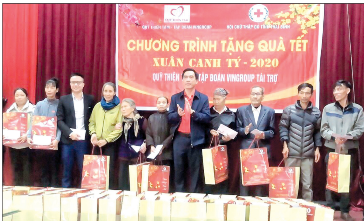
Đại diện Hội Chữ thập đỏ tỉnh và Quỹ Thiện tâm, Tập đoàn Vingroup trao quà Tết cho người nghèo và nạn nhân chất độc da cam huyện Vũ Thu.

Niềm vui của bà Chúc cũng giống như niềm vui của hàng nghìn người nghèo và nạn nhân chất độc da cam trên địa bàn tỉnh khi được nhận quà từ các nhà hảo tâm. Được Hội Chữ thập đỏ Việt Nam phát động từ năm 1999, phong trào "Tết vì người nghèo và nạn nhân chất độc da cam" đã trở thành hoạt động thường niên của các cấp hội chữ thập đỏ trong dịp Tết, nhằm phát huy truyền thống "Lá lành đùm lá rách", tinh thần "Tuông