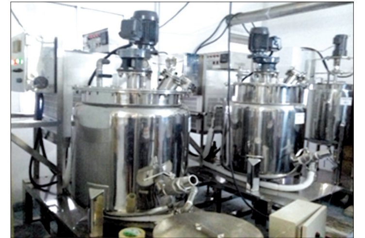
Hệ thống thiết bị chế biến rượu vang điều.

Bộ Khoa học và Công nghệ vừa nghiệm thu nhiệm vụ khoa học và công nghệ cấp quốc gia "Nghiên cứu công nghệ tích hợp hóa sinh chế biến rượu vang chất lượng cao từ quả điều", do Viện Công nghệ hóa học (Viện Hàn lâm Khoa học và Công nghệ Việt Nam) chủ trì.