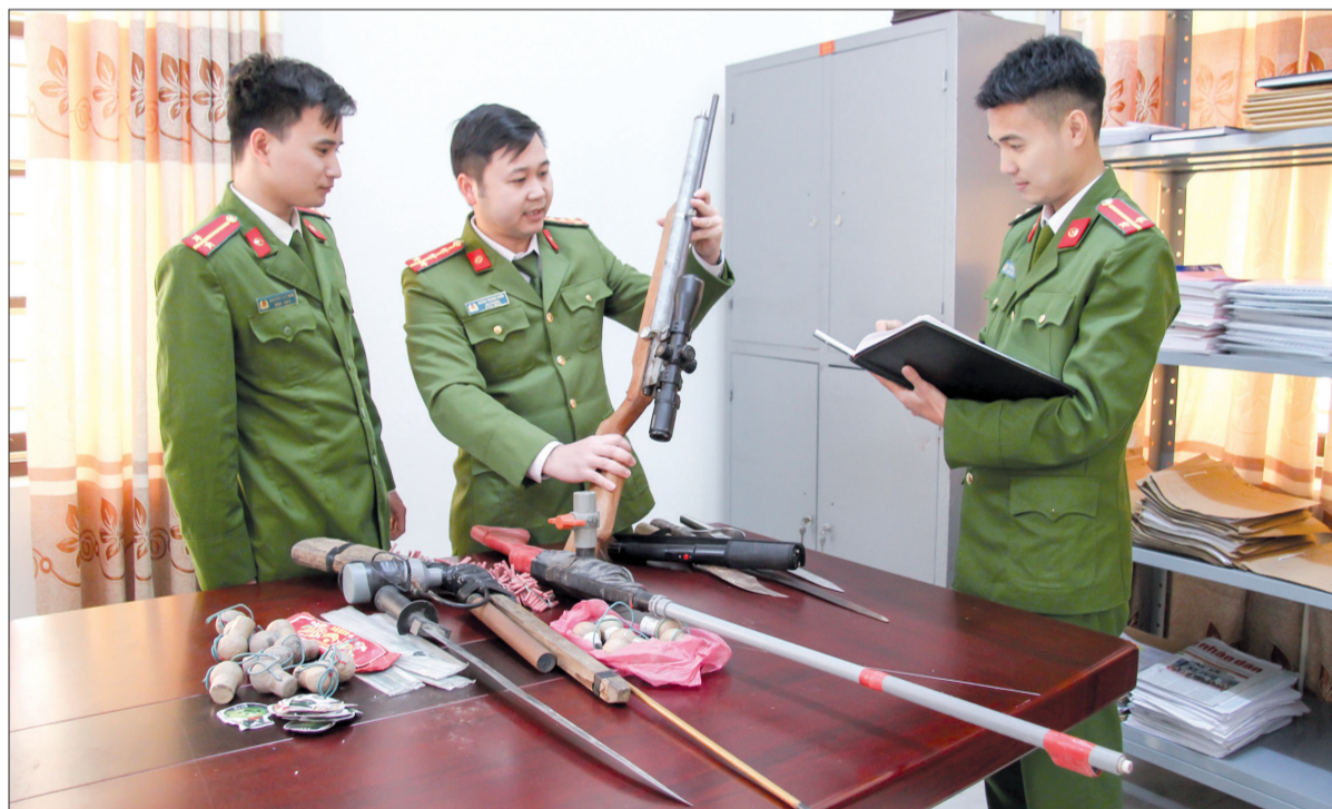
Công an huyện Quỳnh Phụ thu giữ vũ khí, công cụ hỗ trợ do người dân tự giác giao nộp.