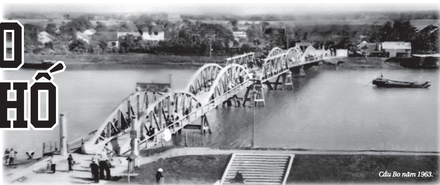
Cầu Bo năm 1963.