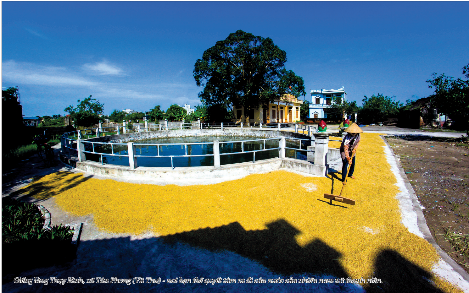
Giếng làng Thụy Bình, xã Tân Phong (Vũ Thư) - nơi hẹn thề quyết tâm ra đi cứu nước của nhiều nam nữ thanh niên.

Giữa năm 1965, đế quốc Mỹ mở rộng chiến tranh bằng cách đưa lực lượng không quân vào tham chiến bên Lào, đẩy chiến tranh đặc biệt ở Lào phát triển đến cao độ, đồng thời tiến hành chiến lược “chiến tranh cục bộ” ở miền Nam Việt Nam, leo thang phá hoại miền Bắc Việt Nam bằng cả không quân và hải quân. Đầu năm 1966, nhận chỉ thị của trung ương, tỉnh Thái Bình tuyển chọn 100 nữ thanh niên ở bốn huyện, thị xã là Đông Quan (nay là Đông Hưng), Thư Trì, Vũ Tiên (nay là Vũ Thư) và thị xã Thái Bình (nay là thành phố Thái Bình), những nữ thanh niên đầu tiên của tỉnh gia nhập quân đội, tăng cường cho Quân khu Tây Bắc và làm nhiệm vụ quốc tế trên đất nước triệu voi.