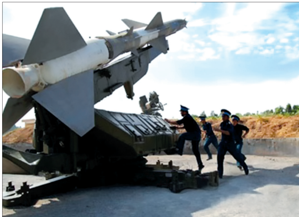
Các chiến sĩ Tiểu đoàn 44, Trung đoàn tên lửa 263 luyện tập.

Chiến công đầu tiên của Tiểu đoàn 56 là ngày 2/1/1969 bắn hạ 1 máy bay không người lái 147J của Mỹ khi vào thám thính Hà Nội. Và từ ngày 2/1 đến ngày 28/8/1969, Tiểu đoàn 56 đã ấn nút là tiêu diệt địch với 4 trận đánh xuất sắc bắn rơi 4 máy bay không người lái, góp phần bảo vệ Thủ đô. Trong cuốn lịch sử Trung đoàn có những dòng ấn tượng: "Kết quả rực rỡ đó làm cho Tiểu đoàn 56 trở thành đơn vị dẫn đầu trong bảng vàng chiến công đánh máy bay địch không người lái của Trung đoàn. Những kinh nghiệm quý báu của Tiểu đoàn 56 đã được Ban Tham mưu Trung đoàn tổng hợp, biên soạn thành tài liệu và phổ biến cho các đơn vị. Trung