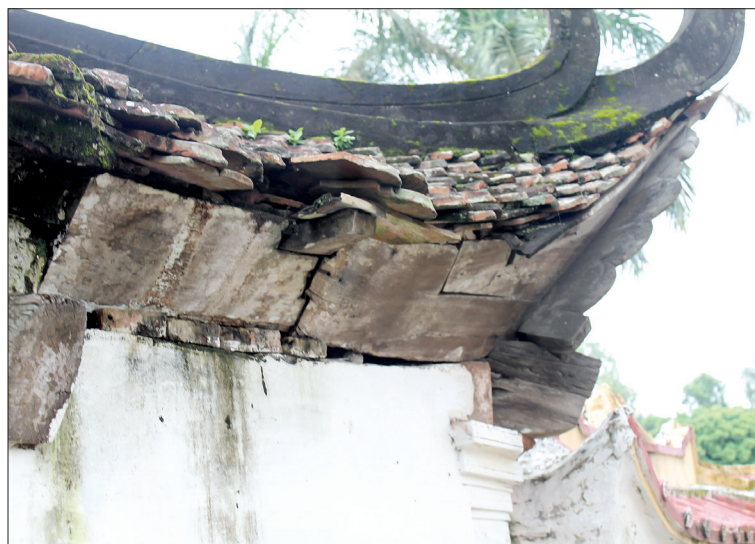
Nên lún làm một góc đình nứt toác, có thể rơi ra khi có tác động rất nhỏ.