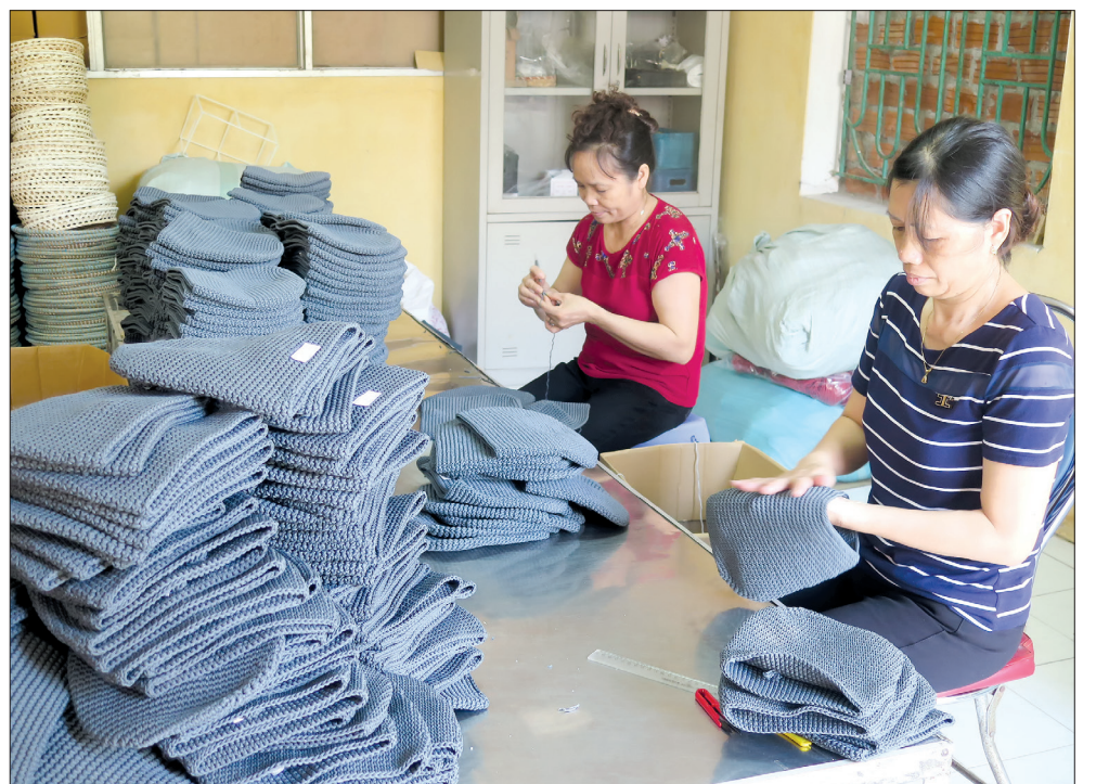
Công ty giải quyết việc làm cho hơn 5.000 lao động.