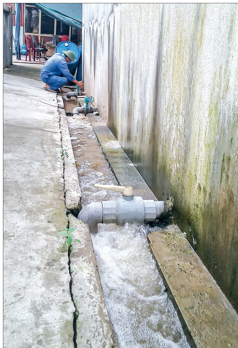
Xả bể lắng của Công ty TNHH Xây dựng và thương mại Hiền Hòa.