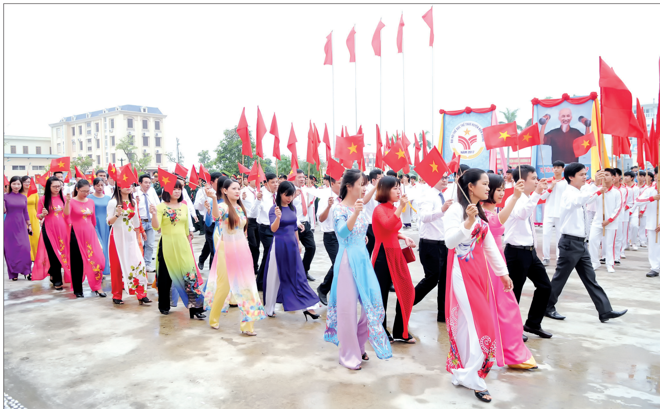
Diễu hành trong lễ khai mạc Đại hội.