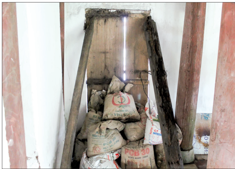
Cánh cửa hữu của đình đã hỏng nhiều năm nay, được chèn tạm bằng bao cát.

khách vào thăm, thắp hương tưởng niệm Bác Hồ và các anh hùng liệt sĩ tại đình tôi thấy nguy cơ không bảo đảm an toàn, đặc biệt trong mùa mưa, bão. Tôi lo đình có thể đổ sập.