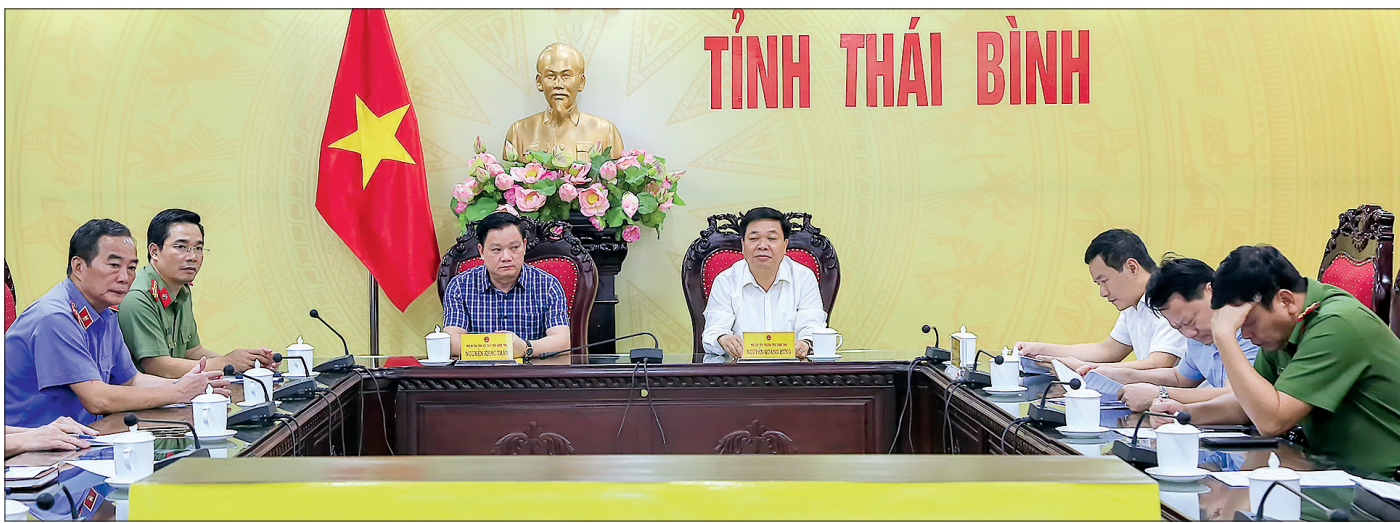
Các đồng chí lãnh đạo tỉnh và đại biểu dự hội nghị tại điểm cầu Thái Bình.

trật tự ATGT, phạt tiền hơn 39,2 tỷ đồng, tạm giữ 30.673 xe mô tô; xử lý 3 vụ đua xe trái phép, tạm giữ 57 đối tượng trong lứa tuổi học sinh, 51 xe mô tô; 201 vụ tập chạy xe phóng nhanh, lạng lách, đánh võng gây mất trật tự công cộng, tạm giữ 395 đối tượng lứa