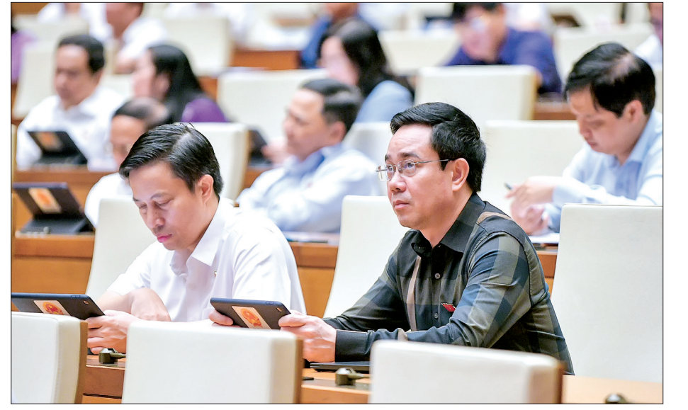
Các đại biểu Quốc hội tỉnh Thái Bình dự phiên họp.

ý kiến quan trọng, tâm huyết về ngân sách nhà nước, tài chính quốc gia, an toàn nợ công, an ninh tài chính quốc gia, bảo đảm nguồn lực ngân sách nhà nước cho phát triển kinh tế - xã hội. Các đại biểu cũng thống nhất, năm 2023 và từ đầu nhiệm kỳ đến nay, bối cảnh thế giới và kinh tế - xã hội trong nước gặp nhiều khó khăn, ảnh hưởng lớn đến thu, chi ngân sách nhà nước. Tuy nhiên, việc quản lý, điều hành ngân sách nhà nước có nhiều kết quả tích cực: thu ngân sách nhà nước năm 2021, 2022 vượt rất cao so với dự toán, năm 2023 dự kiến đạt dự toán. Nhiều chính sách miễn, giảm, gia hạn thuế được thực hiện để hỗ trợ người dân, doanh nghiệp khắc phục khó khăn, khôi phục sản xuất. Tỷ trọng thu nội địa trong tổng thu tăng dần, cơ cấu chi tiếp tục dịch chuyển tích cực, các nhiệm vụ chi cho an sinh xã hội, an ninh, quốc phòng cần bản được bảo đảm. Công tác quản lý nợ công có nhiều tiến bộ, các chỉ tiêu an toàn nợ của ngân sách trung ương và ngân sách địa phương trong mức trần và ngưỡng an toàn.