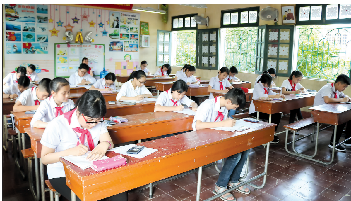
Học sinh Trường THCS Minh Thành (thành phố Thái Bình) làm bài kiểm tra chất lượng cuối năm học.

Tháng 5 đến cũng là lúc một mùa thi nữa của học sinh lại về. Tại các trường tiểu học, THCS trên địa bàn thành phố Thái Bình, việc tổ chức kiểm tra chất lượng cuối năm học đang được các trường thực hiện nghiêm túc, chặt chẽ, bảo đảm kết quả khách quan. Ở cấp tiểu học, Thông tư số 22/2016/TT-BGDĐT có hiệu lực thi hành từ ngày 6/11/2016 đã quy định cụ thể về việc đánh giá định kỳ về học tập. Để kiểm tra yêu cầu phải phù hợp chuẩn kiến thức, kỹ năng và định hướng phát triển năng lực, gồm các câu hỏi, bài tập được thiết kế theo 4 mức độ: nhận biết, hiểu, vận dụng và vận dụng nâng cao. Sau khi tham gia các buổi tập huấn do Phòng Giáo dục và Đào tạo thành phố tổ chức, các giáo viên đã được nâng cao năng lực trong việc thực hành biên soạn đề kiểm tra đánh giá định kỳ, nắm vững nguyên tắc, kỹ thuật, quy trình xây dựng ma trận để kiểm tra đánh giá định kỳ và rèn luyện kỹ năng ra đề kiểm tra định kỳ theo ma trận. Hầu hết giáo viên đã đổi mới hình thức ra đề kiểm tra đánh giá dựa trên cơ sở chuẩn kiến thức kỹ năng các môn học và định hướng phát triển năng lực, gồm các câu hỏi, bài tập được thiết kế theo 4 mức độ: nhận biết, hiểu, vận dụng và vận dụng nâng cao nhưng vẫn bảo đảm tính nhẹ nhàng, thoải mái,