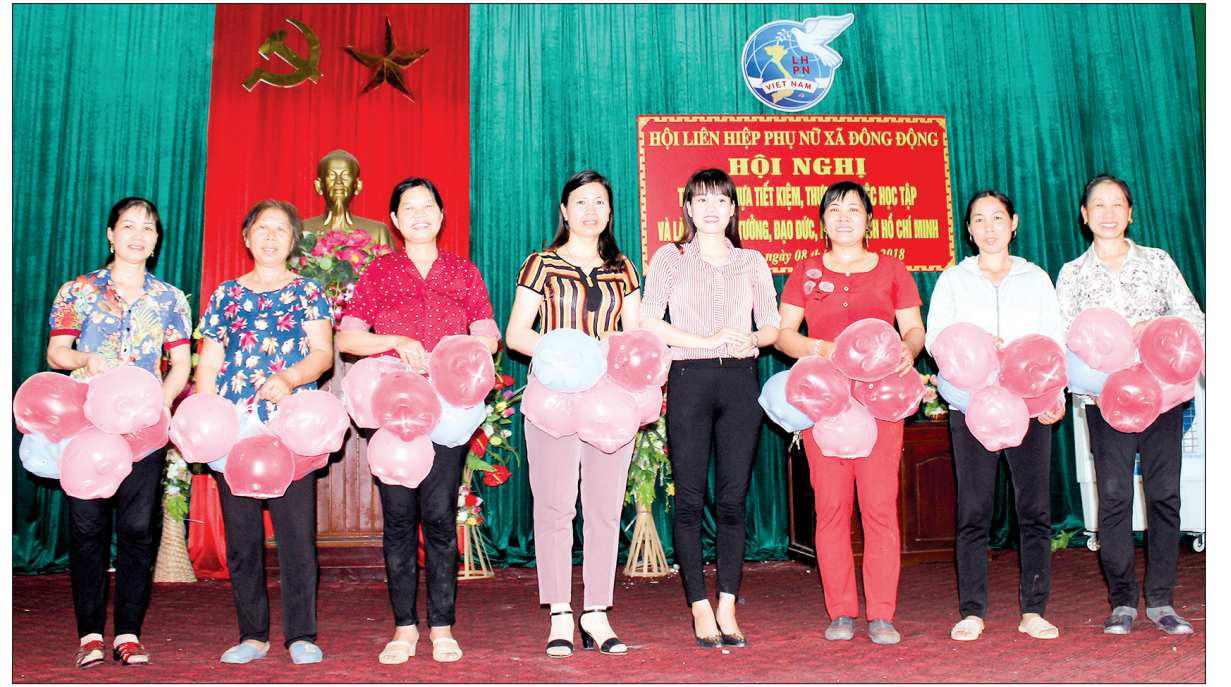
Hội Liên hiệp Phụ nữ xã Đông Động (Đông Hưng) tổ chức trao lợn nhựa tiết kiệm.