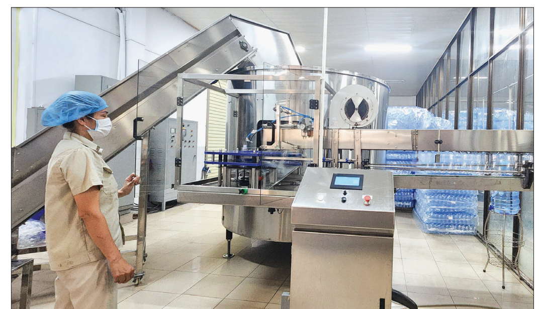
Sáu tháng đầu năm 2024, giá trị sản xuất công nghiệp của thành phố ước đạt 16.158 tỷ đồng. Trong ảnh: Dây chuyền sản xuất của Công ty Cổ phần Dịch vụ đầu khí Thái Bình.

Ông Đinh Gia Dũng, Chủ tịch UBND thành phố cho biết: Để hoàn thành và hoàn thành vượt các mục tiêu, nhiệm vụ phát triển kinh tế - xã hội năm 2024, UBND thành phố sẽ tập trung vào công tác chỉ đạo, điều hành, phát huy tinh thần trách nhiệm của các tập thể và mỗi cá nhân, nhất là cán bộ lãnh đạo, người đứng đầu; tập trung khắc