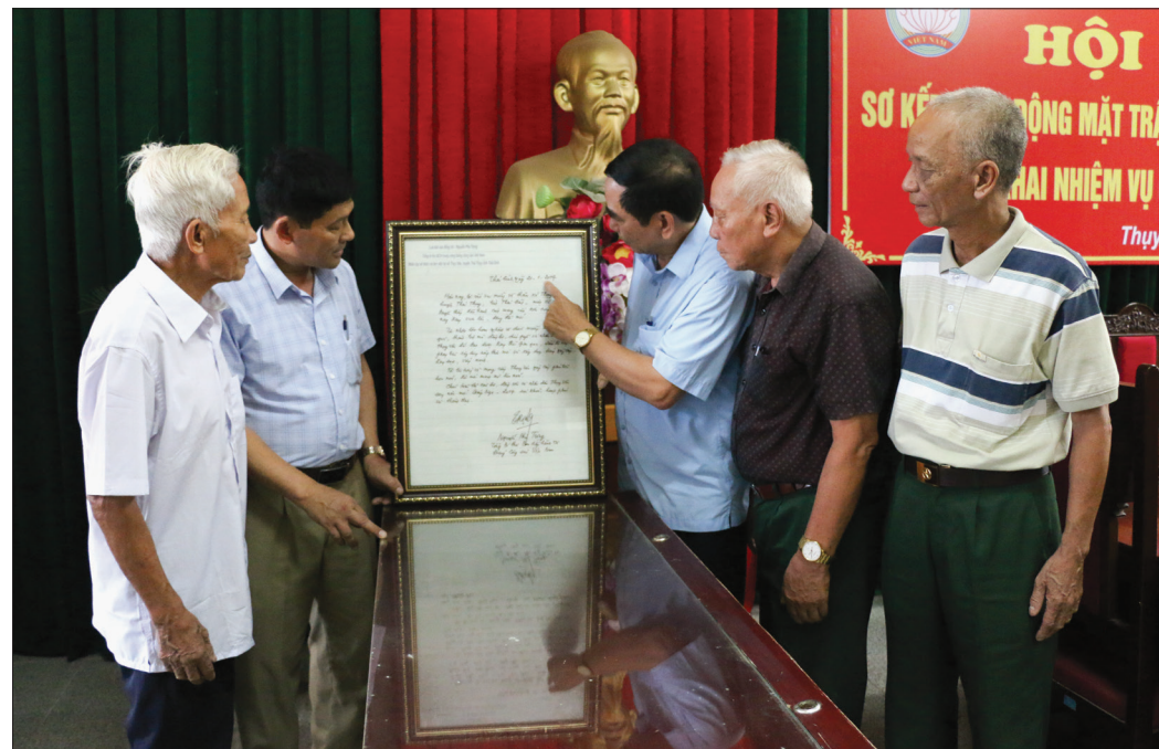
Cán bộ, đảng viên và nhân dân xã Thụy Văn (Thái Thụy) luôn trân trọng lưu giữ lưu bút của Tổng Bí thư Nguyễn Phú Trọng.