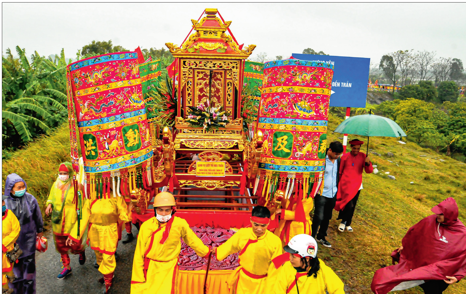
Rước linh vị các vua Trần, lễ hội đền Trần (xã Tiến Đức, huyện Hưng Hà).

Theo các tài liệu nghiên cứu, có nhiều ý kiến cho rằng 43 năm sau khi xây dựng cung Ngự Thiên (từ năm 1156 đến năm 1209), con cháu nhà Trần Lý (lúc đó đã rời hương Tức Mặc) tụ cư quanh khu vực Thái Đường (Tiến Đức, Hưng Hà). Do lánh nạn loạn Quách Bốc, vua Lý Cao Tông chạy đi Hưng Hóa, Thái tử Sảm chạy về hành cung Ngự Thiên; thấy vậy, Tô Trung Từ rước Thái tử Sảm sang nhà công quán thôn Lưu Gia (nay là Lưu Xá, xã Canh Tân, Hưng Hà) lánh nạn. Các nhà nghiên cứu cho rằng, Trần Lý là người mở đường để các con ông là Trần Thị Dung, Trần Thừa, Trần Tự Khánh khuếch trương sự nghiệp, dần trở thành các bậc lương đống cuối đời Lý.