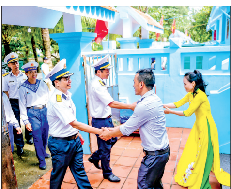
Lễ chùa xong, cán bộ, chiến sĩ trên đảo Trường Sa đến chúc tết các hộ dân.