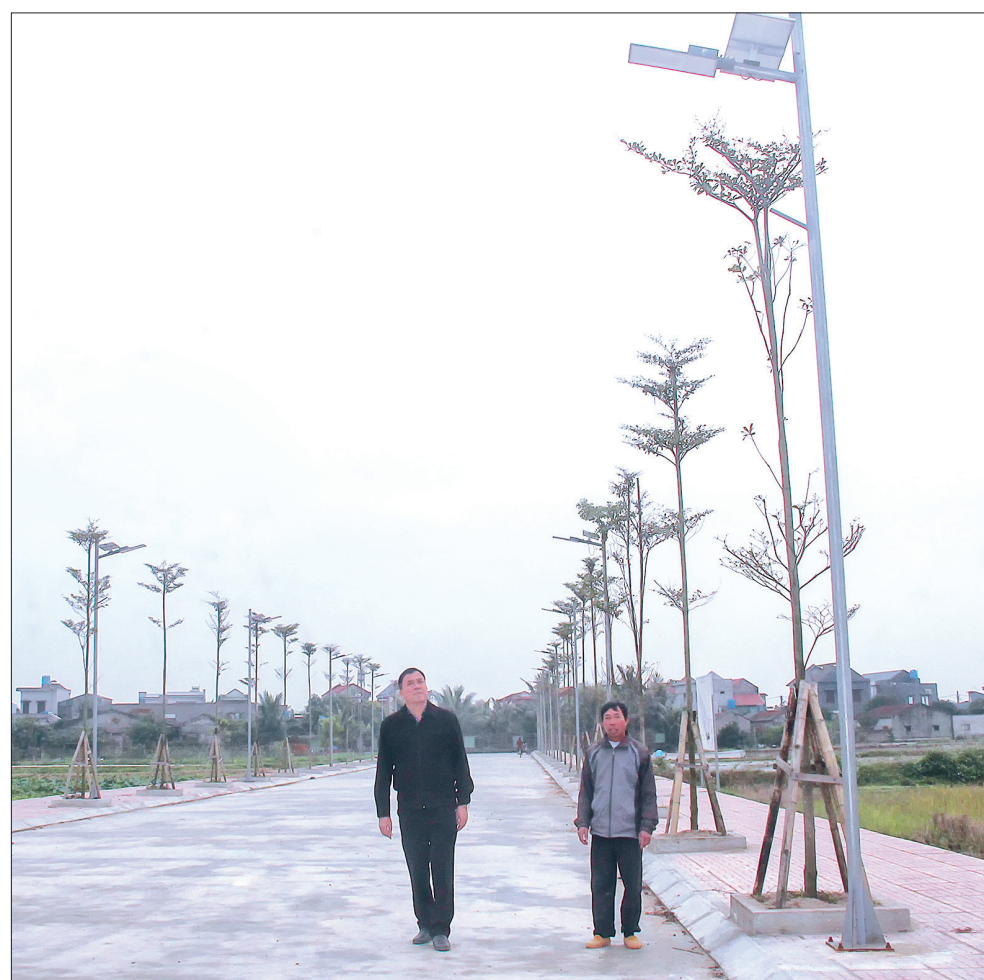
Xã Đông Xá là địa phương đi đầu huyện Đông Hưng trong thực hiện chương trình “Thắp sáng đường quê”.

Nhận thấy mô hình “Thắp sáng đường quê” góp phần thực hiện mục tiêu xây dựng NTM sáng - xanh - sạch - đẹp, huyện Quỳnh Phụ đã ban hành cơ chế hỗ trợ 10 triệu đồng/km, cùng với cơ chế hỗ