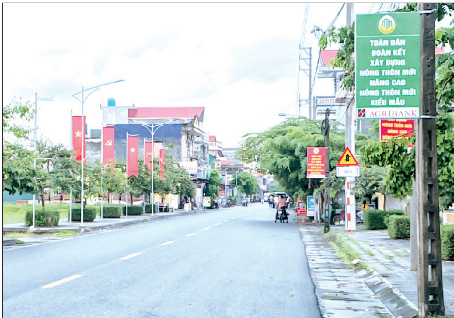
Xã Quỳnh Thọ (Quỳnh Phụ) lắp đặt được gần 18km đèn điện theo chương trình “Thắp sáng đường quê”.

“Thắp sáng đường quê” là chương trình có ý nghĩa thiết thực trong xây dựng nông thôn mới (NTM), không chỉ giúp nhân dân đi lại thuận tiện mà còn góp phần bảo đảm an ninh trật tự, an toàn giao thông.