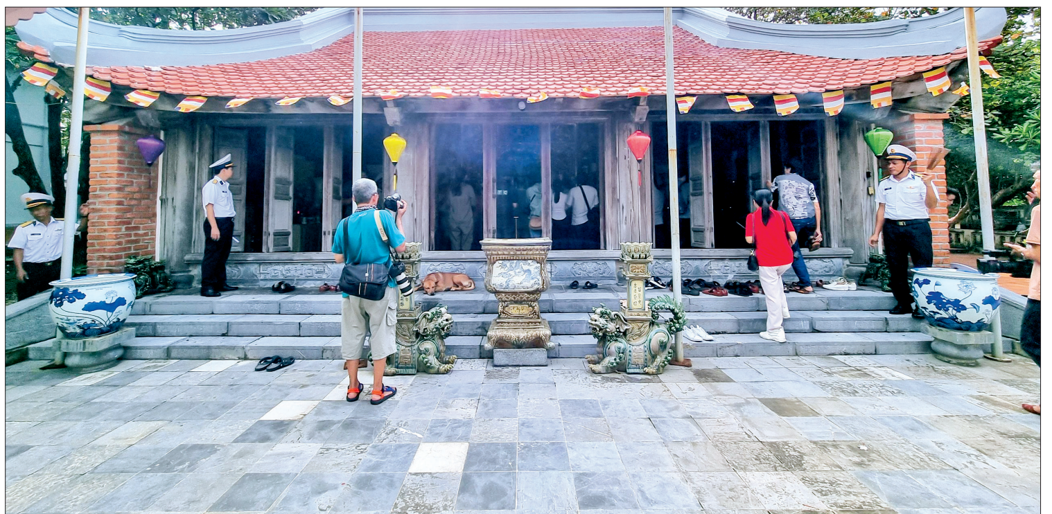
Gian điện thờ trong khu vực chùa Trường Sa.