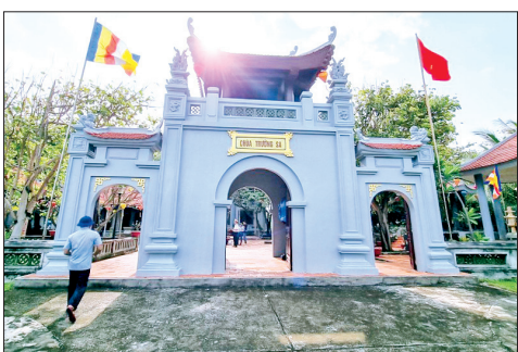
Chùa Trường Sa, điểm tựa tâm linh và cũng là chốn linh thiêng trên huyện đảo Trường Sa.