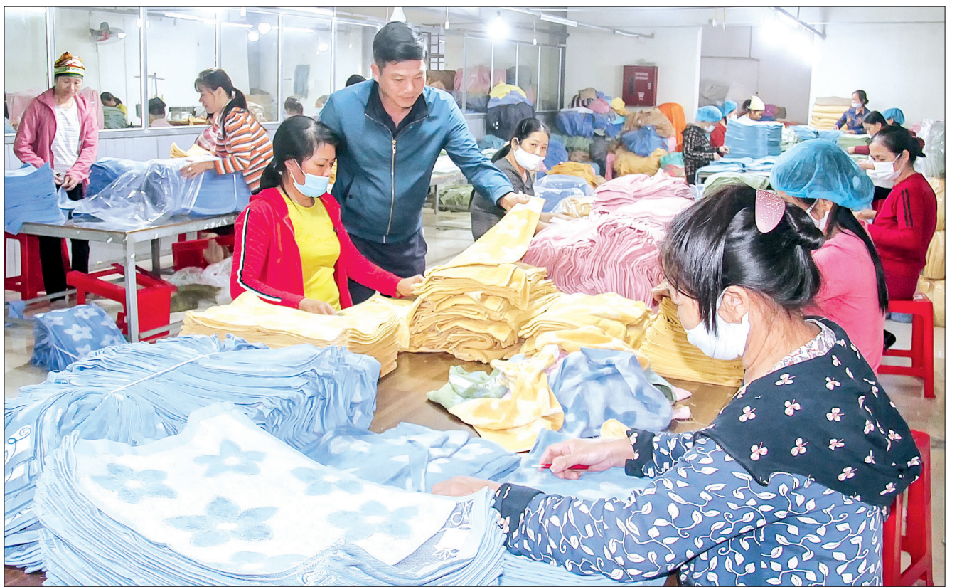
Công ty TNHH Châu Minh hướng đến sản phẩm an toàn, thân thiện với môi trường.