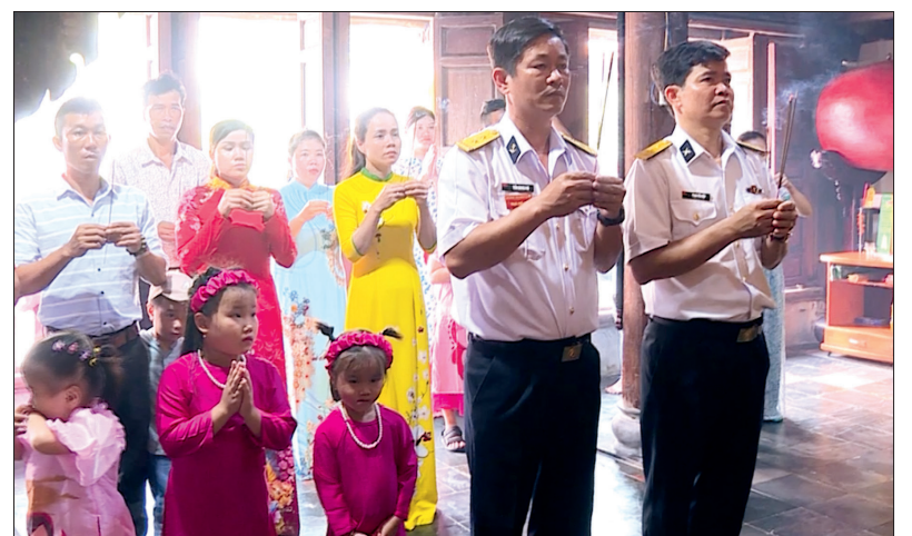
Cán bộ, chiến sĩ và nhân dân đảo Đá Tây, huyện đảo Trường Sa trang phục chỉnh tề đi lễ chùa đầu năm.