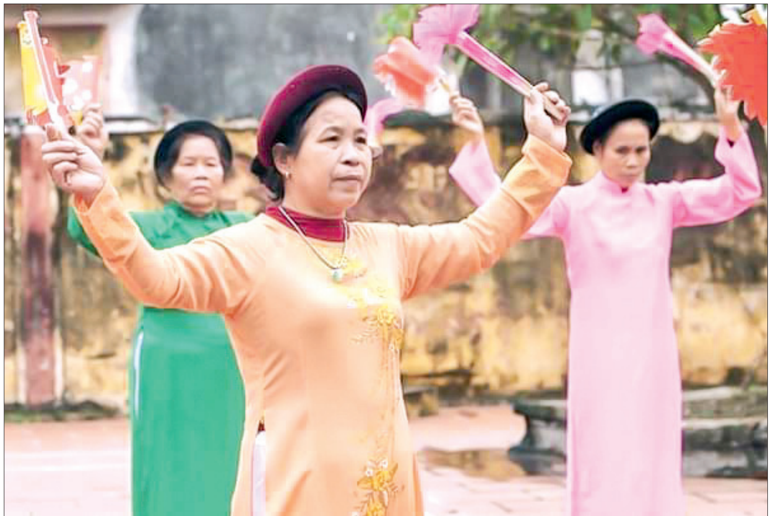
Múa giáo cờ giáo quạt ở làng Thượng Liệt.

Đạo cụ truyền thống của múa giáo cờ giáo quạt rất đơn giản, chỉ có một trống cái làm hiệu lệnh chỉ huy và cờ, quạt nhỏ bằng giấy cho các cô lên (tay phải cầm cờ, tay trái cầm quạt). Trang phục cổ truyền được duy trì nghiêm cẩn với ông Thầy, bà Thọ, ông Rống và ông Quản trò. Các cô lên mặc áo dài, khăn đỏ, thắt lưng xanh yếm đào. Riêng hai cô đi sứ: mặc