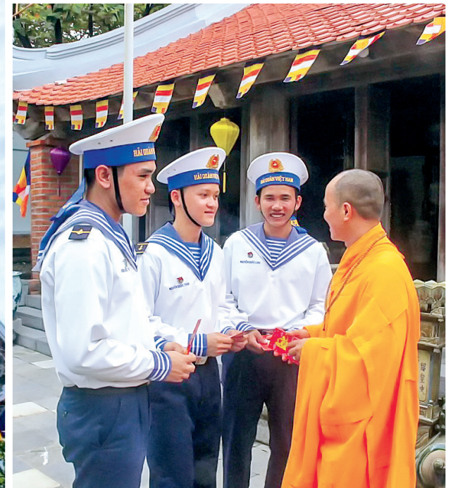
Sư trụ trì chùa Trường Sa mừng tuổi các chiến sĩ đầu năm mới.