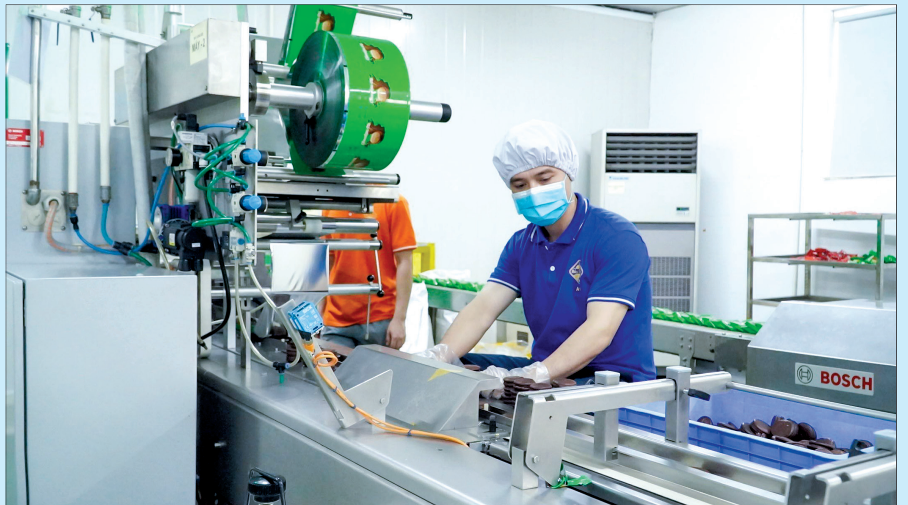
Sản xuất tại Công ty Cổ phần Quốc tế Bảo Hưng (cụm công nghiệp Tân Minh, huyện Vũ Thư).