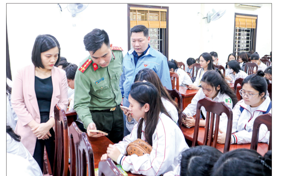
Cán bộ Đoàn Thanh niên Công an tỉnh và Thành đoàn Thái Bình hướng dẫn học sinh Trường THPT Nguyễn Đức Cảnh làm bài thi tìm hiểu Đề án 06.