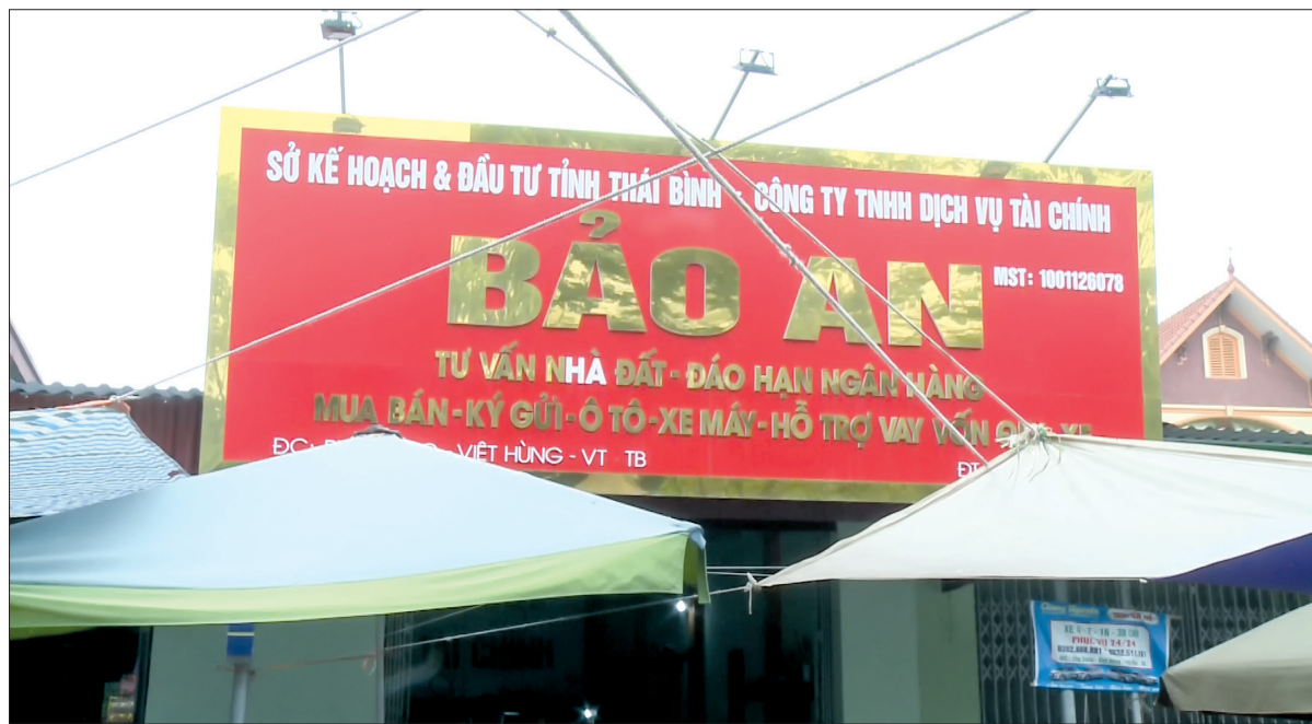
Doanh nghiệp dịch vụ tài chính xuất hiện nhiều ở vùng nông thôn.

Đình Trong của làng La Điện, xã Tự Tân (Vũ Thư) nằm trên đất xóm Nam Long. Đình là chốn linh thiêng, thờ cúng thần hoàng làng - người góp công cứu nước thuở xưa; là nơi tế lễ đậm nét văn hóa tâm linh, nơi hội họp, làm việc của chức việc làng, tổng; là chứng tích đau thương, hào hùng của làng những năm đánh Pháp. Cả một đời bó bện với làng, lại ưa thích tìm hiểu lịch sử, văn hóa, cha tôi hiểu sâu sắc và truyền dạy cho anh em chúng tôi những điều đó.