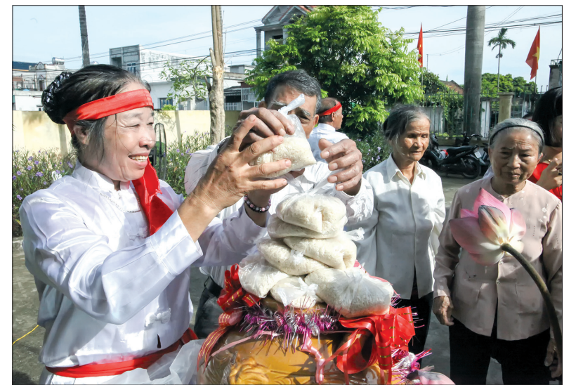
Hũ gạo tình thương của Câu lạc bộ đã quyên góp được hơn 145kg gạo giúp đỡ thành viên có hoàn cảnh khó khăn.

Sau 1 năm đi vào hoạt động, Câu lạc bộ (CLB) liên thế hệ tự giúp nhau thôn Tiên Phong, xã Vũ Tây (Kiến Xương) đã phát huy hiệu quả tích cực. Hoạt động của CLB không chỉ góp phần cải thiện sức khỏe, tinh thần và phát huy vai trò của người cao tuổi trong hoạt động cộng đồng mà còn quản lý tối ưu nguồn vốn để nhân rộng mô hình sang các thôn khác.