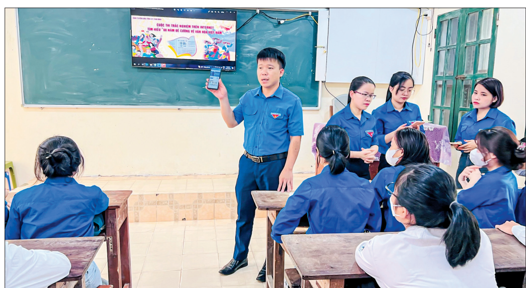
Cán bộ Huyện đoàn Kiến Xương hướng dẫn các đoàn viên của Trường THPT Chu Văn An tham gia cuộc thi trắc nghiệm trên internet tìm hiểu "80 năm Đề cương về văn hóa Việt Nam".