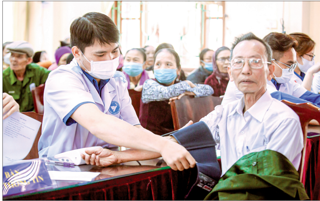
Đoàn Thanh niên Trường Đại học Y dược Thái Bình khám bệnh, tư vấn sức khỏe, cấp thuốc cho người dân xã Tân Hòa (Vũ Thu).

Công tác phát triển đảng viên trong học sinh, sinh viên (HSSV) không chỉ có ý nghĩa quan trọng đối với mỗi cá nhân, đảng bộ, chi bộ nhà trường mà rộng hơn nữa là với sự phát triển của toàn Đảng. Nghị quyết số 25-NQ/TW của Ban Chấp hành Trung ương Đảng khóa X về tăng cường sự lãnh đạo của Đảng đối với công tác thanh niên thời kỳ đẩy mạnh công nghiệp hóa, hiện đại hóa đặt ra mục tiêu: "Phần đầu đạt tỷ lệ ít nhất 70% đảng viên mới được kết nạp từ đoàn viên". Với lực lượng đoàn