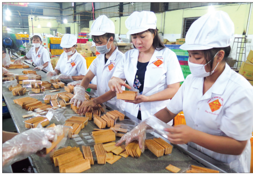
Mỗi năm Công ty Bánh kẹo Bảo Hưng trao hàng nghìn suất quà cho các gia đình chính sách và hộ nghèo trên địa bàn tỉnh.

Ông Đông nhấn mạnh thêm: Kết quả trên là thách thức không hề nhỏ, tuy nhiên, nếu dừng lại ở con số này thì sẽ thất bại bởi muốn phát triển được nhất định Hiệp hội phải bảo đảm cả về số lượng và chất lượng. Hai yếu tố này tạo nên nền tảng phát triển của Hiệp hội, do đó kể từ sau khi tổ chức Đại hội lần thứ III, Hiệp hội đã đề ra một số biện pháp cụ thể. Trong công tác tuyên truyền, Hiệp hội đã cùng lãnh đạo các huyện vào cuộc thực hiện một cách thiết thực, hiệu quả hơn. Đặc biệt, đã giao cho 7 đồng chí trong Ban Vận động phát triển hội viên mỗi người phụ trách một số huyện, thành phố. Bên cạnh đó, Hiệp hội sẽ tiếp tục phân loại từng đối tượng hội viên để tiếp cận theo nhiều hướng như doanh nghiệp mới thành lập ở các cụm công nghiệp, doanh