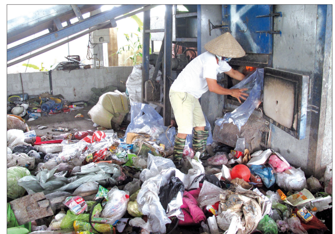
Khu xử lý rác thải sinh hoạt của xã Minh Khai (Hưng Hà).