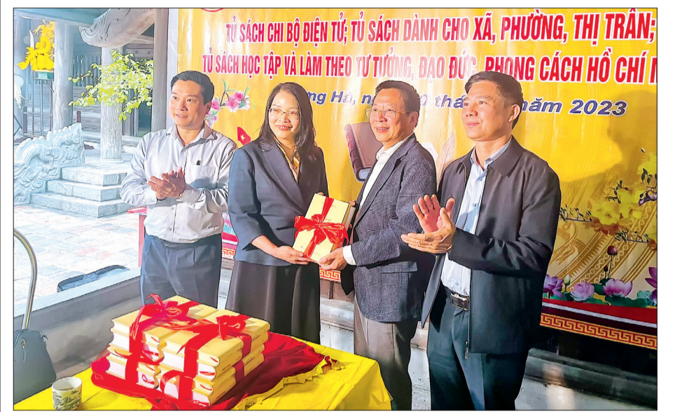
Đại diện Nhà xuất bản Chính trị Quốc gia Sự thật tặng sách cho Huyện ủy Hưng Hà.

Tại đền Trần, xã Tiến Đức, Nhà xuất bản Chính trị Quốc gia Sự thật vừa tổ chức trao tặng "Tủ sách chi bộ điện tử; tủ sách dành cho xã, thị trấn; tủ sách học tập và làm theo tư tưởng, đạo đức, phong cách Hồ Chí Minh" cho huyện Hưng Hà.