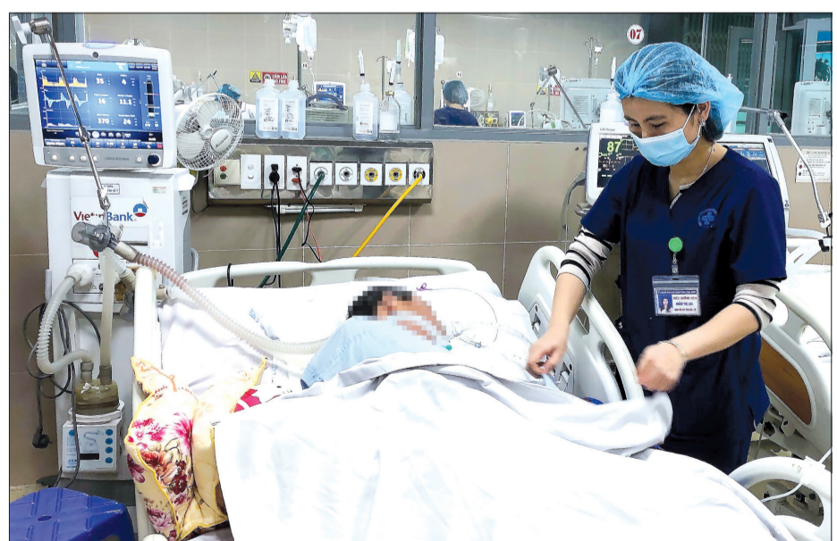
Bệnh nhân ngộ độc rượu điều trị tại Bệnh viện Đa khoa tỉnh.

Mới đây, tại thành phố Thái Bình đã ghi nhận bệnh nhân bị ngộ độc nặng do rượu. Sau khi ăn, uống rượu trắng ở bữa tiệc khai xuân đầu năm mới, bệnh nhân có dấu hiệu mệt mỏi, khó chịu, được người thân đưa đến Bệnh viện Đa khoa Vũ Thư khám. Diễn biến bệnh chuyển nặng nhanh, bệnh nhân tiếp tục được đưa lên Bệnh viện Đa khoa tỉnh, sau đó chuyển tiếp lên Bệnh viện Bạch Mai với các triệu chứng hôn mê, co giật, tụt huyết áp... Sau hơn 2 tuần điều trị song do tình trạng bệnh quá nặng, không đáp ứng điều trị, bệnh nhân đã tử vong.