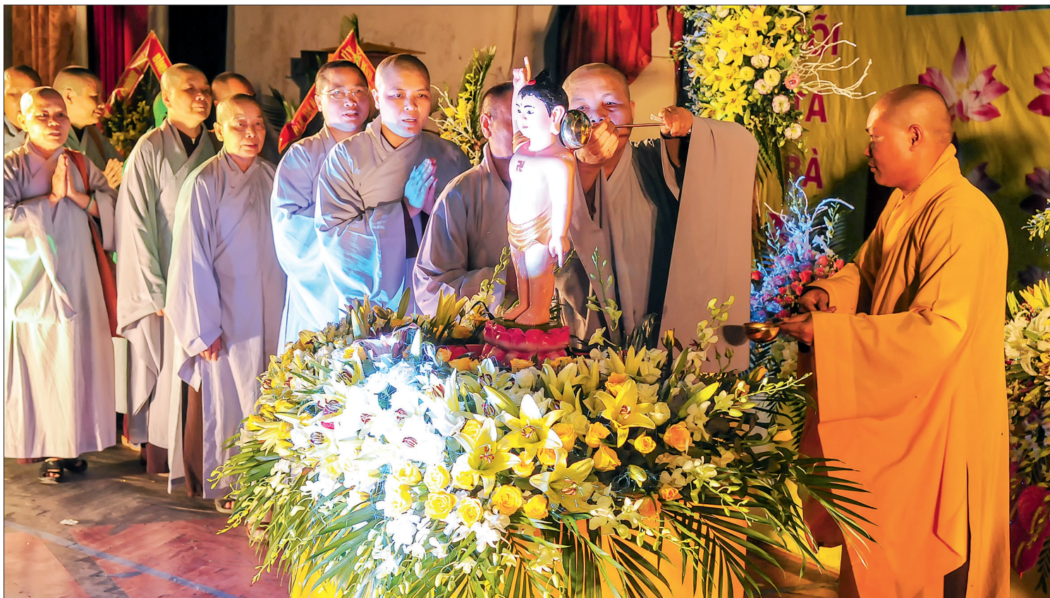
Nghi lễ tắm Phật.

Phật đản và Vu lan là hai ngày lễ trọng trong năm của Phật giáo. Phật đản nghĩa là ngày sinh của đức Phật Thích Ca. Với những nước có Phật giáo thì lễ Phật đản diễn ra hàng năm vào ngày mùng 8/4 hoặc ngày 15/4 âm lịch, tùy theo từng quốc gia. Tuy nhiên, theo truyền thống Phật giáo Bắc tông và ảnh hưởng của Phật giáo Trung Hoa, ngày lễ Phật đản là ngày kỷ niệm sự ra đời của Đức Phật Thích Ca, nhưng theo Phật giáo Nam truyền và Phật giáo Tây Tạng thì đó là ngày Tam hiệp với ý nghĩa vừa là ngày sinh, ngày thành đạo và cũng là ngày nhập niết bàn của đức Phật.