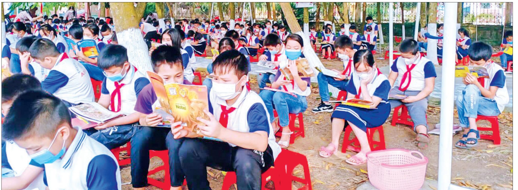
Đội viên Liên đội Trường Tiểu học An Bài (Quỳnh Phụ) tham gia ngày hội sách năm 2022.