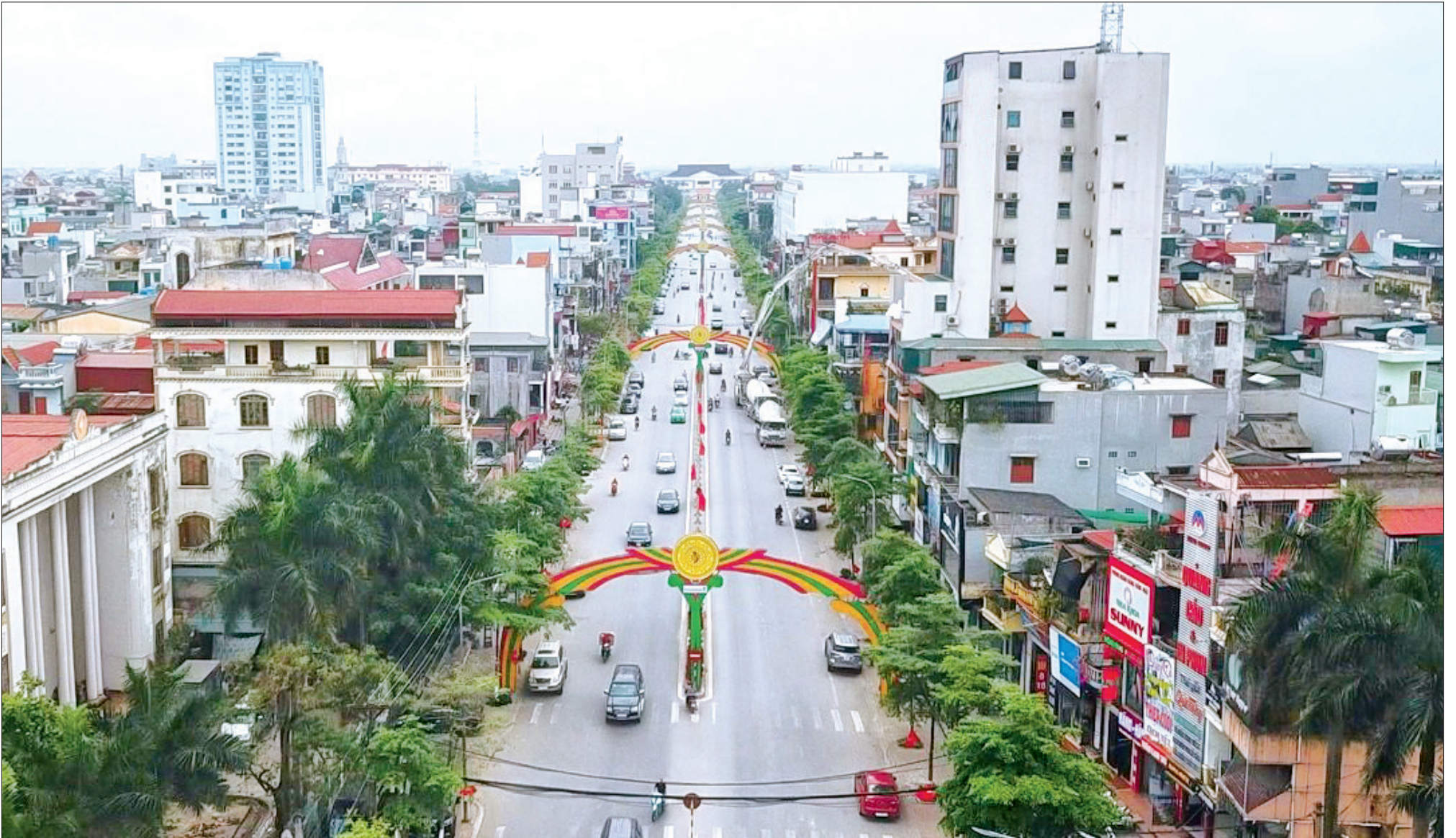
Thành phố Thái Bình.