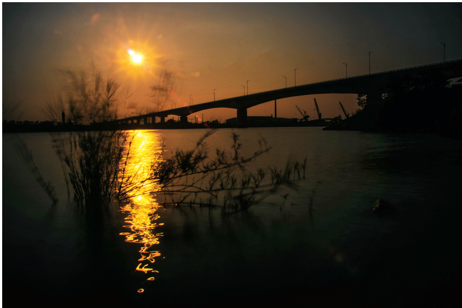
Bến đò Nhật Tảo xưa và nay là cầu Thái Hà thuộc địa phận xã Tiến Đức, huyện Hưng Hà nối đôi bờ sông Hồng giữa Thái Bình và Hà Nam.

Theo các nguồn khảo luận, vùng đất Tây Nam huyện Hưng Hà, Đông Hưng và Bắc huyện Vũ Thư là một dải đất liền hoàn có nhiều đồn quán, kho lương của Lý Nam Đế trong cuộc khởi nghĩa chống nhà Lương năm 541, nên dân gian có câu: “Gạo Lộc Điền, tiền làng Búng, thúng làng Roi, ngòi Thanh Bản” chính là sự tổng kết về một thời vàng son, oanh liệt xây dựng căn cứ địa kháng chiến của vua Tiên Lý ở đất Thái Bình. Ngót ngàn năm sau, sách “Lưu Đồn phá kỷ” có ghi chép về chiến thuật quân sự nhà Trần trong hai lần chiến thắng quân Nguyên Mông (1285 - 1288), Hưng Đạo Đại vương Trần Quốc Tuấn đã thực hiện chiến thuật “Khởi thủy phương, triệu thủy phương” nghĩa là lấy sông nước làm thế trận đánh giặc và khi rút quân cũng theo đường sông nước mà rút ra biển cả.