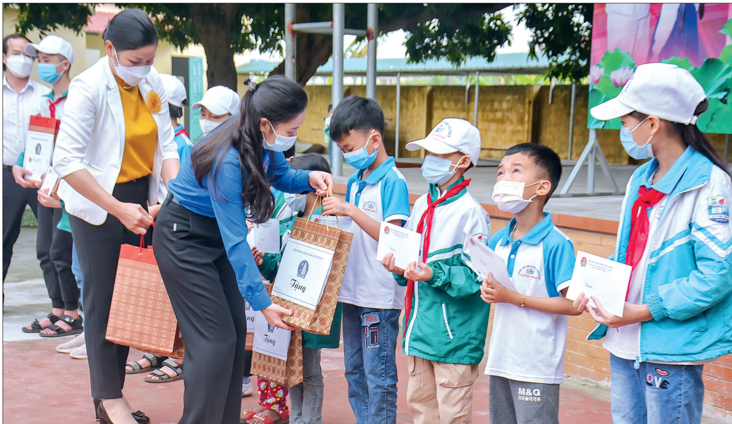
Lãnh đạo Tỉnh đoàn, Hội đồng Đội tỉnh tặng quà đội viên có hoàn cảnh khó khăn.

Thực hiện mục tiêu “Tất cả vì dân em thân yêu”, thời gian qua, đoàn thanh niên, đội thiếu niên tiên phong Hồ Chí Minh các cấp đã tổ chức nhiều phong trào, hoạt động để tập hợp đội viên, giúp các em được học tập, vui chơi, chăm sóc sức khỏe, phát triển toàn diện.