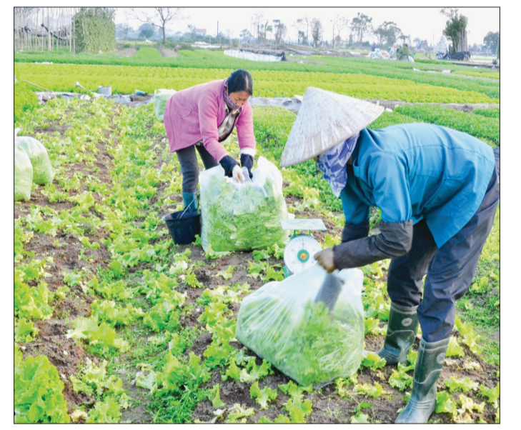
Nông dân xã Vũ Phúc (thành phố Thái Bình) làm giàu từ rau màu.