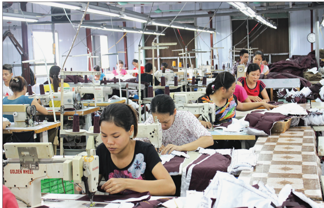
Cơ sở may Quý Khang (xã Thụy Dân, huyện Thái Thụy) tạo việc làm cho hàng trăm lao động.

Những năm qua, nhiều ngành nghề, công nghiệp phát triển, hàng trăm xí nghiệp có quy mô lớn đã hiện hữu ở các vùng nông thôn, các làng nghề bắt đầu đi lên làm giàu cho xã hội. Có được những đột phá trên là sự đóng góp không nhỏ của ngành điện, luôn đặt nhiệm vụ chính trị bảo đảm cấp điện phục vụ sản xuất lên hàng đầu, cung ứng điện ổn định cho các khu công nghiệp, cụm công nghiệp tại các địa phương.