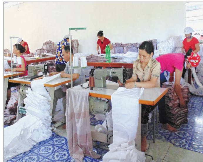
Nghề dệt khăn tại xã Thái Phương (Hưng Hà) phát triển ổn định.