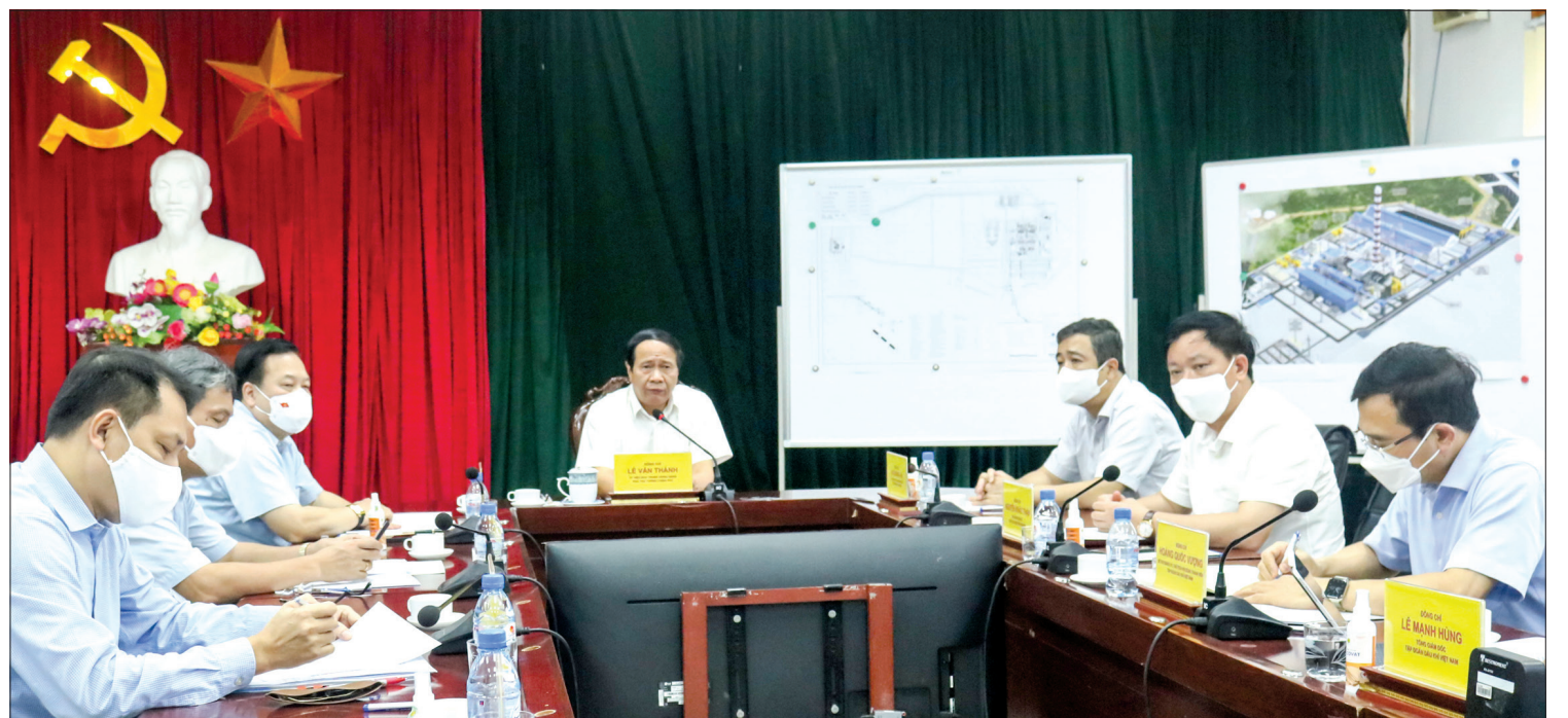
Đồng chí Lê Văn Thành, Ủy viên Ban Chấp hành Trung ương Đảng, Phó Thủ tướng Chính phủ chủ trì buổi làm việc.

Tại buổi làm việc, các đại biểu đã nghe đại diện Ban Quản lý dự án Nhà máy nhiệt điện Thái Bình 2, đơn vị tổng thầu, nhà thầu thi công báo cáo kết quả rà soát khối lượng đã hoàn thành, kế hoạch tiến độ thi công dự án, một số vướng mắc và đề xuất, kiến nghị với các bộ, ngành, Chính phủ hỗ trợ. Đại diện Bộ Công Thương, Ủy ban Quản lý vốn nhà nước tại doanh nghiệp góp ý, đề xuất một số giải pháp tháo gỡ khó khăn, đẩy nhanh tiến độ dự án.