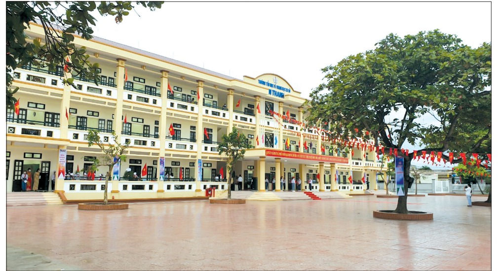
Trường Tiểu học và THCS An Thanh (Quỳnh Phụ).

Huyện Quỳnh Phụ hiện có 38 trường mầm non, 14 trường tiểu học, 24 trường THCS và THPT, 14 trường THPT với gần 49.000 học sinh. Năm học vừa qua, được sự quan tâm của Huyện ủy, HĐND, UBND huyện cùng cố gắng, nỗ lực của đội ngũ nhà giáo và các em học sinh, sự nghiệp giáo dục không ngừng phát triển.