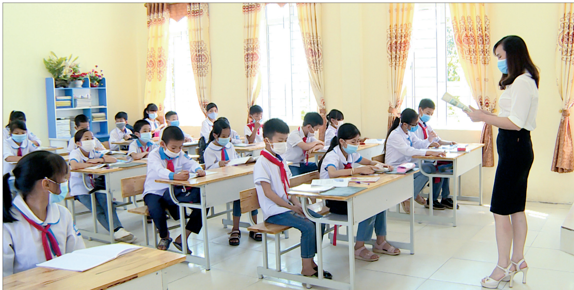
Cô và trò Trường Tiểu học và THCS Vũ Thị Thục (Hưng Hà) sẵn sàng bước vào năm học mới.