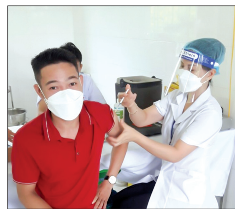
Người lao động được tiêm vắc-xin phòng Covid-19.