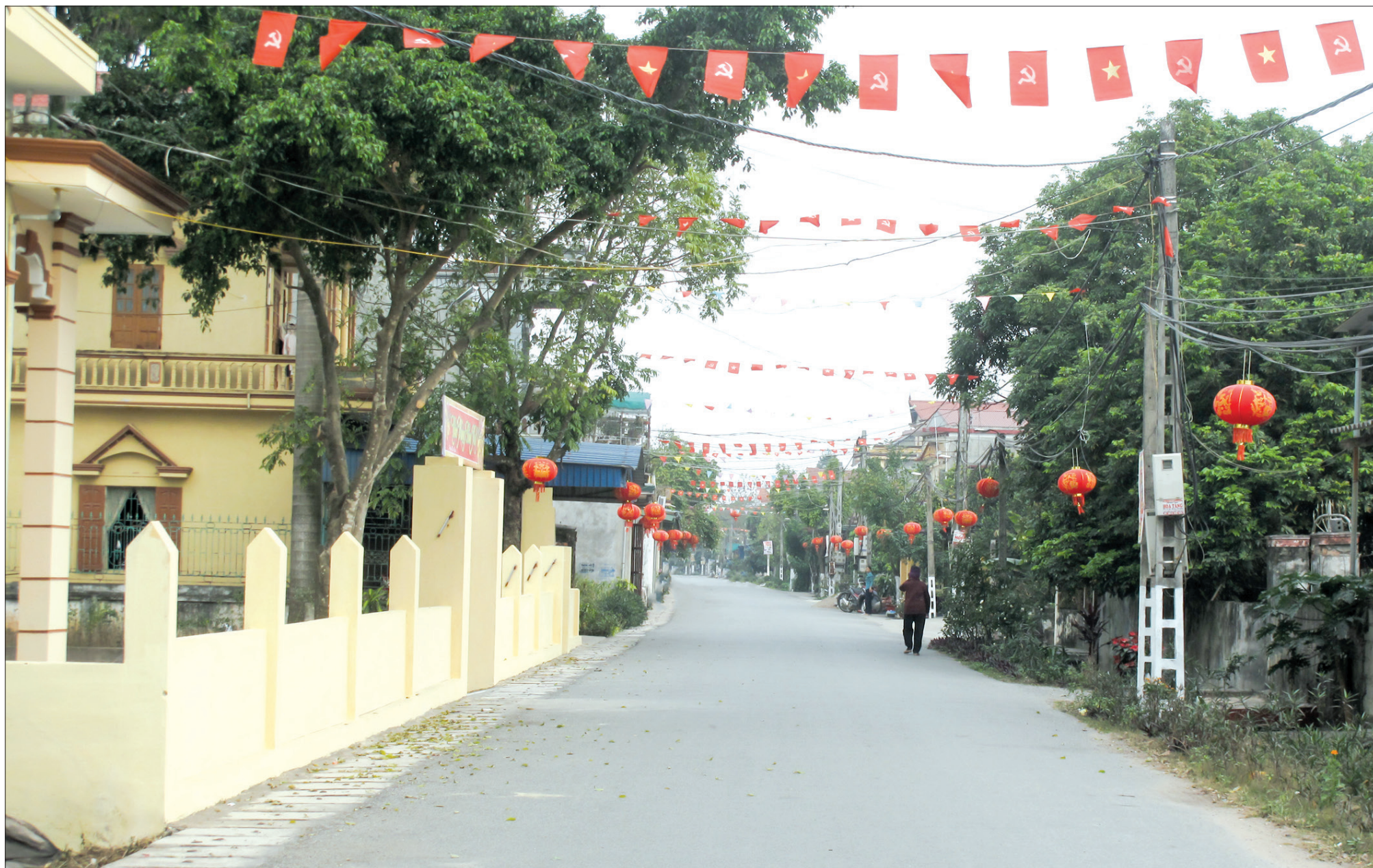
Diện mạo nông thôn mới xã Tiên Đức (Hưng Hà).

Qua KTGS, cấp ủy, UBKT các cấp đã chỉ rõ những ưu điểm để phát huy, kịp thời phát hiện, ngăn chặn, uốn nắn, chấn chỉnh, bổ khuyết, rút kinh nghiệm đối với các tổ chức đảng, đảng viên có khuyết điểm, sai phạm. Đối với các trường hợp vi phạm đến mức phải thi hành kỷ luật đều được cấp ủy các cấp xem xét, xử lý kịp thời, nghiêm minh theo đúng quy định của Điều lệ Đảng. 6 tháng đầu năm 2021, các tổ chức đảng có thẩm quyền đã thi hành kỷ luật đối với 2 tổ chức đảng bằng hình thức khiển trách, 239 đảng viên bằng các hình thức: khiển trách 214, cảnh cáo 19, cách chức 3, đình chỉ sinh hoạt 3. Qua đó góp phần cảnh báo, răn đe, phòng ngừa vi phạm trong tổ chức đảng, trong cán bộ, đảng viên; giữ vững nguyên tắc, kỷ luật, kỷ cương của Đảng; nâng cao năng lực lãnh đạo, sức chiến đấu của Đảng, góp phần thực hiện thắng lợi các nhiệm vụ chính trị của tỉnh.