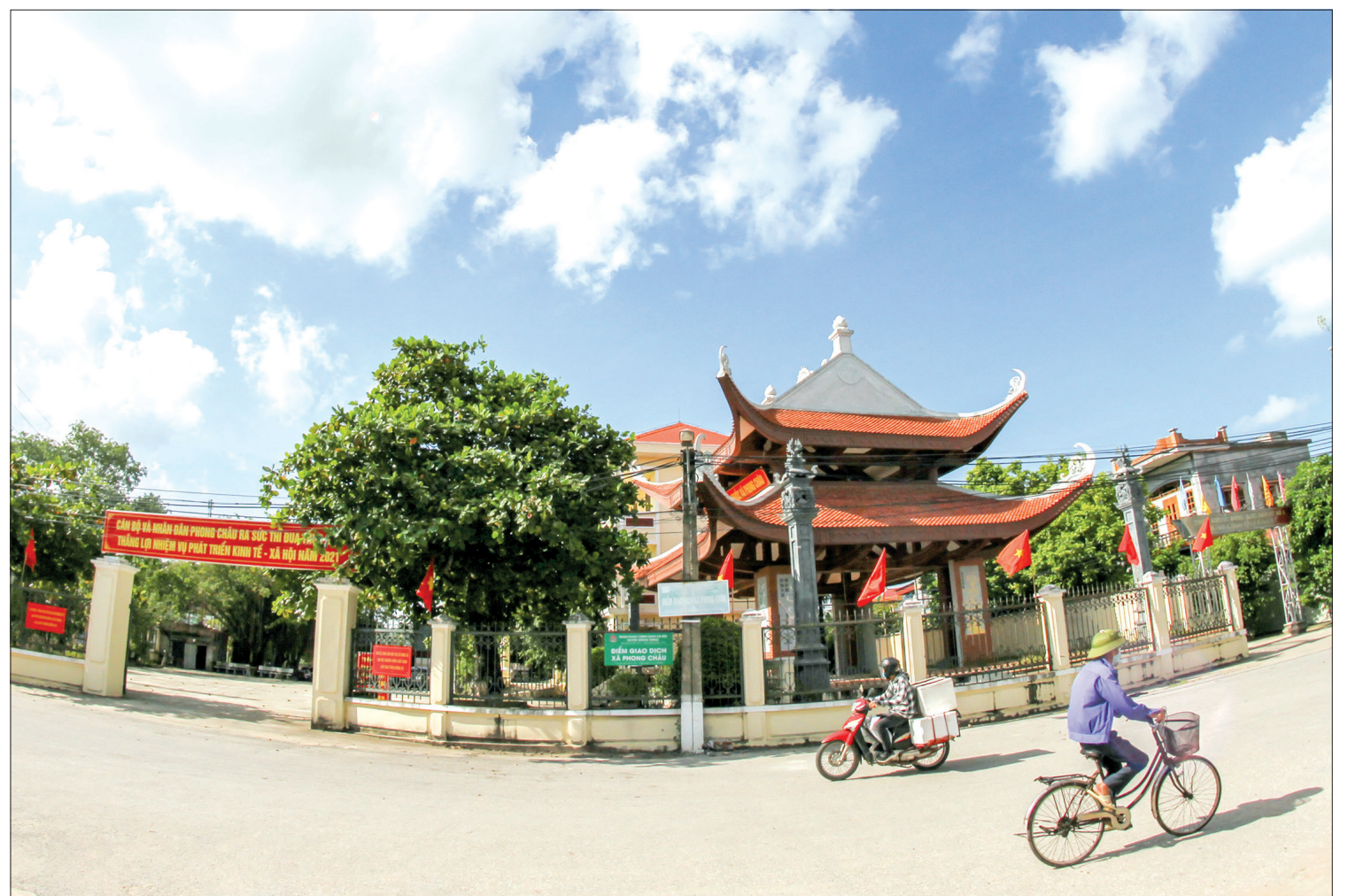
Chiếu chèo làng Khuốc, xã Phong Châu (Đông Hưng).