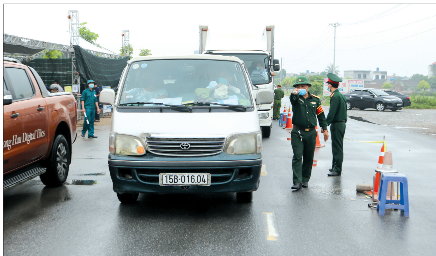
Lực lượng quân đội tham gia điều tiết giao thông tại chốt kiểm soát dịch Covid-19.

Thực hiện mệnh lệnh từ trái tim, mệnh lệnh bảo vệ những điều thiêng liêng nhất mà Tổ quốc và nhân dân tin tưởng giao phó, những bước chân của người lính vẫn âm thầm tiến lên phía trước bằng ý chí, tinh thần thép, chắc cánh tay cùng chung sức, đồng lòng đẩy lùi dịch Covid-19.