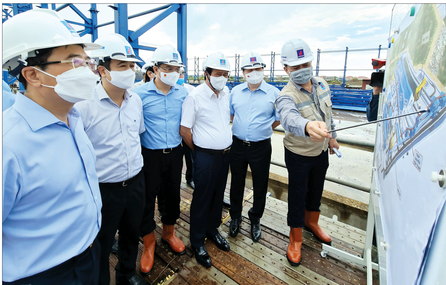
Phó Thủ tướng Lê Văn Thành cùng các đồng chí lãnh đạo bộ, ngành trung ương, lãnh đạo tỉnh kiểm tra tiến độ thi công hạng mục kho nguyên liệu tại dự án Nhà máy nhiệt điện Thái Bình 2.