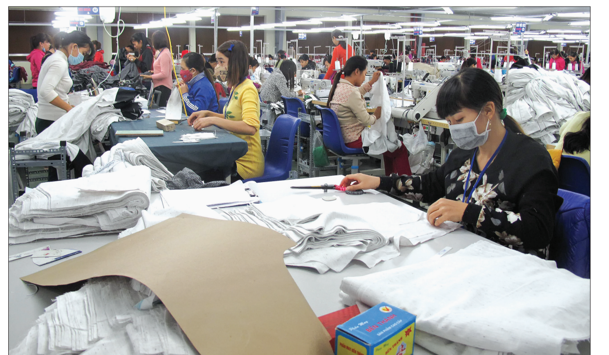
Nhà máy may xuất khẩu Đại Dương.