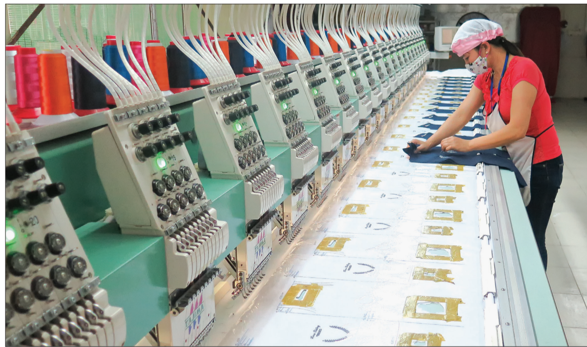
Dây chuyền sản xuất của Công ty TNHH Sơn Hà.