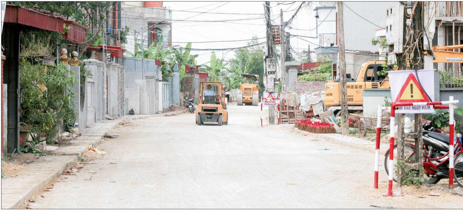
Thi công đường ĐH.96 đoạn qua địa bàn xã Dương Phúc (Thái Thụy).

Với việc triển khai đồng bộ, quyết liệt các giải pháp, công tác cải cách hành chính (CCHC) trên địa bàn huyện Thái Thụy đạt được nhiều kết quả nổi bật, góp phần nâng cao hiệu lực, hiệu quả hoạt động của bộ máy hành chính, phục vụ người dân, doanh nghiệp ngày càng tốt hơn.