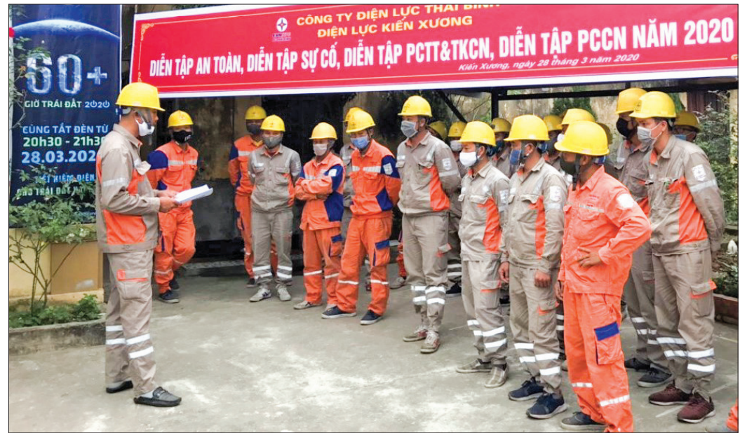
Điện lực Kiến Xương triển khai phương án diễn tập năm 2020.