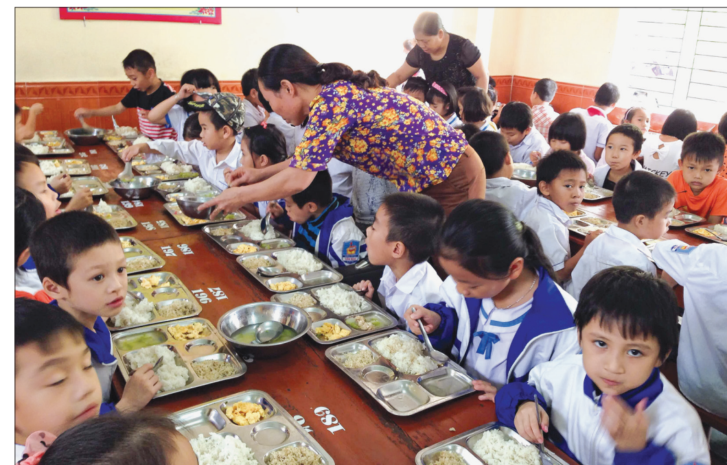
Học sinh Trường Tiểu học Tân Hòa (Vũ Thư) ăn bán trú tại trường.