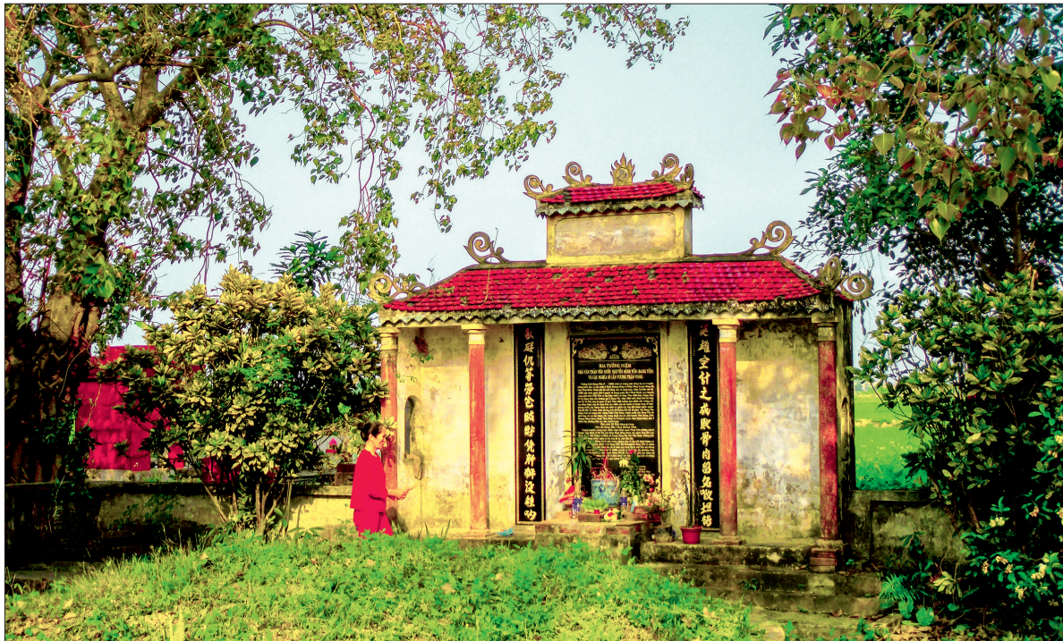
Khu tưởng niệm nghĩa binh Cần Vương Bang Tốn, Diên Hà tại làng Gạo, xã Hồng An, huyện Hưng Hà.

Cách nay vừa tròn 130 năm (1888 - 2018), cuộc đấỵ binh “áo vải, cờ đào” kháng Pháp của các sĩ phu yêu nước theo phong trào Cần Vương nổ ra ở Diên Hà, Đô Kỳ... (Hưng Hà nay), Đọ, Đông Quang... (Đông Hưng), cầu Nghìn (Quỳnh Phụ), phủ Bo (thành phố)... do Bang Tốn, Tạ Hiện, Đốc Nhưỡng, Đốc Đen... chỉ huy bị dập tắt nhưng đã gây cho thực dân Pháp tổn thất nặng nề khiến chúng “bat vía kinh hồn”. Chúng dồn lực lượng từ Hưng Yên, Nam Định, Hải Dương... phản công, vây đánh nghĩa quân ta và đàn áp đẫm máu hàng tiêu diệt tận gốc phong trào. Tuy thất bại nhưng cuộc đấỵ binh đã ghi dấu son chói lọi về tinh thần yêu nước, độc lập dân tộc của nhân dân Thái Bình trong những ngày đấỵ chống thực dân Pháp xâm lược cuối thế kỷ XIX.