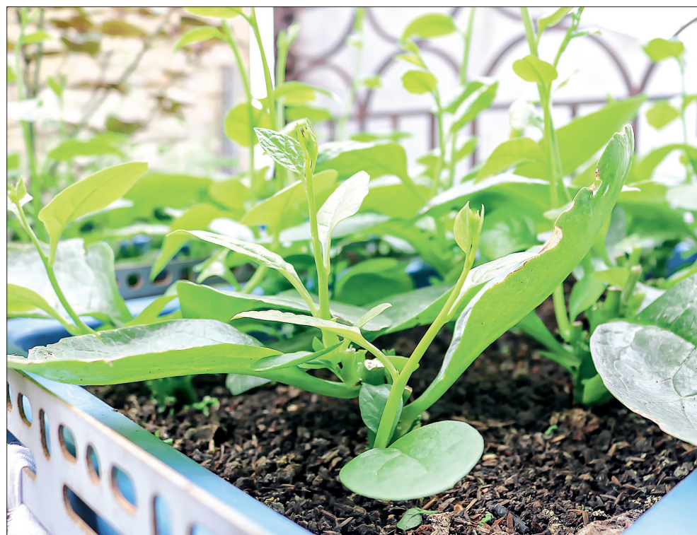
Ngoài rau mầm, bà Thủy còn trồng thêm nhiều loại rau ăn lá khác.

Từng là cán bộ Công ty Cổ phần Tổng công ty Giống cây trồng Thái Bình phụ trách thị trường, bà Thủy có điều kiện đi đến nhiều nơi, tiếp xúc với nhiều mô hình sản xuất nông nghiệp tiên tiến. Thế nên, bữa ăn gia đình bà lúc nào cũng đủ chất mà rất bảo đảm vệ sinh an toàn thực phẩm. Bà Thủy chia sẻ: Do tính chất công việc tiếp xúc nhiều với các sản phẩm nông nghiệp cùng nhu cầu lớn về rau sạch cho bữa cơm gia đình nên tôi đã tự tìm hiểu về cách trồng các loại rau trong giá, chậu. Sau đó tôi nhận thấy rau mầm có giá trị dinh dưỡng cao nên đã tìm hiểu thêm về cách trồng rau mầm từ đồng nghiệp, các mô hình sản xuất nông nghiệp và trên mạng internet. Để có được những cây rau mầm ngon, nhiều dinh dưỡng, bà Thủy đã mày mò tìm hiểu từng hạt giống, giá thể khác nhau; nghiên cứu xem hạt giống nào sản xuất rau mầm tốt, giá thể cũng vậy. Nhờ thế, chỉ với diện tích hơn 10m 2 trên ban công tầng 4 bà trồng được gần 20 chậu rau với các loại rau mầm khác nhau.