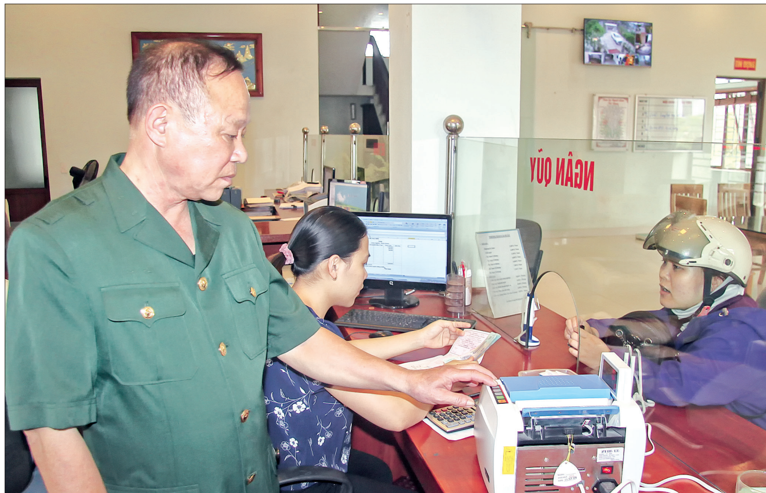
Quý Tín dụng nhân dân Bình Minh (Kiến Xương) giúp nhiều người tiếp cận nguồn vốn để phát triển kinh tế.

Trong chiến đấu, những người lính Cụ Hồ dũng cảm, kiên cường bao nhiêu thì khi trở về đời thường trên mặt trận mới các cựu chiến binh lại tiên phong, gương mẫu, mẫn cán bấy nhiêu.