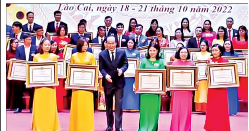
Trao giải cho các thí sinh.

Hội thi giảng viên lý luận chính trị giỏi khu vực I là dịp để các giảng viên giao lưu, học hỏi, trao đổi kinh nghiệm, hiểu biết về chuyên môn nghiệp vụ; trau dồi bản lĩnh và lòng tự hào của nhà giáo lý luận chính trị trên các sân chơi lớn, để thêm yêu, thêm gắn bó với nghề, với cơ sở.