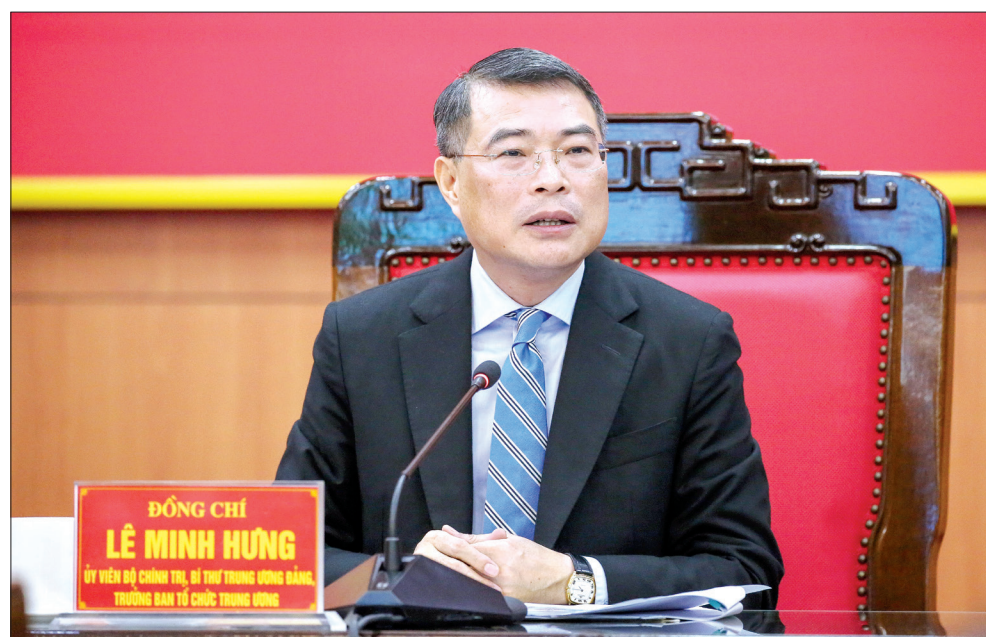
Đồng chí Lê Minh Hưng, Ủy viên Bộ Chính trị, Bí thư Trung ương Đảng, Trưởng ban Tổ chức Trung ương phát biểu chỉ đạo hội nghị.