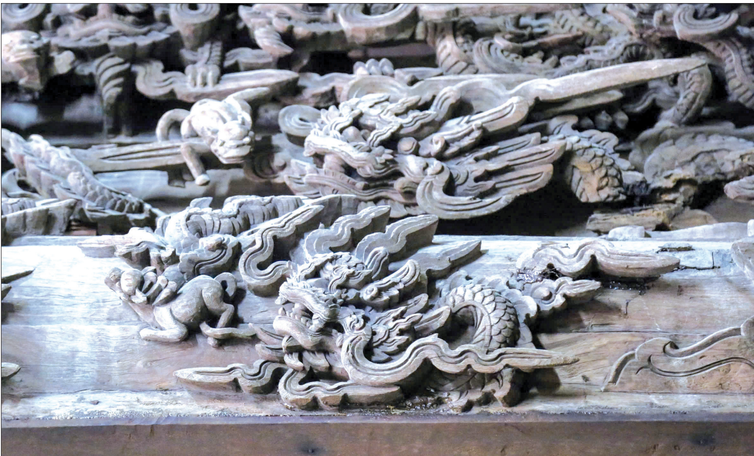
Những nét chạm trổ, điêu khắc tinh xảo trong đình An Cổ.