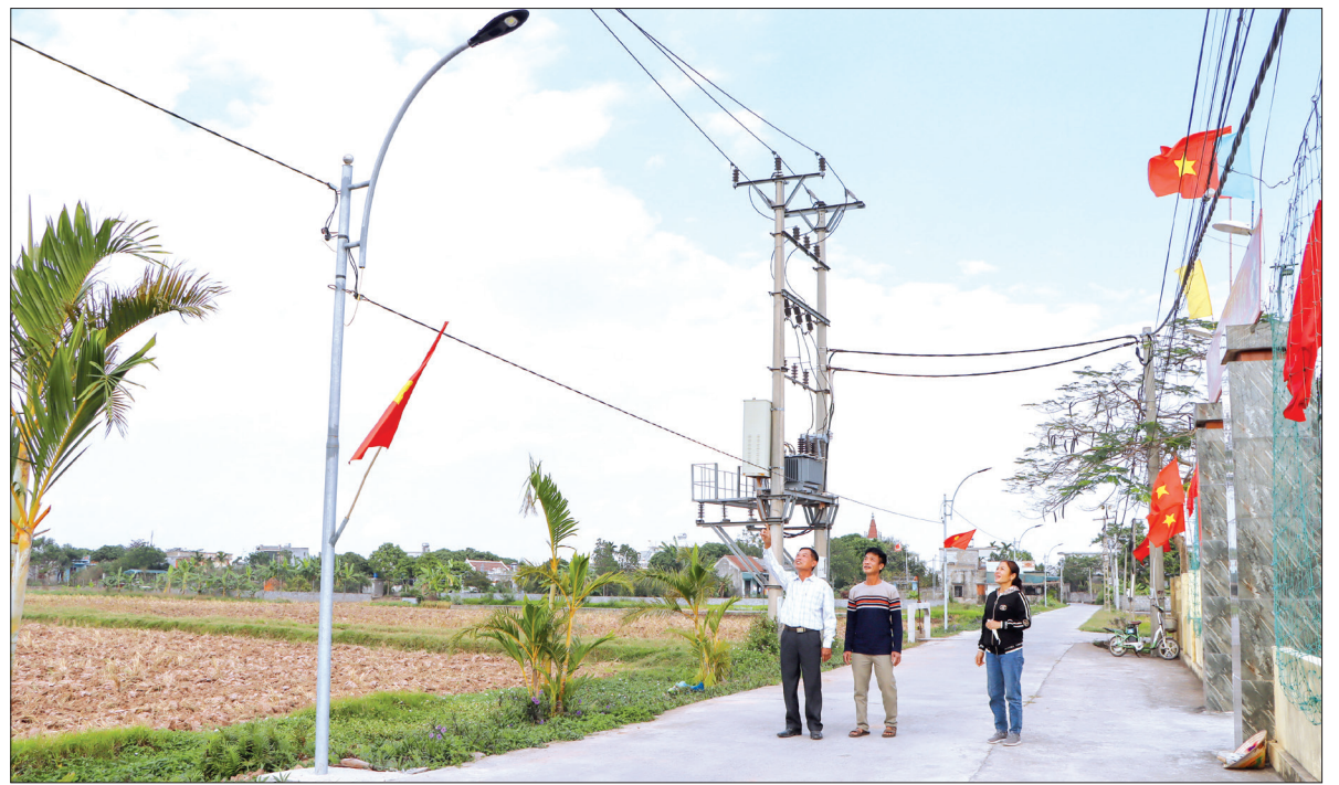
Công trình thấp sáng đường quê tại thôn Đê Thái mới hoàn thành và đưa vào sử dụng.

Đảng bộ xã Hòa Bình được Huyện ủy Kiến Xương lựa chọn tổ chức đại hội điểm cấp xã nhiệm kỳ 2025 - 2030 để rút kinh nghiệm trong toàn huyện. Nhận thức đây vừa là vinh dự song cũng là trách nhiệm nên địa phương đã tích cực, chủ động trong công tác chuẩn bị tổ chức Đại hội bảo đảm trang trọng, ý nghĩa, thiết thực.