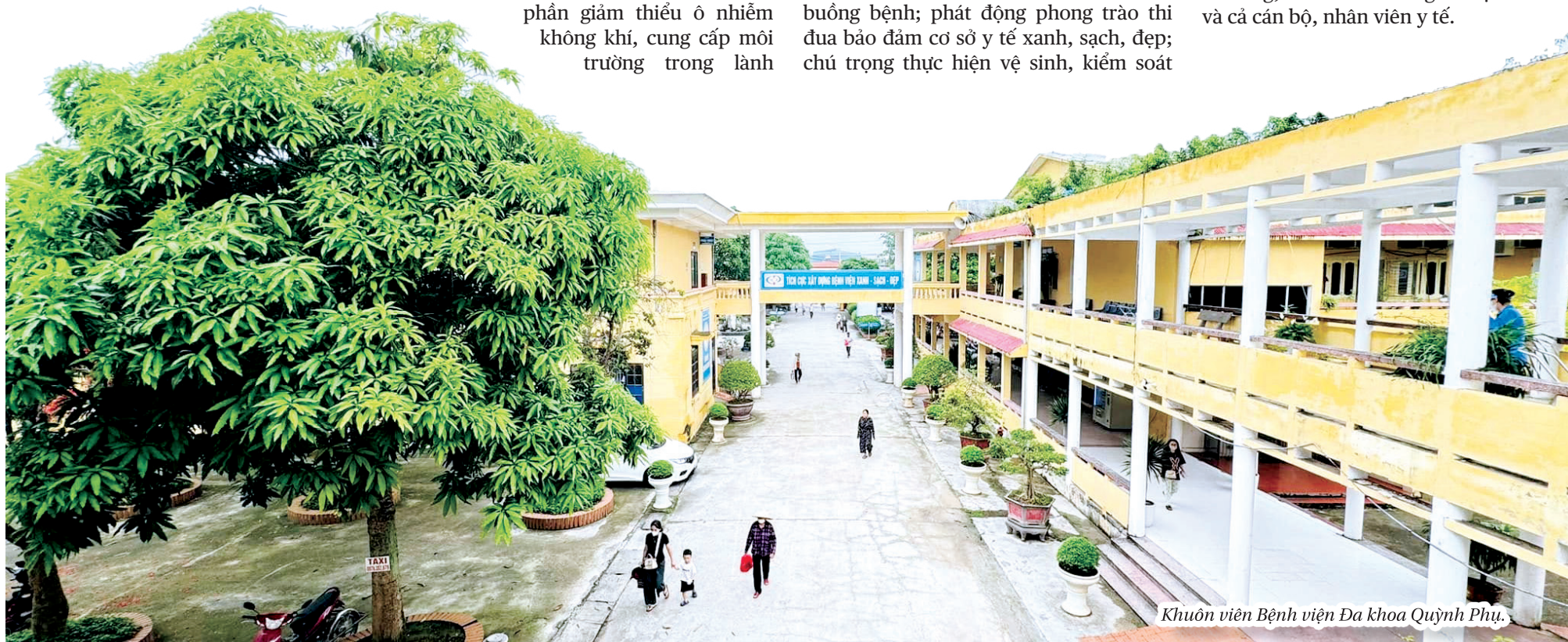
Khuôn viên Bệnh viện Đa khoa Quỳnh Phụ.

Sau 3 năm thực hiện Quyết định số 5959/QĐ-BYT, ngày 31/12/2021 của Bộ Y tế về việc ban hành bộ tiêu chí cơ sở y tế xanh, sạch, đẹp, các đơn vị y tế trong tỉnh đã triển khai nhiều hoạt động, cải tạo khuôn viên bệnh viện, tu sửa, nâng cấp cơ sở vật chất các khoa, phòng, buồng bệnh. Ngoài cây xanh tỏa bóng mát, nhiều cây xanh tiểu cảnh còn được trồng và đặt ở hành lang, cửa sổ phòng bệnh, khu vực đón tiếp, bàn khám... tạo cảnh quan mới. Phong trào thi đua xây dựng bệnh viện xanh, sạch đã lan tỏa tới các khoa, phòng, thay đổi nhận thức, trách nhiệm của nhiều cán bộ, nhân viên y tế để cùng hành động góp phần bảo vệ môi trường, đổi mới không gian làm việc, nâng cao chất lượng dịch vụ y tế. Nhờ đó, đến nay diện mạo của nhiều đơn vị y tế từ tuyến tỉnh đến cơ sở đã có sự đổi mới với những thay đổi tích cực, mang đến sự hài lòng, thoải mái cho người bệnh và cả cán bộ, nhân viên y tế.