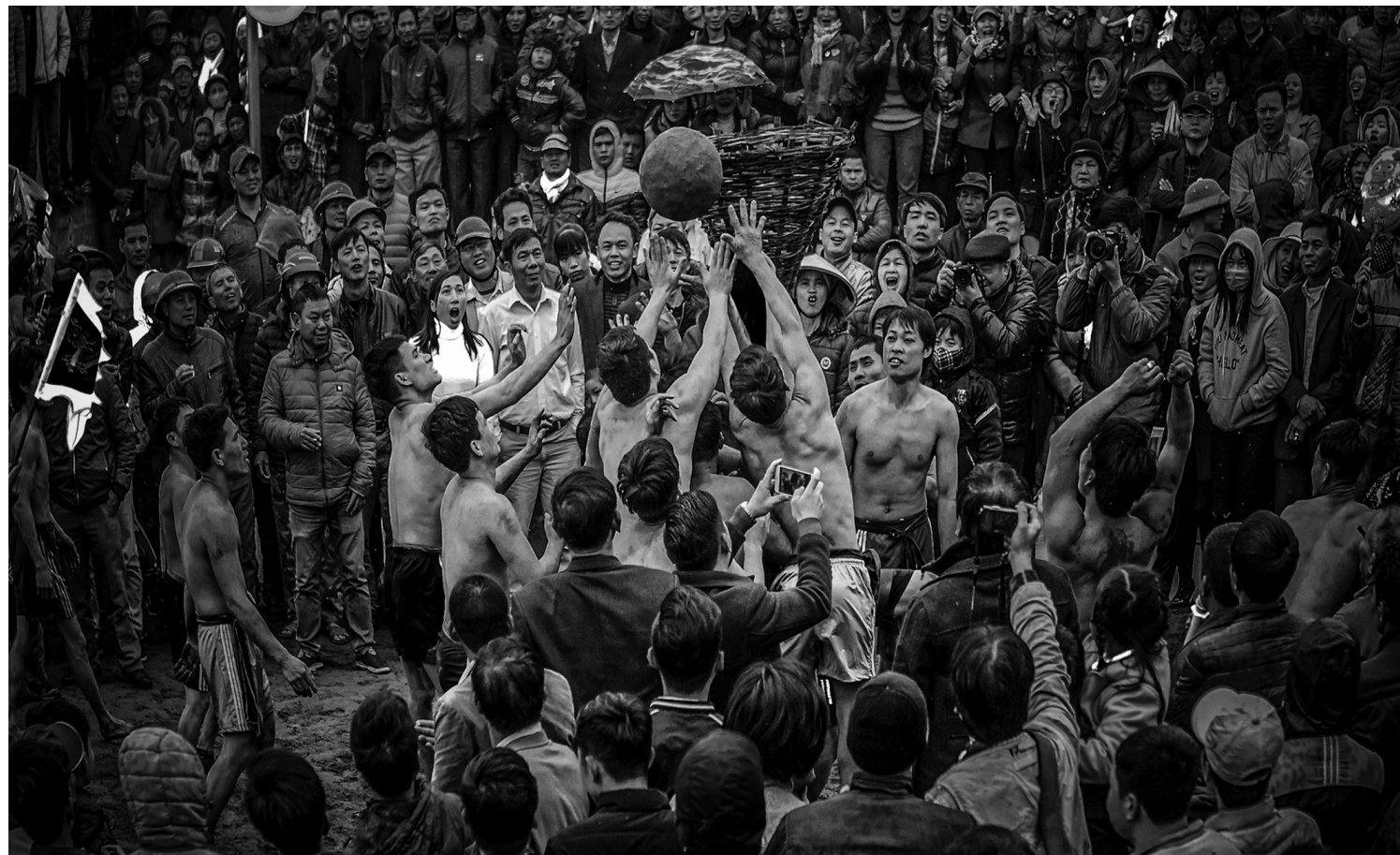
Lễ hội "Vật cầu" trong hội làng Bích Du (thường gọi là Hét), xã Thái Thượng (Thái Thụy) tưởng nhớ công lao rèn quân, luyện tướng của tướng quân Phạm Ngũ Lão thời nhà Trần, thế kỷ XIII.

Theo tài liệu khảo cứu của Bảo tàng tỉnh, địa bàn huyện Thái Thụy có 1 bia đá được khởi tạo năm Xương Phù thứ 6 (1382) và 1 tấm mộc bài khắc năm Thiệu Long thứ 2 (1269) thời nhà Trần thế kỷ XIII - XIV, khẳng định: Thời nhà Trần, huyện Thái Thụy ngày nay thuộc phủ Long Hưng. Bia ký có ghi: "Thiên Trường - Long Hưng phủ, An phủ sứ ty...", hiểu nghĩa là Long Hưng (Thái Bình nay) và Thiên Trường (Nam Định nay) đều là hai phủ ngang nhau của nhà Trần.