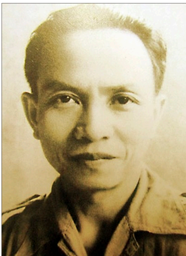
Tháng 2/1943, Đề cương văn hóa Việt Nam do Tổng Bí thư Trường Chinh soạn thảo được thông qua tại Hội nghị Thường vụ Trung ương Đảng ở Vông La (Đông Anh, Phúc Yên, nay là Hà Nội).

Mỗi vấn đề bao gồm những nội dung cơ bản được trình bày ngắn gọn, súc tích, gắn quyện với nhau để chỉ ra ở Việt Nam tất yếu phải tiến hành cuộc cách mạng tư tưởng văn hóa. Ngay trong phần đầu tiên, Đề cương khẳng định: “Có lãnh đạo được phong trào văn hóa, Đảng mới ảnh hưởng được dư luận, việc tuyên truyền của Đảng mới có hiệu quả”. Trong phần “Vấn đề cách mạng văn hóa Việt Nam”, Đề cương định hướng: “Văn hóa mới Việt Nam là một thứ văn hóa có tính chất dân tộc về hình thức và tân dân chủ về nội dung. Chính vì thế