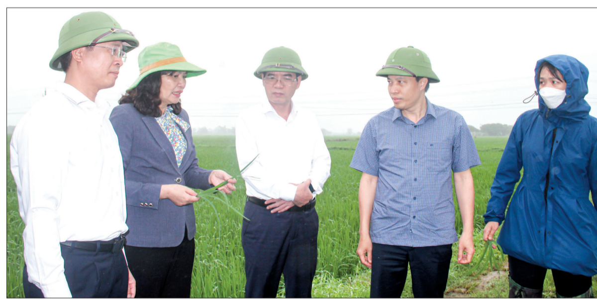
Đồng chí Lại Văn Hoàn, Tỉnh ủy viên, Phó Chủ tịch UBND tỉnh kiểm tra tình hình sâu bệnh hại trên cánh đồng xã Đông Hải (Quỳnh Phụ).

* Chiều ngày 11/4, đồng chí Lại Văn Hoàn, Tỉnh ủy viên, Phó Chủ tịch UBND tỉnh cùng lãnh đạo Sở Nông nghiệp và Phát triển nông thôn đi kiểm tra sản xuất nông nghiệp trên địa bàn huyện Quỳnh Phụ. Theo báo cáo của Trạm Trồng trọt và Bảo vệ thực vật huyện Quỳnh Phụ, những ngày