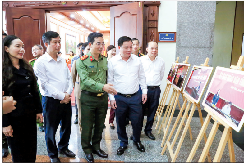
Các đồng chí lãnh đạo tỉnh tham quan triển lãm ảnh chủ đề: Công an Thái Bình quyết tâm cao, nỗ lực lớn, đấu án nổi bật trong thực hiện Đề án 06 của Chính phủ.

Chiều ngày 11/4, UBND tỉnh tổ chức phát động cuộc thi trắc nghiệm trên internet tìm hiểu Đề án "Phát triển ứng dụng dữ liệu về dân cư, định danh và xác thực điện tử phục vụ chuyển đổi số quốc gia giai đoạn 2022 - 2025, tầm nhìn đến năm 2030"