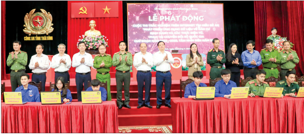
Các đồng chí lãnh đạo tỉnh chứng kiến, động viên đoàn viên thanh niên các cơ quan, đơn vị tham gia cuộc thi.