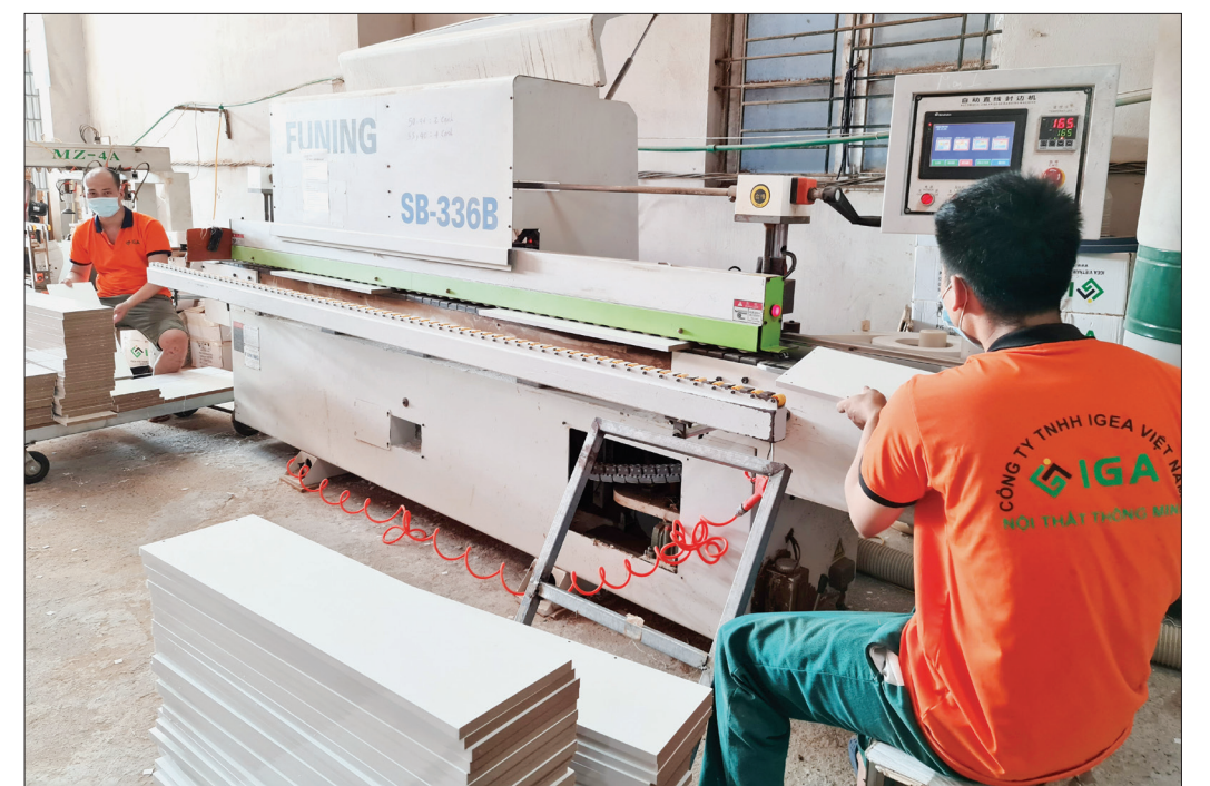
Tất cả máy móc đều được lập trình, điều khiển tự động bằng công nghệ số đã cải thiện điều kiện làm việc của công nhân.