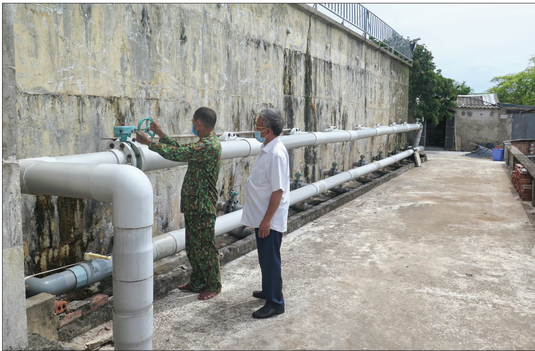
Từ nguồn vốn của quỹ tín dụng, nhà máy nước Quang Trung được xây dựng kiên cố, bảo đảm chất lượng.

Không chỉ hoạt động với mục tiêu tương trợ, tạo điều kiện thuận lợi cho thành viên, hệ thống quỹ tín dụng nhân dân (TDND) trên địa bàn huyện Kiến Xương luôn nâng cao chất lượng, hiệu quả, đáp ứng kịp thời nhu cầu về vốn phục vụ phát