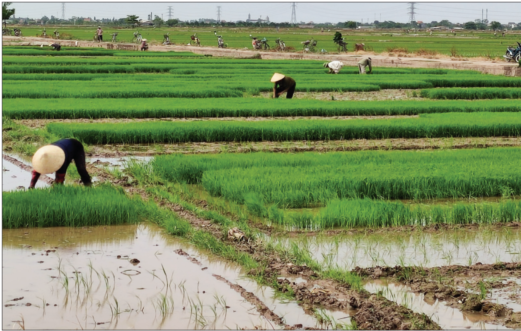
Nông dân xã Dân Chủ (Hưng Hà) sản xuất vụ mùa.

Hiện nay đang ở giai đoạn nắng nóng gay gắt, song dù thời tiết khắc nghiệt nông dân các địa phương trong huyện Hưng Hà vẫn đội nắng gieo cấy lúa mùa bảo đảm trong khung thời vụ và chủ động chăm sóc lúa mới cấy.