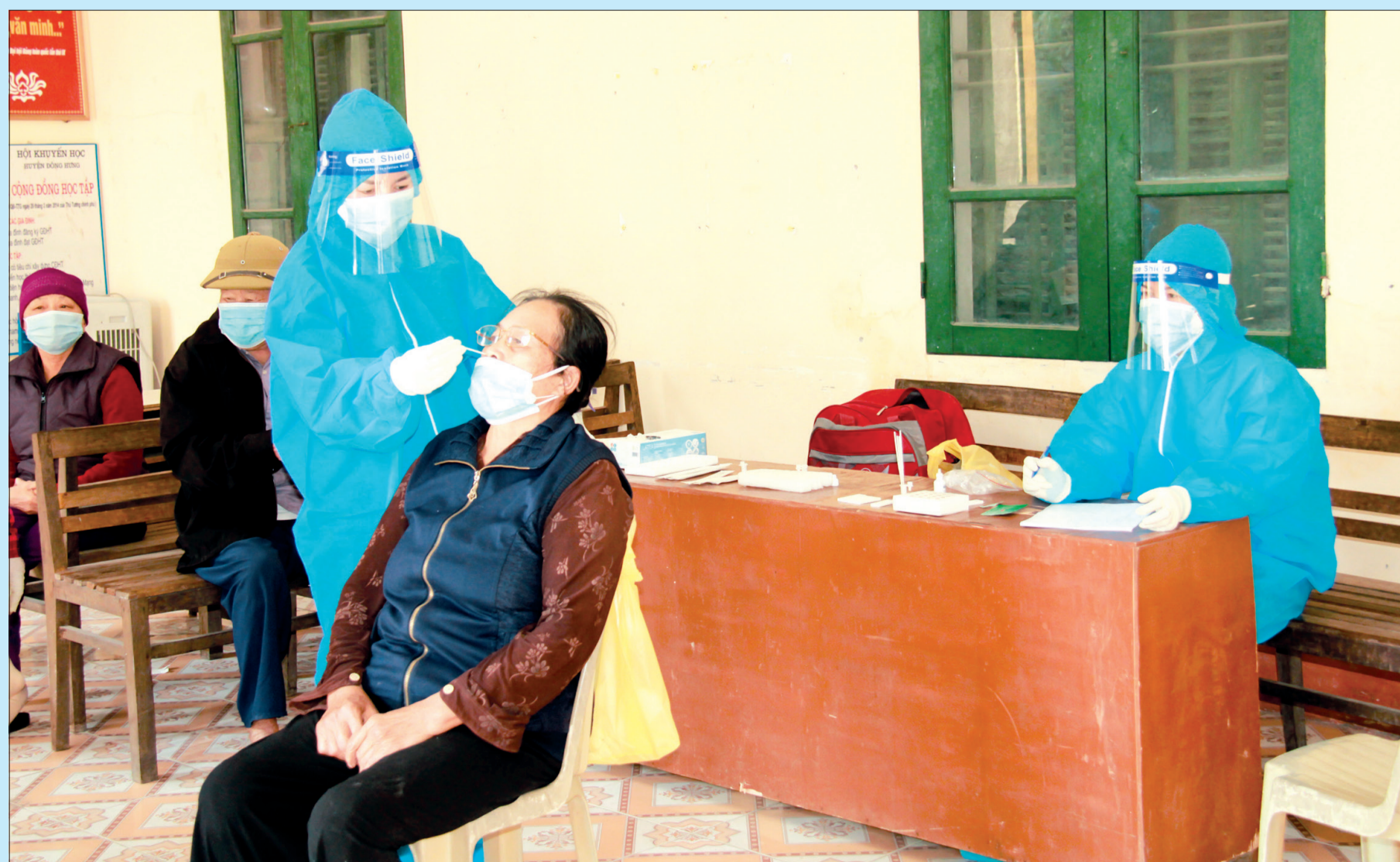
Cán bộ y tế lấy mẫu xét nghiệm SARS-CoV-2 cho người dân thôn Phong Lôi Đông, xã Đông Hợp (Đông Hưng).