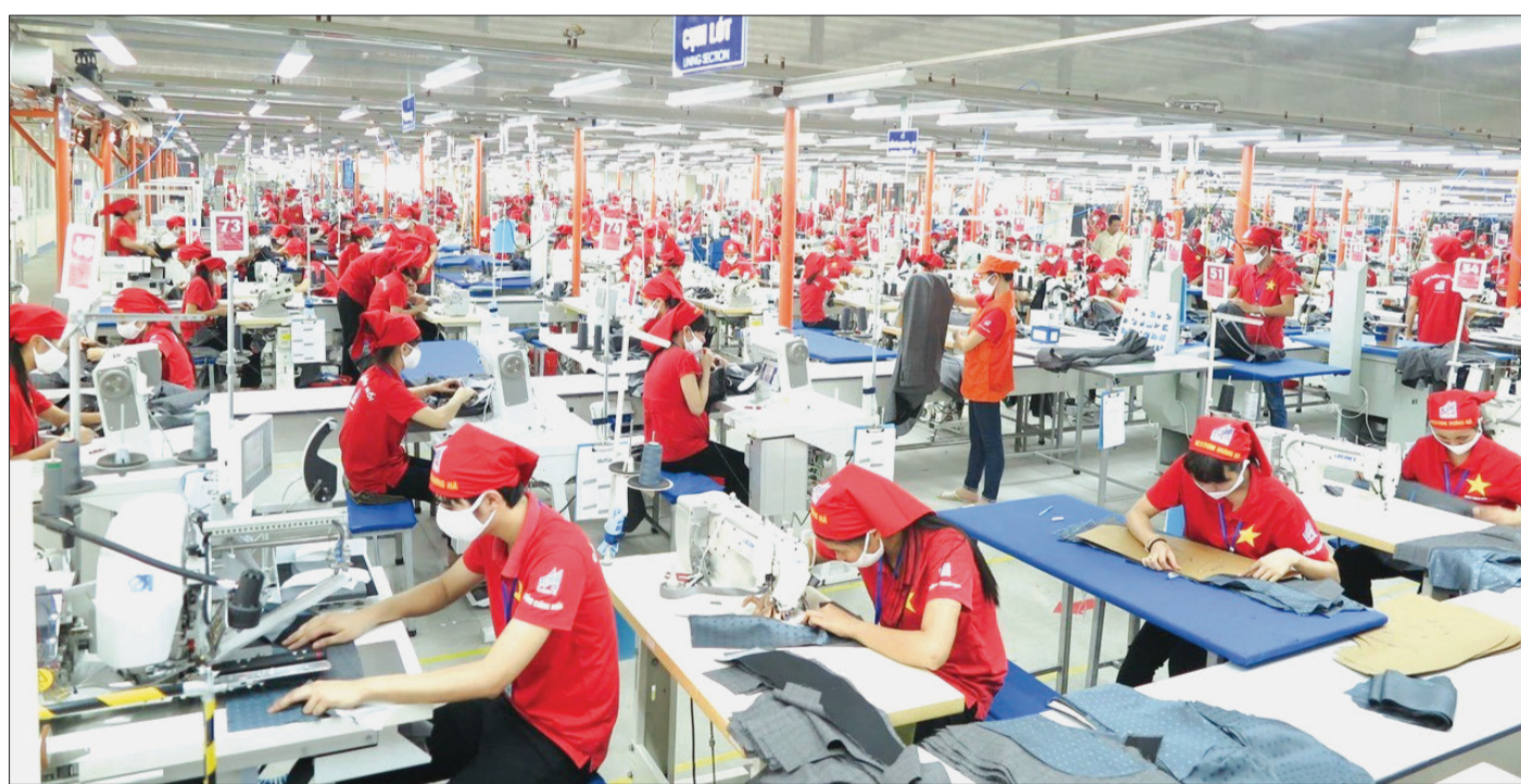
Hơn 600 cán bộ, công nhân Xí nghiệp Veston Hưng Hà thi đua sản xuất lập thành tích chào mừng 10 năm thành lập Xí nghiệp.

Những ngày này, Xí nghiệp Veston Hưng Hà tập trung đẩy mạnh sản xuất, kinh doanh nhằm tăng tốc ngay từ đầu năm mới với quyết tâm bù đắp lại phần sụt giảm doanh thu do ảnh hưởng của dịch Covid-19 trong năm 2021.