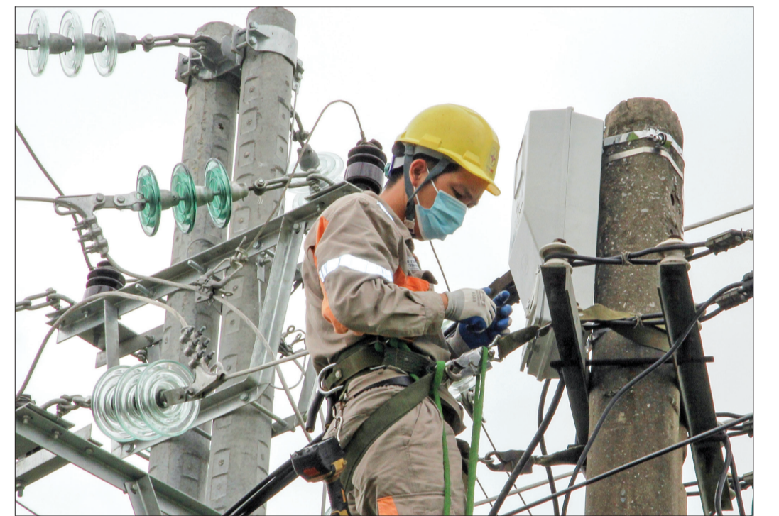
Công nhân Điện lực Kiến Xương thực hiện tốt việc bảo hộ lao động trong khi làm việc.