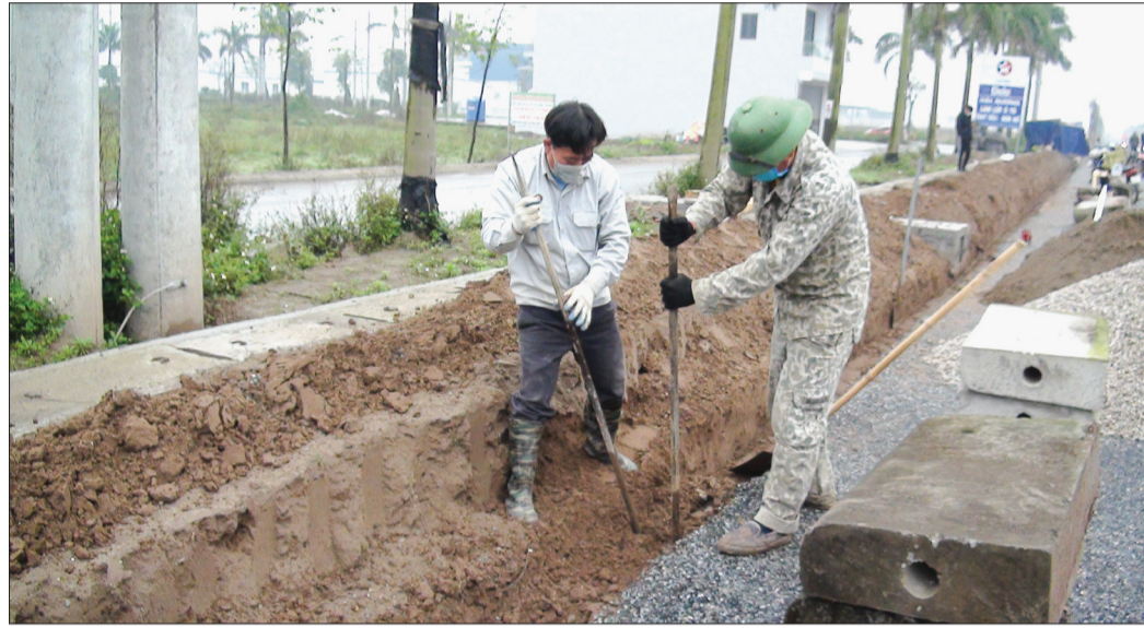
Dự án cải tạo, nâng cấp đường 221A đang bước vào giai đoạn thi công nước rút trên toàn tuyến.

Ngay sau khi kết thúc kỳ nghỉ tết Nguyên đán, trên các công trường, chủ đầu tư và đơn vị thi công đã khẩn trương ra quân, bắt tay ngay vào công việc, tạo khí thế thi đua lao động sản xuất sôi nổi ngay từ những ngày đầu năm mới với quyết tâm hoàn thành các mục tiêu, nhiệm vụ đặt ra theo đúng kế hoạch.