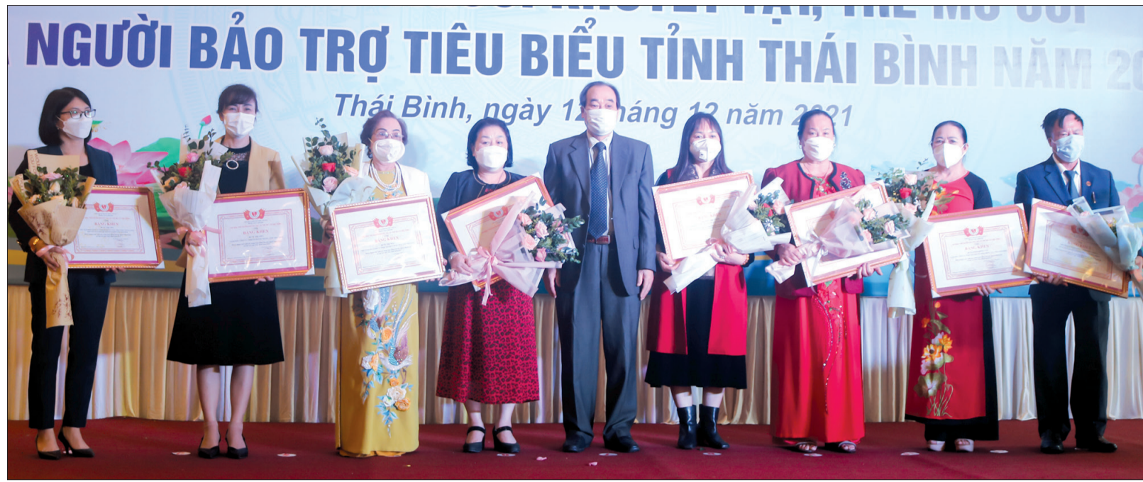
Lãnh đạo Hội Bảo trợ người khuyết tật và trẻ mồ côi Việt Nam trao bằng khen cho người bảo trợ có thành tích xuất sắc năm 2021.