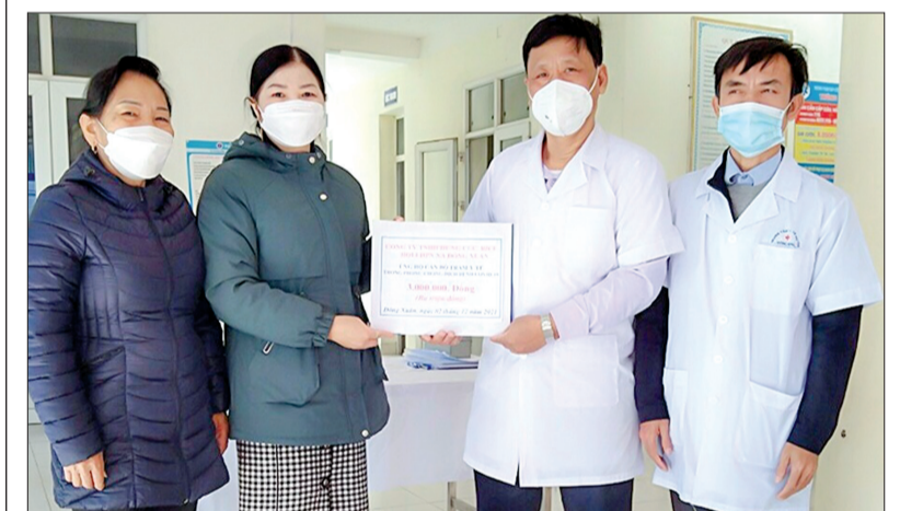
Hội Liên hiệp Phụ nữ xã Đông Xuân trao hỗ trợ cho Trạm Y tế xã.

Từ ngày 26/11 đến nay, Hội Liên hiệp Phụ nữ xã Đông Xuân (Đông Hưng) đã vận động cán bộ, hội viên và gia đình hội viên ủng hộ hơn 17 triệu đồng cho công tác phòng, chống dịch của xã.