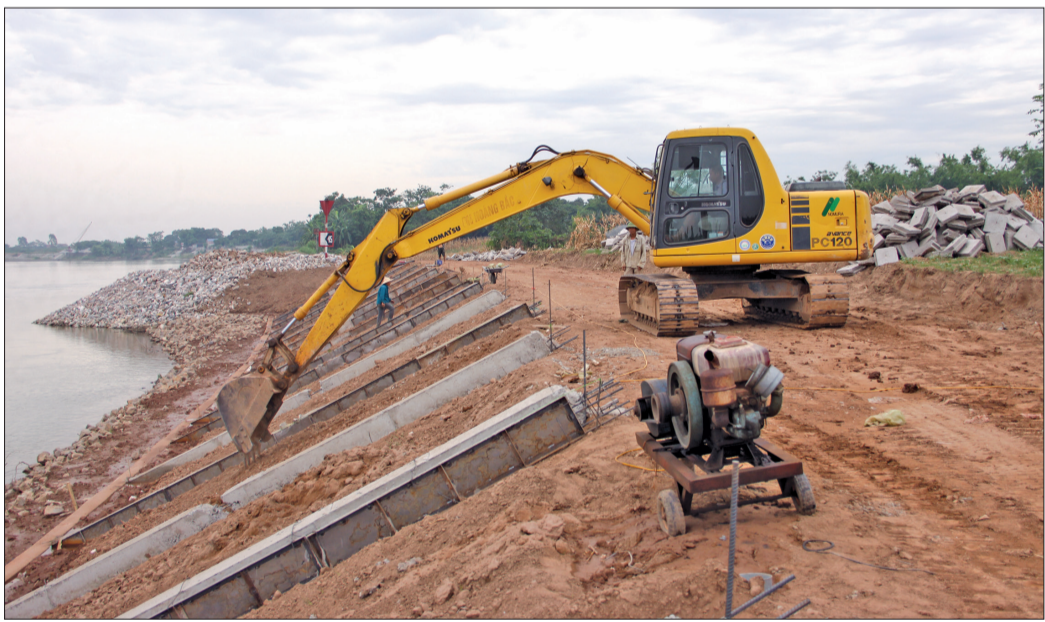
Thi công kè Đào Thành để hữu Lộ từ k3+700 đến k4+100.

Để chủ động ứng phó với mùa mưa bão năm 2020 và những năm tiếp theo, thời gian qua, Ban Quản lý dự án đầu tư xây dựng huyện Hưng Hà đã tập trung dồn sức cho công tác phòng, chống lụt, bão. Đến nay, một số công trình đã cơ bản hoàn thành, kịp thời đưa vào sử dụng trong mùa mưa bão năm 2020.