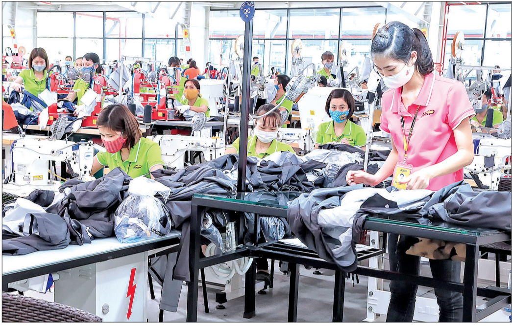
Sản xuất tại nhà máy MXP7 (Công ty Cổ phần Sản xuất hàng thể thao MXP).