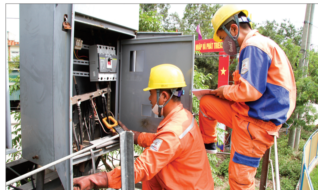
Nhân viên Điện lực Quỳnh Phụ kiểm tra trạm biến áp, bảo đảm cấp điện an toàn, ổn định mùa nắng nóng.