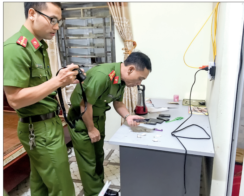
Phòng Kỹ thuật hình sự, Công an tỉnh phối hợp điều tra vụ án ma túy.

Với vai trò là cơ quan thường trực của Ban Chỉ đạo 138 tỉnh, 2 năm qua, Công an tỉnh đã mở 6 đợt cao điểm đấu tranh PCTP, các hành vi vi phạm pháp luật. Lực lượng công an đã xác lập 36 chuyên án, khám phá thành công 25 chuyên án, triệt xóa 49 ổ nhóm, bắt 143 đối tượng hình sự, điều tra 1.512 vụ vi phạm về trật tự xã hội (đạt 84%, riêng trọng án đạt 100%). Tập trung đẩy mạnh đấu tranh với các tệ nạn xã hội, đã khởi tố 13 vụ, 16 bị can phạm tội về mại dâm; khởi tố 108 vụ, 296 bị can; xử phạt hành chính 155 vụ, 647 đối tượng liên quan đến cờ bạc, số đề. Vận động bắt 128 đối tượng truy nã (29 đối tượng nguy hiểm, 9 đối tượng đặc biệt nguy hiểm). Đã khám phá nhanh nhiều chuyên án, vụ án nghiêm trọng, được cán bộ, nhân dân đánh giá cao như: khám phá thành công chuyên án TH2107, bắt 2 đối tượng gây ra 23 vụ trộm cắp