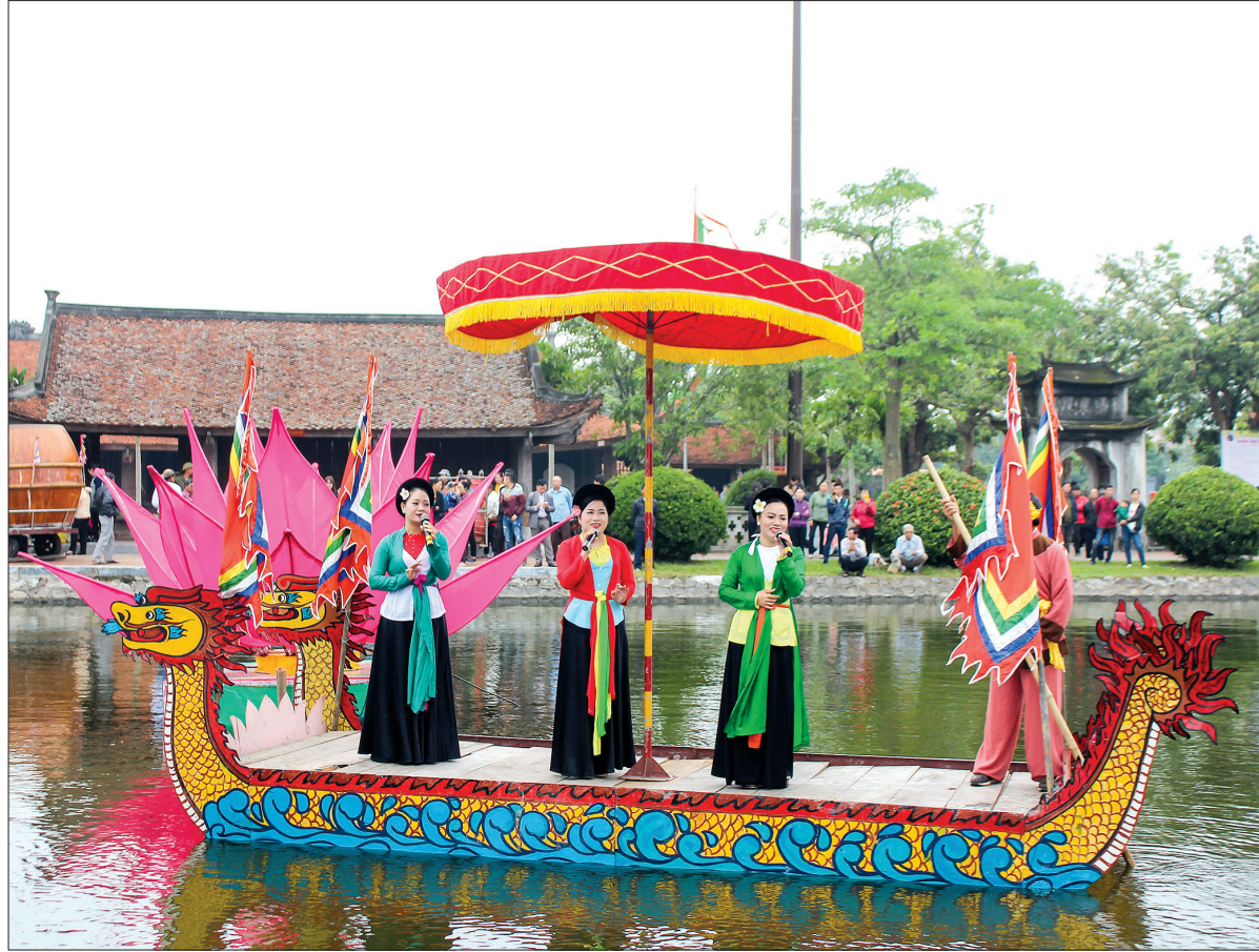
Hát giao duyên - nét đẹp văn hóa trong lễ hội chùa Keo (xã Duy Nhất, huyện Vũ Thư).

Cốt lõi của phong trào toàn dân xây dựng đời sống văn hóa là xây dựng gia đình, thôn, tổ dân phố, khu phố, cơ quan, đơn vị, doanh nghiệp văn hóa. Sau 18 năm thực hiện, phong trào đã góp phần nâng cao ý thức, trách nhiệm của mỗi cá nhân, gia đình, đơn vị. Nhờ đó, tính từ năm 2001 đến nay, toàn tỉnh có trên 100.000 gương người tốt, việc tốt được các cấp, ngành, đơn vị, địa phương biểu dương, khen thưởng. Tỷ lệ gia đình, thôn, tổ dân phố, khu phố, cơ quan, đơn vị, doanh nghiệp đạt chuẩn văn hóa được nâng lên. Theo thống kê, đến hết năm 2017, toàn tỉnh có trên 87,5% gia đình đạt chuẩn văn hóa; 63,9% thôn, tổ dân phố, khu phố văn hóa, 73% cơ quan, đơn vị, doanh nghiệp văn hóa. Nhiều thôn, tổ dân phố, khu phố, cơ quan, đơn vị giữ vững danh hiệu văn hóa nhiều năm liền như: khu phố Long Hưng (thị trấn Thanh Nê, Kiến Xương); thôn An Dân (xã Thụy Dân, Thái Thụy); thôn Minh Thành (xã Hồng Minh, Hưng Hà); thôn Sứ Hăng (xã Minh Lăng, Vũ Thư); Đồn Biên phòng Trà Lý; Trường Mầm non Vũ Sơn (Kiến Xương)... Số xã đạt chuẩn văn hóa nông thôn mới, phường, thị trấn đạt chuẩn văn minh đô thị cũng được nâng lên. Toàn tỉnh có 51,6% xã đạt chuẩn văn hóa nông thôn mới, 67,5% phường, thị trấn đạt chuẩn văn minh đô thị.