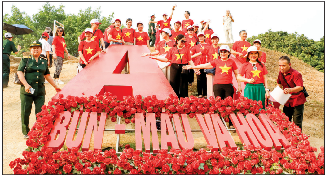
Công trình thanh niên Cùm chữ "A1" trên di tích Đối A1 là một trong những địa điểm được nhiều du khách chụp ảnh kỷ niệm.