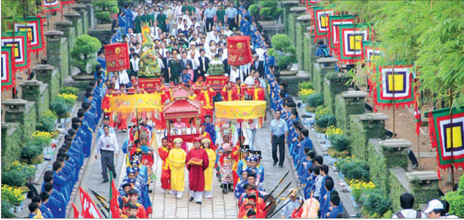
Ngày Quốc Tổ Việt Nam toàn cầu 2022 - Lễ giỗ Tổ và vinh danh con cháu Vua Hùng toàn cầu sẽ được tổ chức theo hình thức trực tiếp và trực tuyến.

(chinhpvu.vn) - Ngày Quốc Tổ Việt Nam toàn cầu 2022 - Lễ giỗ Tổ và vinh danh con cháu Vua Hùng toàn cầu sẽ được tổ chức theo hình thức trực tiếp và trực tuyến vào ngày 10/3 âm lịch (tức ngày 10/4 dương lịch).