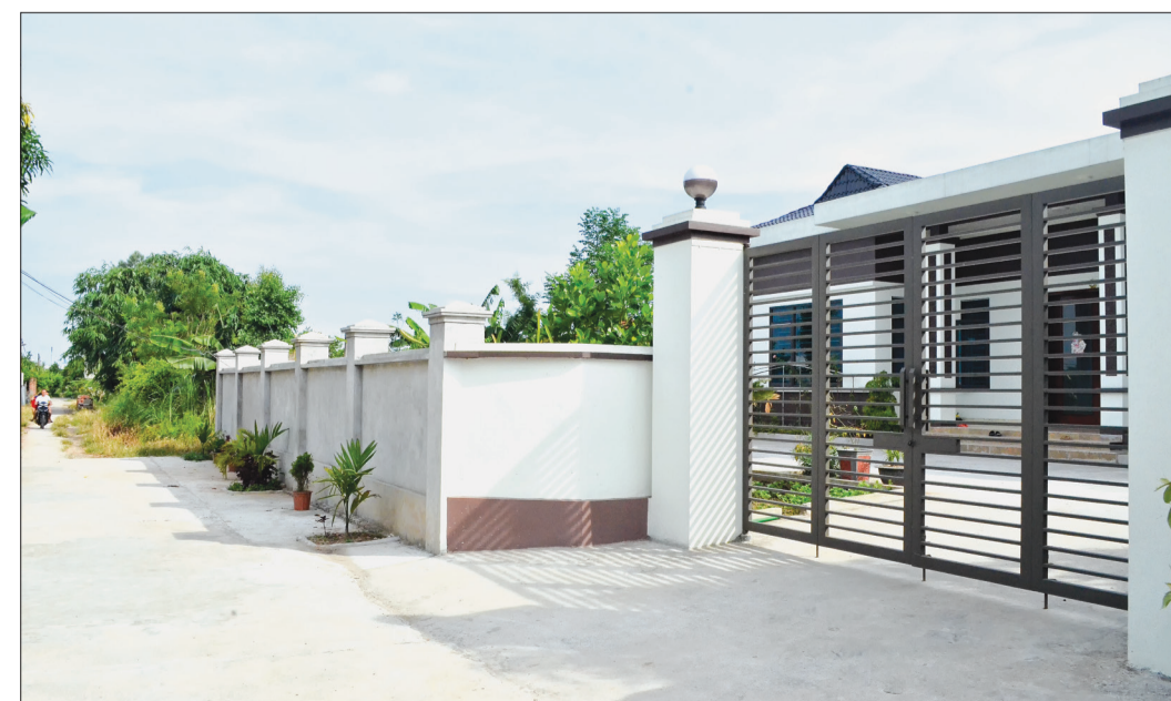
Những ngôi nhà kiên cố xây dựng trái phép trên đất chuyển đổi tại xã Vũ Chính (thành phố Thái Bình).