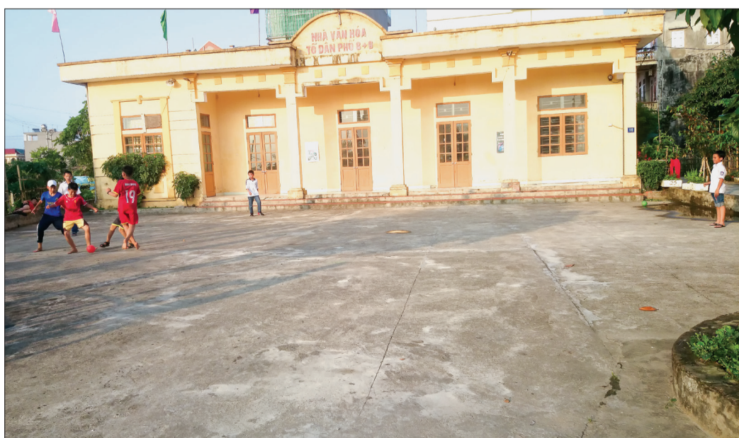
Sân nhà văn hóa tổ 8 + 9 cũ, nay là tổ 5 mới vẫn là nơi vui chơi chung của các cháu học sinh sau sáp nhập.