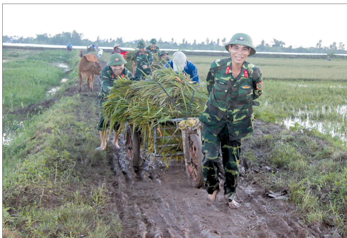
Cán bộ, chiến sĩ lực lượng vũ trang tỉnh thu hoạch lúa giúp dân.