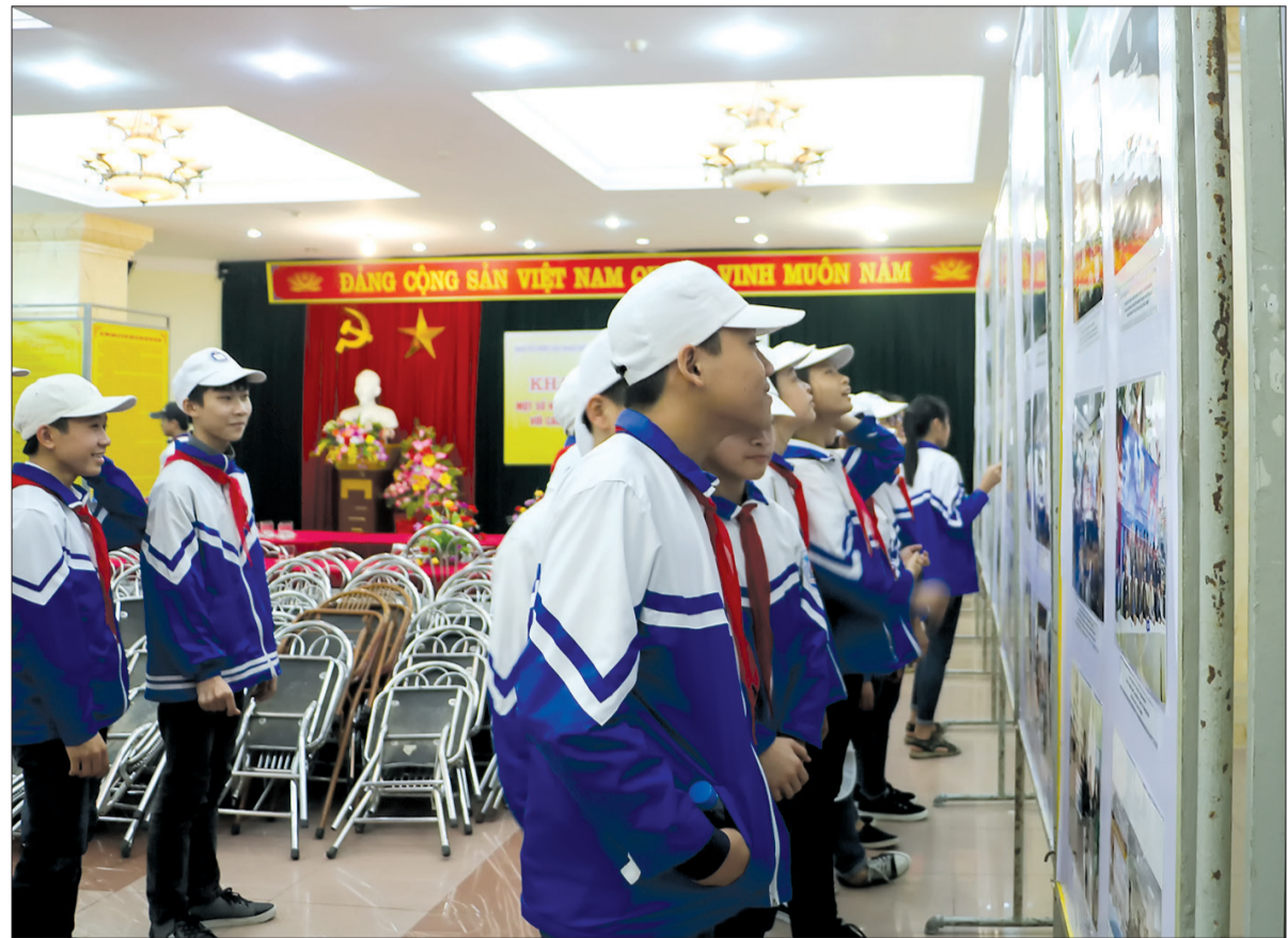
Học sinh Trường THCS Lê Hồng Phong (thành phố Thái Bình) tham quan triển lãm.

trào cách mạng vô sản, bên cạnh đó Bảo tàng tỉnh làm việc với Bảo tàng cách mạng Việt Nam, di tích nhà tù Hỏa Lò, bổ sung thêm được nhiều tư liệu về đồng chí Nguyễn Đức Cảnh. Sau khi nhận kế hoạch về công tác tổ chức các hoạt động kỷ niệm 110 năm ngày sinh đồng chí Nguyễn Đức Cảnh, bên cạnh nguồn tài liệu sẵn có, Bảo tàng tỉnh đã tích cực, khẩn trương bổ sung thêm nhiều tài liệu về đồng chí, lên phương án dàn dựng hợp lý trong không gian, đáp ứng yêu cầu của Ban tổ chức và khách tham quan. Ngoài những tư liệu về cuộc đời, quá trình hoạt động cách mạng của đồng chí Nguyễn Đức Cảnh, tham quan triển lãm, công chúng còn được theo dõi những hình ảnh về một số thành tựu kinh tế và hoạt động của giai cấp công nhân, Liên đoàn Lao động tỉnh, sự trí ân của các tổ chức, đoàn thể trung ương và địa phương đối với công lao to lớn của đồng chí Nguyễn Đức Cảnh. Trưng bày tuy diễn ra trong thời gian ngắn nhưng mang ý nghĩa to lớn, thể hiện sự biết ơn, niềm tự hào của Đảng bộ, nhân dân Thái Bình đối với những đóng góp to lớn của đồng chí Nguyễn Đức Cảnh, người con ưu tú của quê hương Thái Bình. Qua triển lãm, thế hệ trẻ cũng học hỏi được thêm nhiều điều từ tinh thần quyết tâm, lý tưởng sống đáng quý của đồng chí, có định hướng phấn đấu trong lao động và học tập.