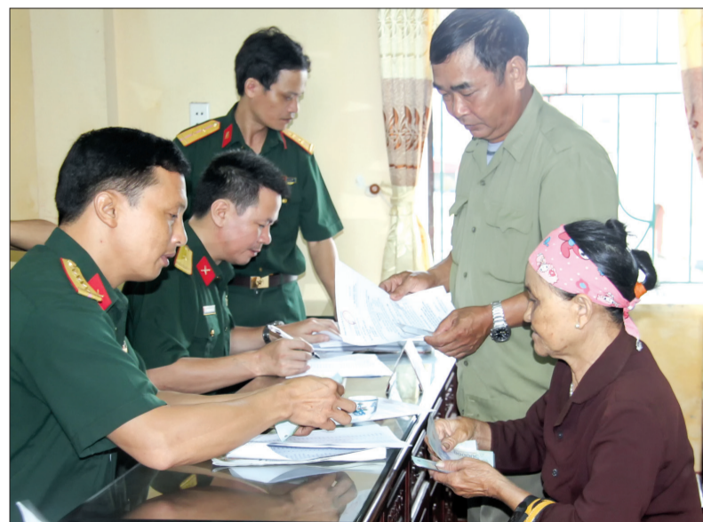
Cán bộ Ban CHQS huyện Đông Hưng chỉ trả trợ cấp cho các đối tượng chính sách.