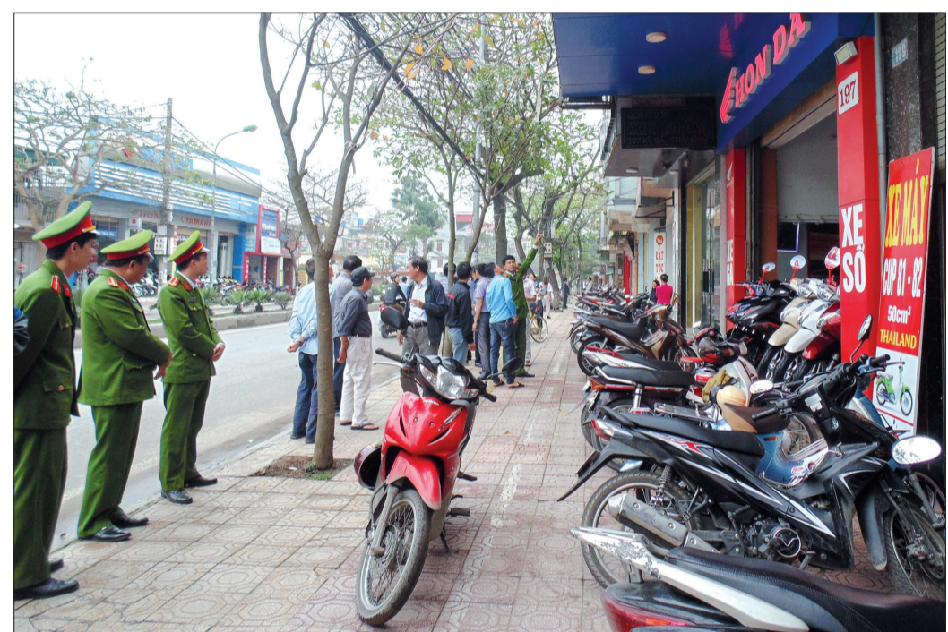
Các lực lượng chức năng ra quân tuyên truyền, nhắc nhở về trật tự đô thị.

Quan sát nhiều tuyến phố, vỉa hè của thành phố Thái Bình những ngày này, nhiều người không khỏi ngạc nhiên trước sự đổi khác về TTĐT. Các tuyến đường như Lê Lợi, Hai Bà Trưng, Lý Thường Kiệt, Minh Khai, Lê Quý Đôn... đã trở nên thông thoáng, xanh, sạch, đẹp.