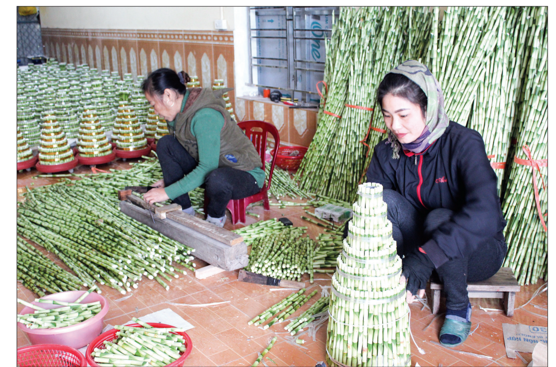
Người dân xã Minh Tân (Đông Hưng) sản xuất chậu, tháp phát lộc cung ứng ra thị trường.