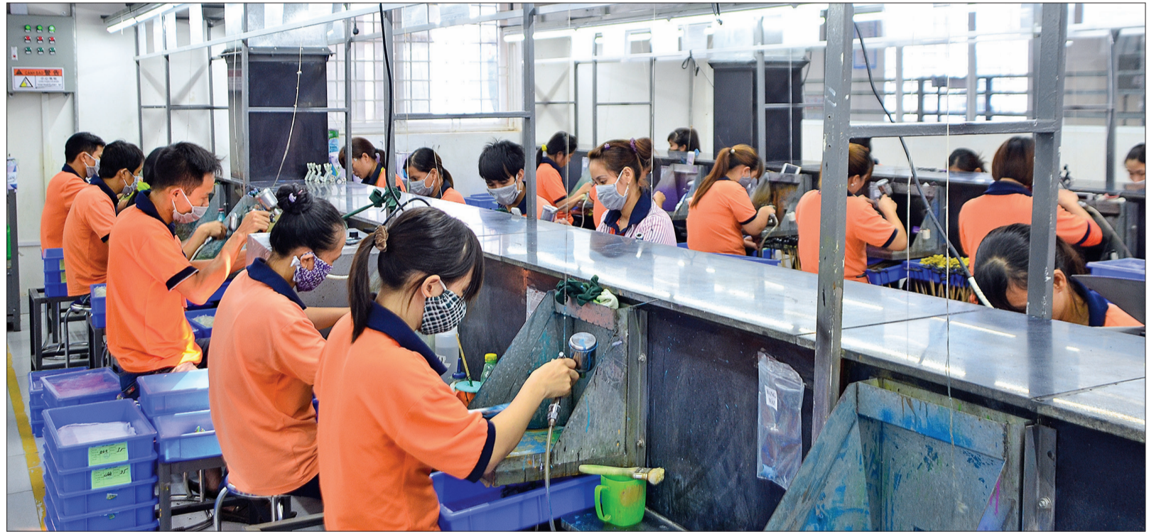
Nhiều doanh nghiệp tạo mọi điều kiện cho người lao động trong quá trình làm việc.