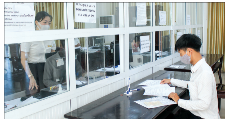
Thực hiện Nghị quyết số 68, trên địa bàn thành phố Thái Bình có 19 hộ kinh doanh được đề nghị UBND tỉnh phê duyệt hỗ trợ.

Trong ảnh: Hoạt động giao dịch tại bộ phận một cửa Chi cục Thuế khu vực thành phố Thái Bình - Vũ Thư.