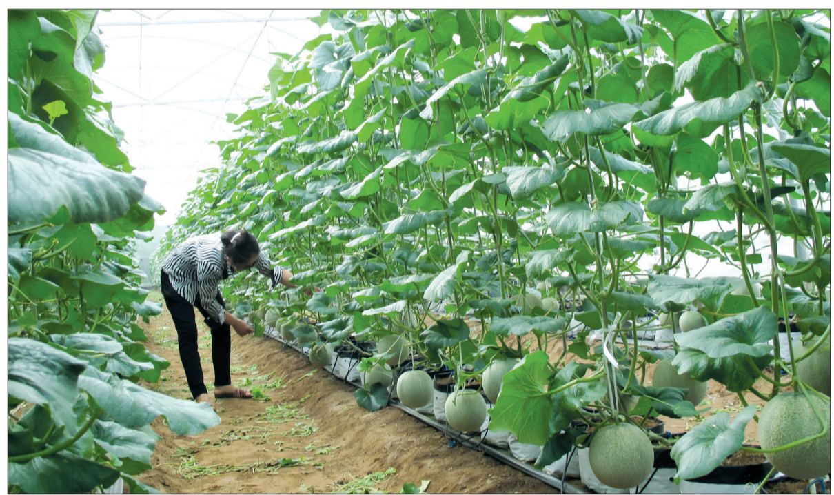
Chi phí đầu tư cho mỗi sào trồng dưa lưới khoảng 110 triệu đồng.

trồng trọt của huyện đạt trên 1.013 tỷ đồng, đạt gần 61% kế hoạch năm. Trong lĩnh vực chăn nuôi, huyện đã tập trung chỉ đạo mở rộng, phát triển chăn nuôi theo quy hoạch gắn với bảo vệ môi trường và phòng, chống dịch bệnh. Đến nay huyện đã quy hoạch 153 điểm chăn nuôi tập trung, diện tích 691,12ha và 7 điểm quy hoạch nuôi cá lồng trên 3 sông lớn là sông Hồng, sông Luộc và sông Trà Lý. Phương thức chăn nuôi được chuyển đổi theo quy mô gia trại, trang trại; ưu tiên phát triển trang trại chăn nuôi quy mô lớn có liên doanh, liên kết, bảo đảm vệ sinh môi trường. Chăn nuôi nông hộ từng bước tổ chức lại theo hướng chăn nuôi chuyên nghiệp có kiểm soát, bảo đảm chăn nuôi an toàn sinh học và bền vững. Toàn huyện hiện có 176 trang trại, 2.040 gia trại sản xuất hiệu quả. Tổng đàn đại gia súc trên 15.750 con trâu, bò, trong đó mới phát triển thêm được 1 trang trại bò với hơn 300 con ở xã Hồng An. Tổng đàn lợn đạt gần 105.000 con (cao nhất tỉnh). Tổng đàn gia cầm đạt trên 2,2 triệu con. Chăn nuôi phát triển đa dạng theo hướng chăn nuôi sạch ở các xã Duyên Hải, Diệp Nông, Hồng Minh, Tân Lễ, Tân Hòa, Minh Khai, Đông Đô. Nuôi trồng thủy sản ngày càng phát triển, các giống cá diều hống, rô phi đơn tính, cá chép giòn, cá lăng... được nuôi tập trung trên sông. Hiện toàn huyện có 188 lồng cá (tăng 28 lồng so với cuối năm 2020) tại các xã Hồng An, Diệp Nông, Độc Lập, Tân Lễ và thị trấn Hưng Nhân.