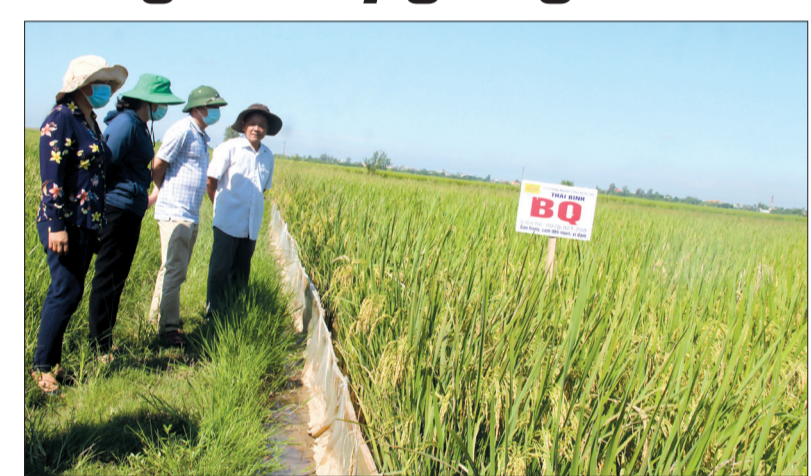
(Xem tiếp trang 4)

BQ, CNC11 là hai giống lúa thuần chất lượng được chuyển giao bản quyền tác giả cho Công ty Cổ phần Nông nghiệp công nghệ cao Thái Bình, được Bộ Nông nghiệp và Phát triển