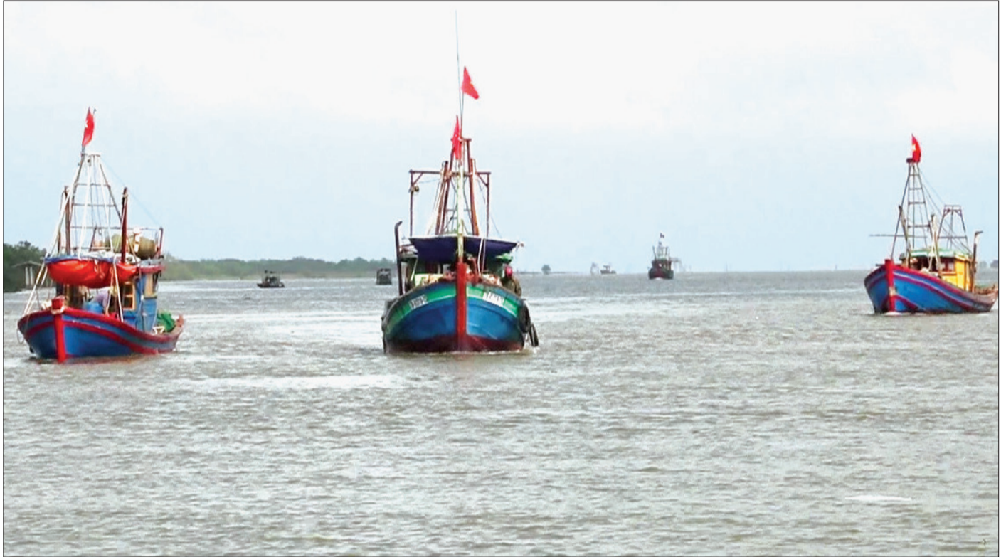
Tàu thuyền của ngư dân huyện Thái Thụy đánh bắt thủy hải sản.

Thái Bình có khoảng 52km bờ biển và 5 cửa sông lớn đổ ra biển tạo ra vùng bãi triều trên 16.000ha, qua đó tạo ra nhiều tiềm năng, thế mạnh để phát triển kinh tế biển. Phát huy những lợi thế này, những năm qua Thái Bình đã có nhiều chủ trương, giải pháp đẩy mạnh phát triển kinh tế biển gắn với bảo vệ vững chắc chủ quyền quốc gia và nâng cao đời sống nhân dân vùng ven biển.