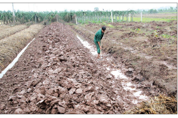
Nông dân huyện Hưng Hà tích cực lao động, sản xuất nâng cao giá trị sản xuất.