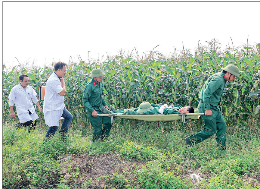
Một tình huống trong diễn tập khu vực phòng thủ huyện Vũ Thư.

đồng chặt chẽ trong quá trình tác chiến. Hành động tương tự được tạo giả phù hợp và sát với diễn biến tình huống. Riêng về nội dung thực binh "Tiểu đoàn dự bị động viên huyện phối hợp trung đội dân quân cơ động huyện tiến công địch đổ bộ đường không", cán bộ, chiến sĩ tham gia đã nêu cao ý thức trách nhiệm, chấp hành nghiêm kỷ luật, tác phong khẩn trương; hành động kỹ thuật cá nhân và chiến thuật phân đội trong đội hình chiến đấu khá thống nhất, phối hợp nhịp nhàng, đồng bộ. Hành động của các lực lượng thể hiện ý thức trách nhiệm, quyết tâm cao đối với nhiệm vụ diễn tập.