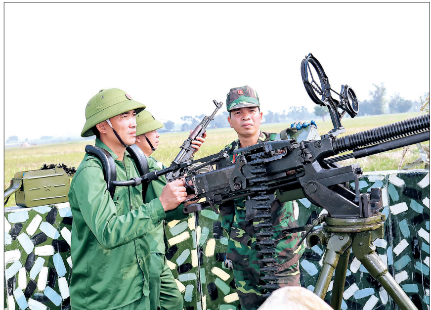
Thực binh đánh địch tiến công hỏa lực đường không.

Phần diễn tập thực binh có 2 nội dung chính là thực hành đánh chiếm lại mục tiêu giải thoát con tin theo tình huống A2 và đánh địch tiến công hỏa lực đường không vào địa bàn. Quá trình thực binh đã thực hiện đúng nguyên tắc chiến thuật, thể hiện được các hình thức, phương pháp hoạt động tác chiến của lực lượng công an, quân sự địa phương. Ngoài ra, công tác chỉ huy của các đơn vị tham gia được thực hiện linh hoạt, hiệp