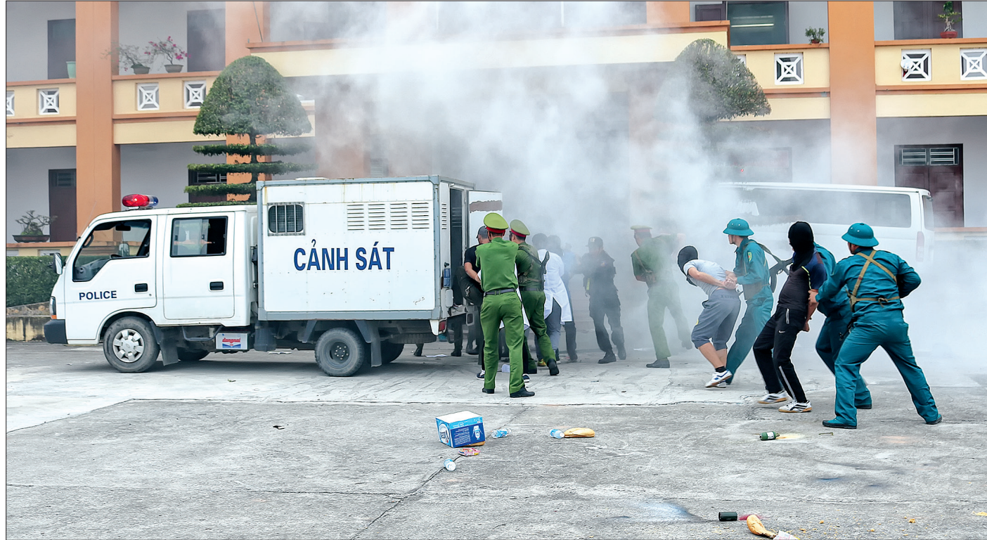
Nội dung xử trí tình huống A2 trong diễn tập khu vực phòng thủ huyện Vũ Thư.

Diễn tập khu vực phòng thủ huyện Vũ Thư năm 2018 diễn ra trong hai ngày 27 - 28/11 đã thành công. Qua diễn tập, cấp ủy, chính quyền và lực lượng vũ trang địa phương rút ra được nhiều kinh nghiệm cả về lý luận và thực tiễn trong thực hiện nhiệm vụ quốc phòng, an ninh nói chung, trong tổ chức, xây dựng và hoạt động của khu vực phòng thủ huyện nói riêng