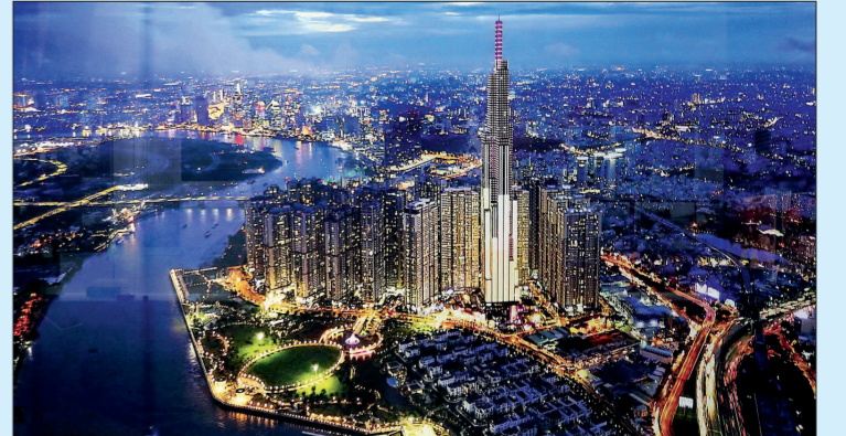
Thành phố Hồ Chí Minh - đầu tàu kinh tế đất nước.

Từ một nước liên tục phải nhập khẩu lương thực để cứu đói, chỉ sau 3 năm đổi mới, Việt Nam đã xuất khẩu 1,4 triệu tấn gạo và hiện là một trong ba nước có lượng gạo xuất khẩu lớn nhất thế giới.