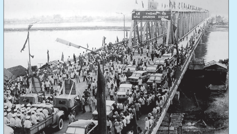
Lễ thông xe cầu Chương Dương - cây cầu tự lực tự cường.

Nhận định thời cơ đã chín muồi, Đảng tổ chức họp hội nghị mở rộng bàn kế hoạch giải phóng hoàn toàn miền Nam, thống nhất đất nước tại Hà Nội, tháng 12/1974.