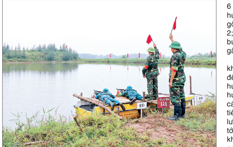
Chiến sĩ dân quân biển huyện Thái Thụy thực hành nội dung bắn súng CKC bài 2.

Sáng ngày 21/8, Ban CHQS huyện Thái Thụy khai mạc hội thao dân quân biển năm 2019.