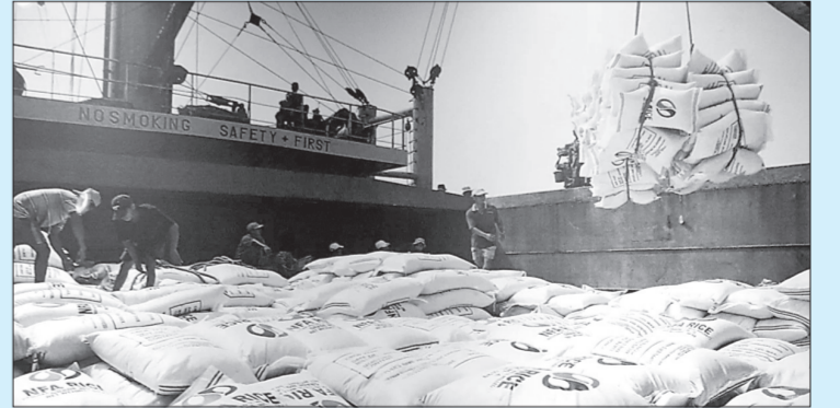
Bốc xếp gạo xuất khẩu ở cảng Sài Gòn.

Khởi công ngày 10/10/1983, thông xe ngày 30/9/1985, cầu Chương Dương bắc qua sông Hồng trở thành cây cầu đầu tiên do người Việt Nam tự thiết kế, thi công, khai thông tuyến đường huyết mạch giữa Thủ đô Hà Nội và các tỉnh phía Bắc, góp phần phát triển kinh tế - xã hội.