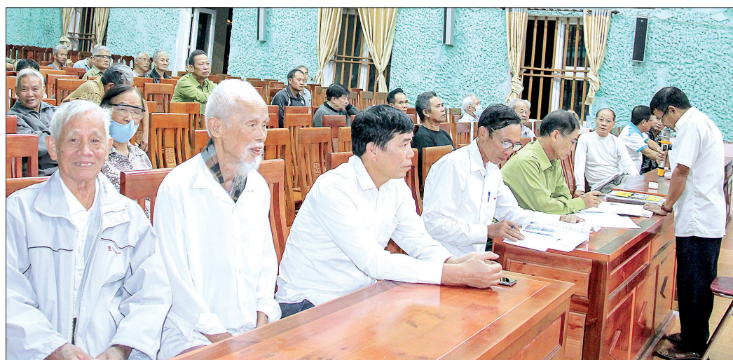
Sinh hoạt Chi bộ thôn Trung, xã Đông Sơn (Đông Hưng).

G iữ trọn niềm tin với Đảng là phương châm sống của bao thế hệ đảng viên. Dù tuổi đời và tuổi đảng, công việc khác nhau song họ vẫn luôn đặt niềm tin son sắt, vững bền vào sự soi đường, lãnh đạo của Đảng ta trong suốt chặng đường sống, chiến đấu, lao động, xây dựng quê hương, đất nước.