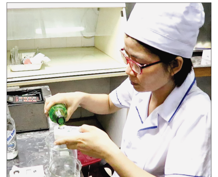
Các sản phẩm trước khi đưa ra thị trường đều được kiểm tra, đánh giá chất lượng chặt chẽ.