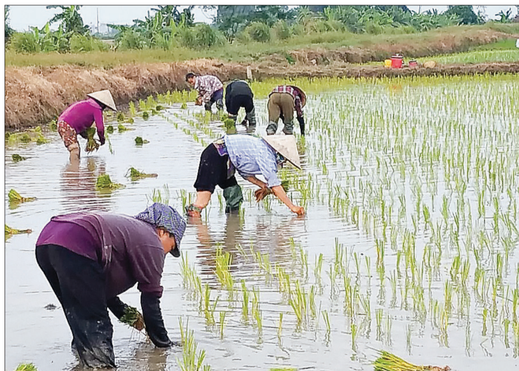
Cán bộ, hội viên, phụ nữ xã Đông Xá (Đông Hưng) tham gia cấy lúa gây quỹ hội.