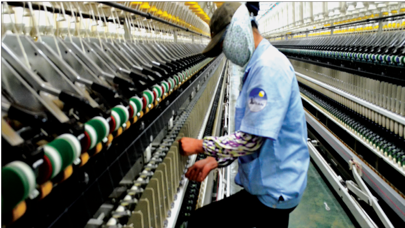
Thu thuế từ khu vực công nghiệp tiếp tục tăng. Trọng ảnh: Dây chuyền sản xuất của Công ty Cổ phần Damsan.

6 tháng đầu năm 2019, thành phố Thái Bình tiếp tục ghi dấu ấn trong công tác thu ngân sách nhà nước (NSNN) với số thu trên 256,6 tỷ đồng, đạt 64% dự toán năm, tăng 36% so với cùng kỳ. Đó là kết quả của sự tập trung lãnh đạo, chỉ đạo, điều hành của Thành ủy, HĐND, UBND thành phố, sự nỗ lực phấn đấu ngay từ đầu năm của các ngành, nhất là cán bộ, công chức ngành Thuế, UBND các xã, phường và cộng đồng doanh nghiệp, các tổ chức, cá nhân trong thực hiện nghĩa vụ thuế.