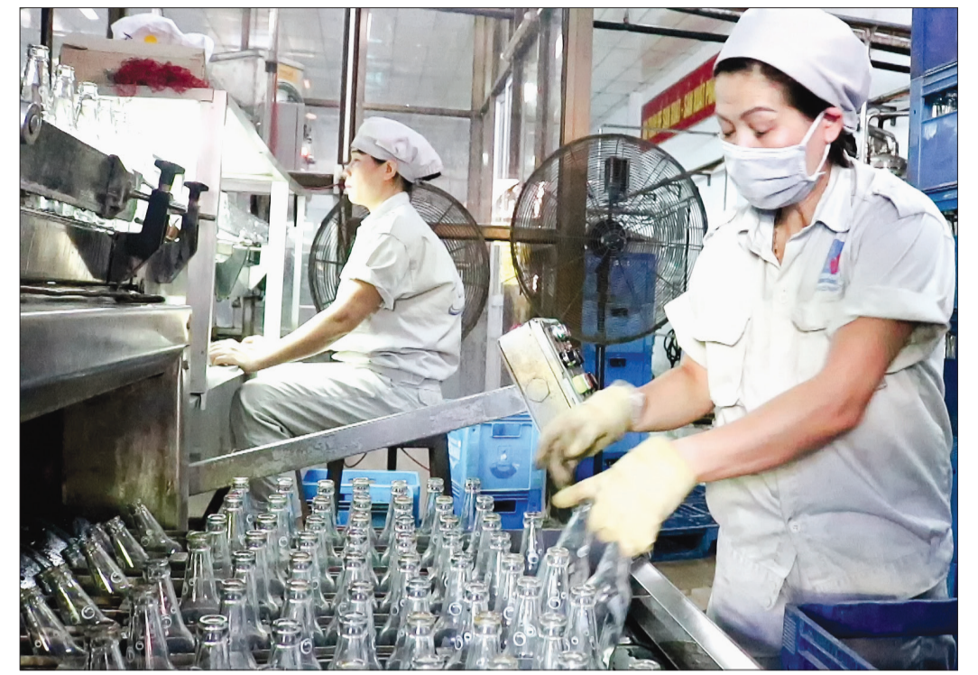
Công nhân Công ty Cổ phần Dịch vụ đầu khí Thái Bình đưa chai thủy tinh vào hệ thống súc rửa, chiết rót.

tiện lợi, thân thiện với người dùng hơn.