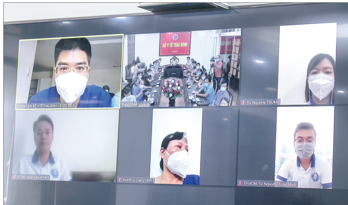
Các thành viên đoàn cán bộ y tế, sinh viên y tế Thái Bình chỉ viện cho Thành phố Hồ Chí Minh chống dịch Covid-19 tại buổi gặp mặt trực tuyến.