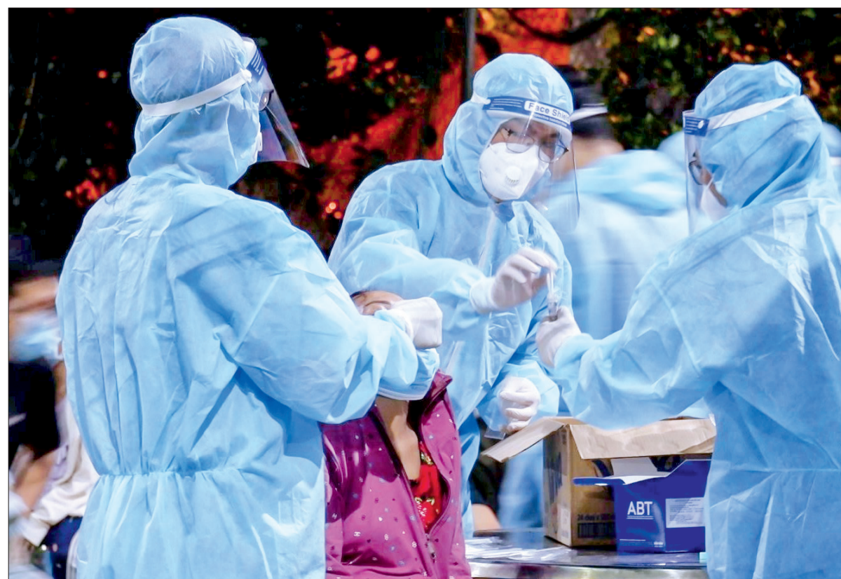
Lấy mẫu xét nghiệm SARS-CoV-2 tại Thành phố Hồ Chí Minh.