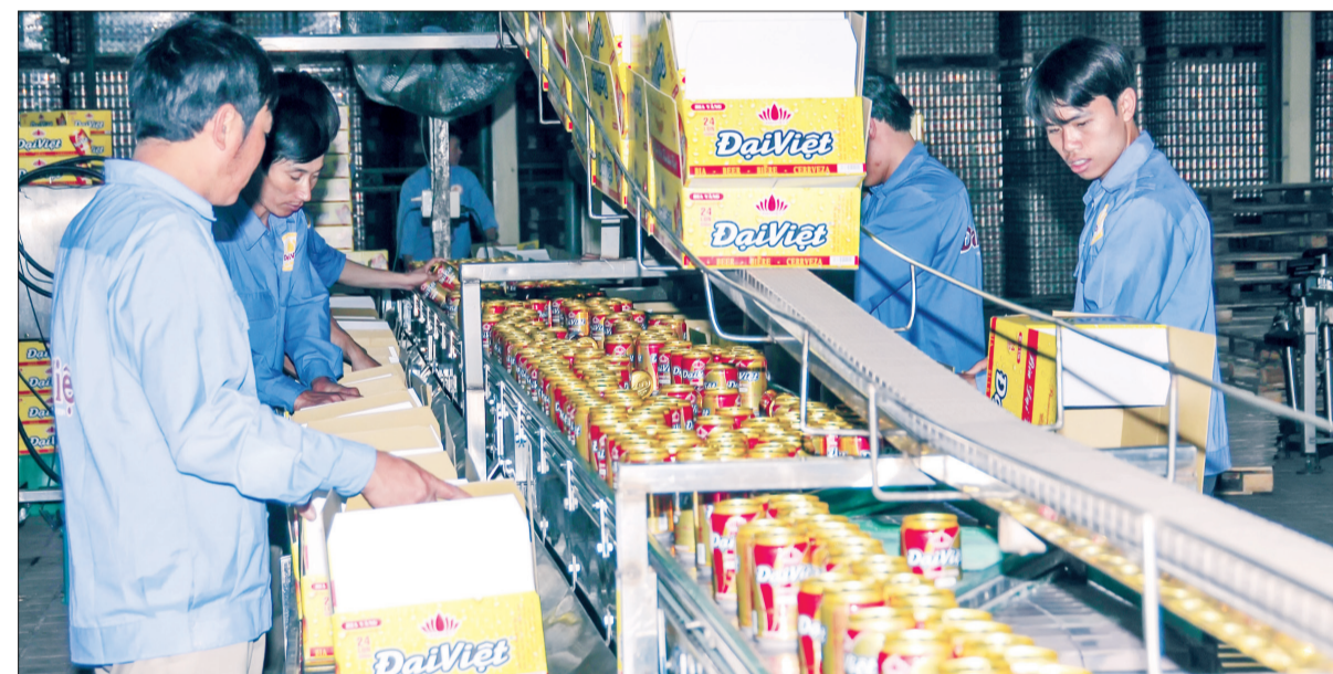
Sản xuất tại Công ty Cổ phần Tập đoàn Hương Sen.

Tại lễ ra quân, trưởng các phòng, đơn vị, bộ phận sản xuất và các tổ chức đoàn thể đã ký giao ước thi đua năm 2018 với quyết tâm đưa Công ty Cổ phần Tập đoàn Hương Sen ngày càng phát triển vững mạnh.