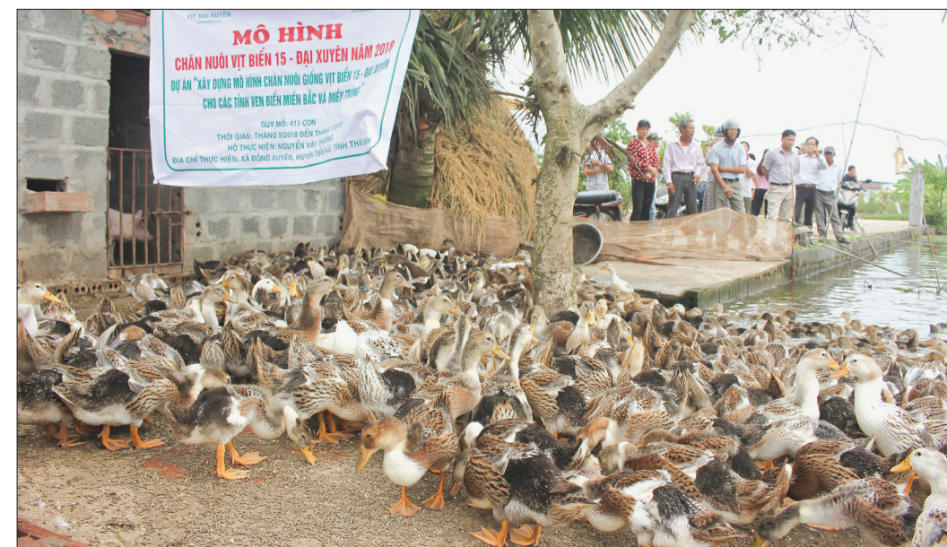
Giống vịt biển 15 - Đại Xuyên thích nghi rất tốt với tập quán chăn nuôi của nông dân địa phương.