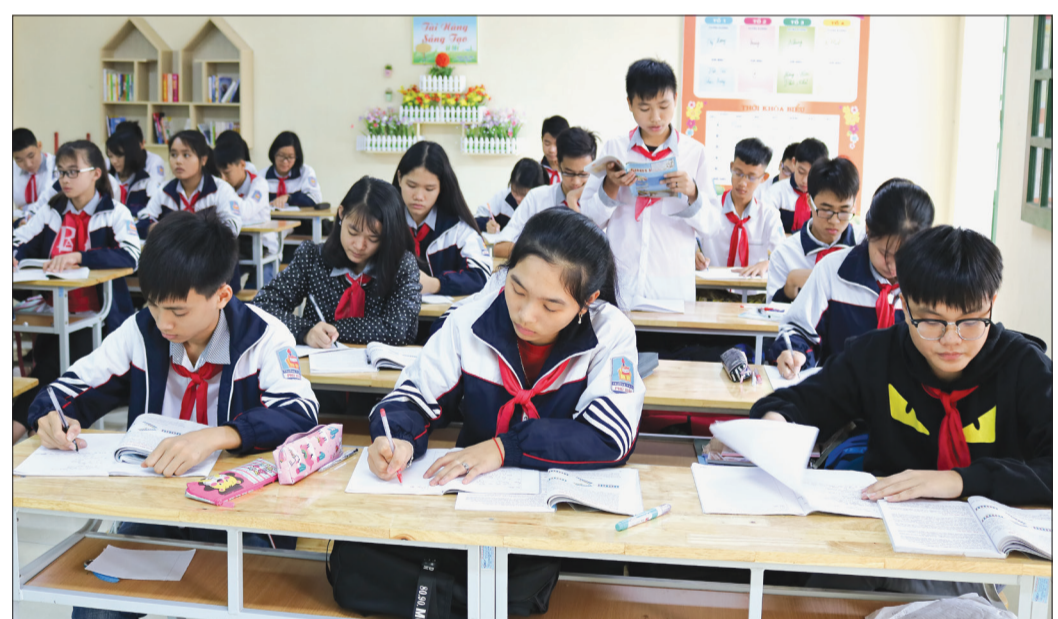
Học sinh Trường THCS Phú Xuân trong giờ học.

Năm học 2017 - 2018, Trường THCS Phú Xuân được đầu tư xây dựng mới một dãy phòng học 3 tầng. Cơ sở vật chất được đầu tư khang trang đáp ứng nhu cầu dạy, học của giáo viên và học sinh. Các phòng học, phòng bộ môn được bố trí bằng, bàn ghế đúng quy cách, bảo đảm thoáng mát, an toàn, đủ ánh sáng. Đặc biệt, các phòng học được lắp đặt hệ thống máy chiếu cố định phục vụ việc giảng dạy bằng giáo án điện tử. Cùng với làm tốt công tác chuẩn bị cơ sở vật chất, trang thiết bị dạy và học, Ban Giám hiệu nhà trường chủ động xây dựng kế hoạch năm học, phân công giáo viên đứng lớp phù hợp với năng lực chuyên môn, đặc biệt giao chỉ tiêu phần đầu cho từng khối lớp. Trong công tác giáo dục, nhà trường xác định giáo dục đạo đức là nền tảng của công tác dạy và học. Do đó, cùng với phát động mạnh mẽ phong trào thi đua thực