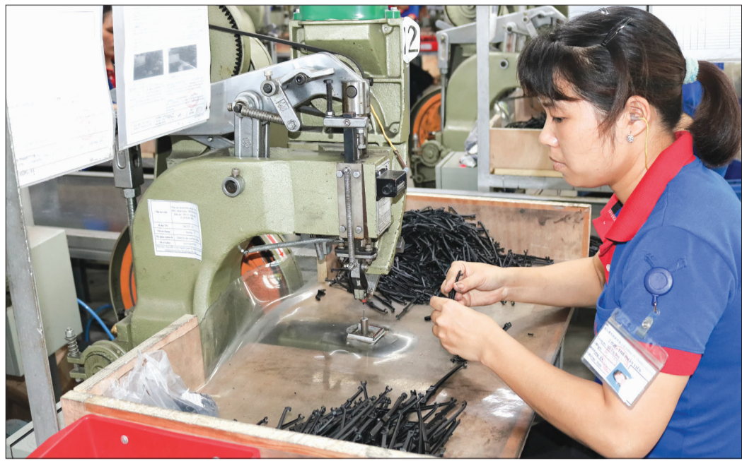
Công ty TNHH ULi chuyên sản xuất và xuất khẩu cần gạt nước ô tô (khu công nghiệp Sông Trà) đang mở rộng quy mô sản xuất.

Cùng với nâng cao ý thức, trách nhiệm của cán bộ, công chức, người lao động, đẩy mạnh cải cách thủ tục hành chính, thời gian qua, Sở Công Thương tập trung huy động và sử dụng có hiệu quả các nguồn lực đầu tư, xây dựng, cải tạo, nâng cấp kết cấu hạ tầng kinh tế góp phần cải thiện môi trường đầu tư, kinh doanh của tỉnh. Hiện nay, trên địa bàn tỉnh có 6 khu công nghiệp (KCN) và 33 cụm công nghiệp (CCN) đã được quy hoạch chi tiết, với tổng diện tích 2.822,6ha. Để thu hút doanh nghiệp đầu tư vào các KCN, CCN, từ năm