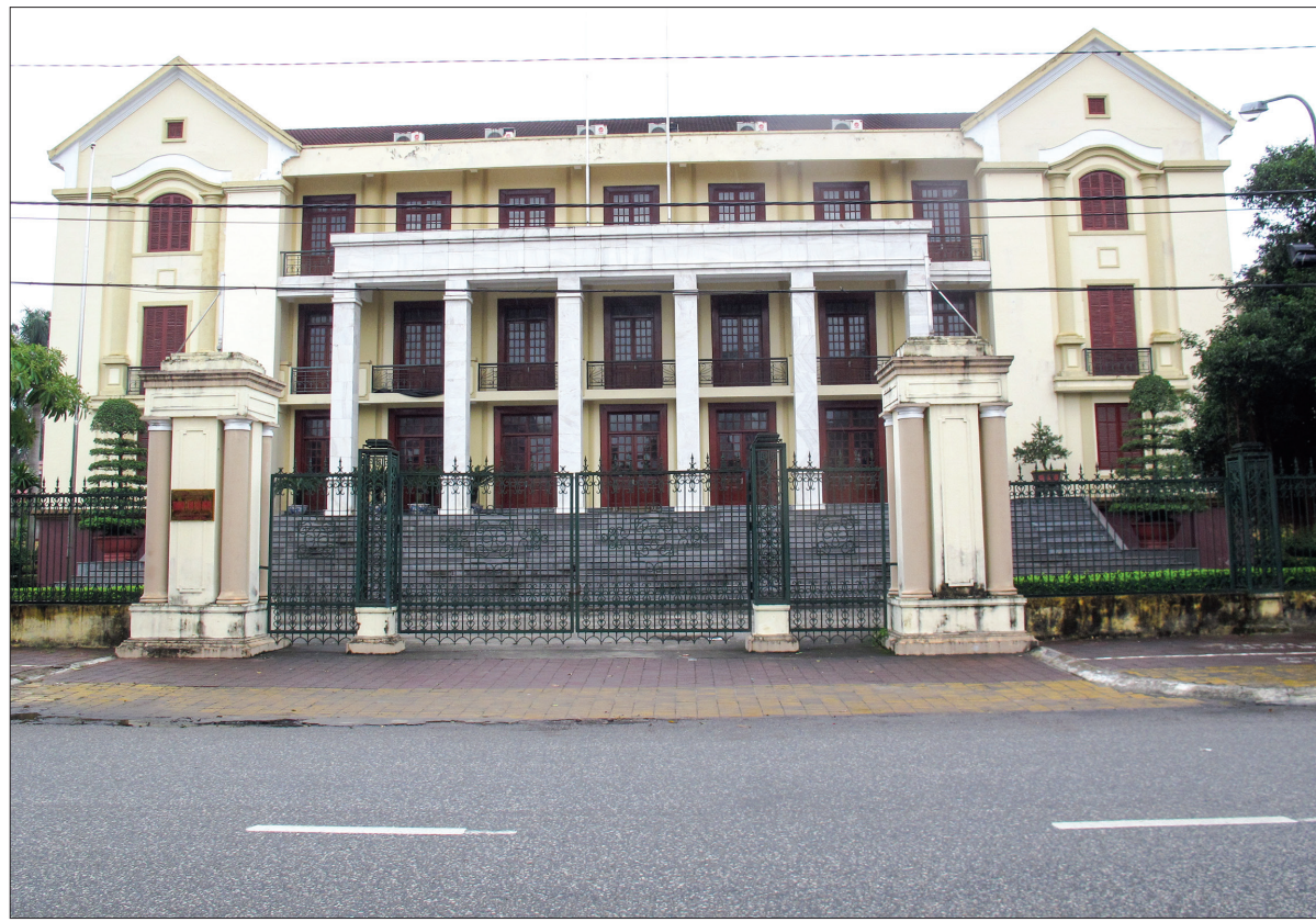
Trung tâm hội nghị tỉnh hiện nay sẽ được bàn giao cho thành phố sử dụng.

Những ngày gần đây, trên một số báo mạng điện tử đã đăng tải nội dung phản ánh thiếu khách quan, không đúng với tình hình thực tế tại Thái Bình về việc thực hiện dự án đầu tư xây dựng công trình Trung tâm hội nghị tỉnh Thái Bình theo hình thức hợp đồng xây dựng - chuyển giao (BT). Phóng viên Báo Thái Bình đã thu thập, xác minh tài liệu liên quan để cung cấp thông tin cụ thể, chính xác về quá trình triển khai dự án nêu trên tới bạn đọc.