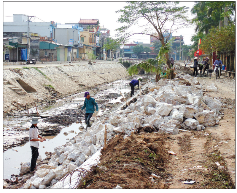
Triển khai làm kê hai bên bờ sông thuộc dự án đường ĐH07.

Thực tế cho thấy công tác bồi thường GPMB khi nhà nước tiến hành thu hồi đất luôn là vấn đề phức tạp, liên quan trực tiếp đến quyền lợi của mỗi người dân. Xác định được điều đó, Vũ Thư đã yêu cầu các phòng, ban, đoàn thể và chính quyền địa phương coi công tác GPMB là nhiệm vụ chính trị quan trọng. Theo đó, huyện vận động cả hệ thống chính trị tham gia vào công tác GPMB; tăng cường tuyên truyền các chủ trương, chính sách của Đảng và Nhà nước về công tác bồi thường, hỗ trợ, tái định cư cho cán bộ, nhân dân trong vùng bị ảnh hưởng bởi dự án để người dân tự giác chấp hành cũng như tham gia giám sát. Phát huy quy chế dân chủ, thực hiện tốt công tác dân vận với phương châm "Dân biết, dân bàn, dân làm, dân kiểm tra" ngay từ giai đoạn công bố quy hoạch, triển khai dự án. Tại mỗi dự án, huyện đều tổ chức thông báo công khai quy hoạch chi tiết dự án trên hệ thống loa phát thanh, tại trụ sở UBND xã, thị trấn, nhà văn hóa thôn, tổ nơi có dự án đi qua. UBND xã thành lập