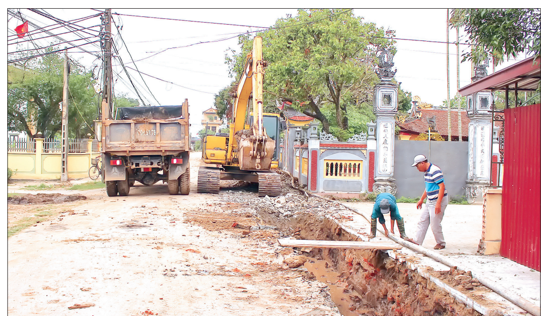
Thi công tuyến đường ĐH.93B trên địa bàn xã Thuận Thành.