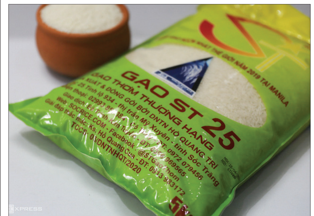
Gạo ST 25 của Việt Nam được nhiều quốc gia ưa chuộng.

(vnexpress.net) Giá tăng liên tục trong 4 tháng đầu năm và cao nhất thế giới nhưng hàng Việt vẫn rất hút khách. Báo cáo mới nhất của Bộ Nông nghiệp và Phát triển nông thôn cho thấy, 4 tháng đầu năm xuất khẩu gạo đạt gần 3 triệu tấn, tương đương 1,56 tỷ USD, tăng 43,6% về khối lượng và 54,5% về giá trị so với cùng kỳ năm 2022. Đặc biệt, giá gạo xuất khẩu bình quân 4 tháng đầu năm ước đạt 526 USD một tấn, tăng 7,6% so với cùng kỳ năm 2022. Mức giá này, giúp gạo Việt vượt Thái Lan vươn lên vị trí dẫn đầu thế giới. Đây cũng là mức giá cao nhất trong 2 năm qua.