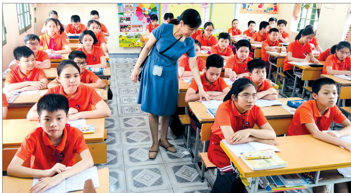
Giờ học của cô và trò Trường Tiểu học Lê Hồng Phong.

Nhiều năm qua, ngành Giáo dục và Đào tạo thành phố Thái Bình luôn ở vị trí tốp đầu tỉnh về phong trào dạy và học. Đặc biệt, trong 2 năm học vừa qua, ngành dẫn đầu toàn diện phong trào giáo dục toàn tỉnh.