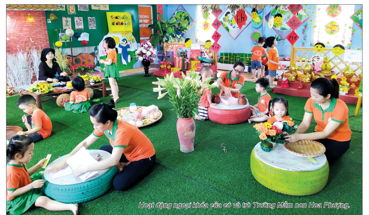
Hoạt động ngoại khóa của cô và trò Trường Mầm non Hoa Phượng.

bồi dưỡng đội ngũ giáo viên giỏi với nhiều hình thức, phương pháp sáng tạo, phù hợp với từng đối tượng và đặc trưng bộ môn. Đến nay, 100% giáo viên đạt trình độ chuẩn, 94,3% trên chuẩn, tăng 4,2% so với nhiệm kỳ trước; giáo viên dạy giỏi các cấp đạt 40,1%, tăng 4,9% so với nhiệm kỳ trước. Với truyền thống đoàn kết, tinh thần trách nhiệm cao của đội ngũ cán bộ, giáo viên cùng sự quan tâm lãnh đạo, chỉ đạo sâu sát của các cấp ủy đảng, chính quyền, tin rằng ngành Giáo dục và Đào tạo thành phố tiếp tục đạt được những thành tích to lớn, góp phần xây dựng thành phố Thái Bình sớm trở thành đô thị loại I trực thuộc tỉnh. THANH HÀ