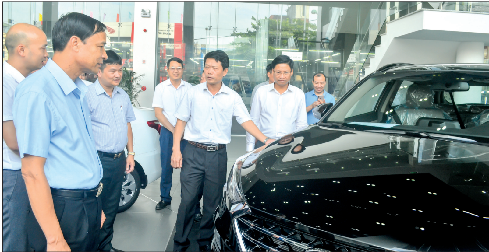
Các đồng chí lãnh đạo thành phố Thái Bình thăm Công ty Cổ phần Ô tô Hưng Thịnh Phát.

Những thành tựu 5 năm qua của thành phố Thái Bình không chỉ đánh dấu bước phát triển mới trên con đường xây dựng thành phố văn minh, hiện đại mà còn là bài học thực tiễn quý báu để từng bước nâng cao năng lực lãnh đạo, chỉ đạo thực hiện mục tiêu phát triển thành phố trong giai đoạn mới, tạo cơ sở, tiền đề cho thành phố Thái Bình tiếp tục đổi mới toàn diện, sớm trở thành đô thị loại I trực thuộc tỉnh. Trước thềm Đại hội Đảng bộ thành phố lần thứ XXVIII, nhiệm kỳ 2020 - 2025, phóng viên Báo Thái Bình đã phỏng vấn đồng chí Đinh Gia Dũng, Phó Bí thư Thành ủy, Chủ tịch UBND thành phố Thái Bình để làm rõ hơn về những thành tựu thành phố Thái Bình đã đạt được.