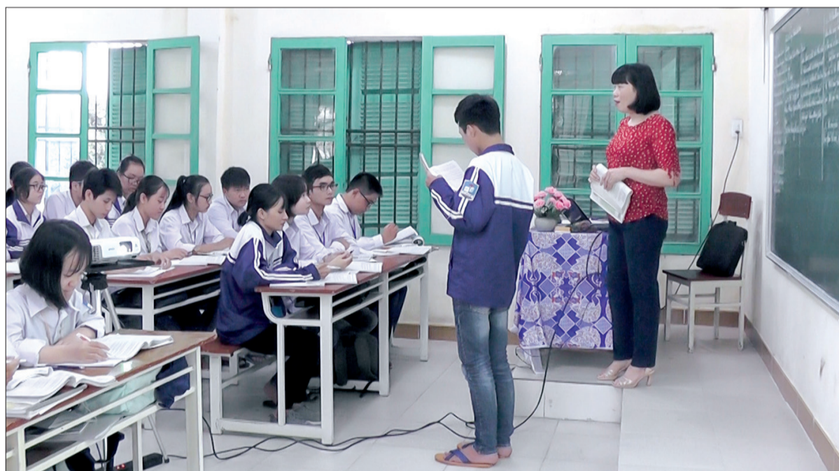
Giờ học của cô và trò Trường THPT Quỳnh Côi.