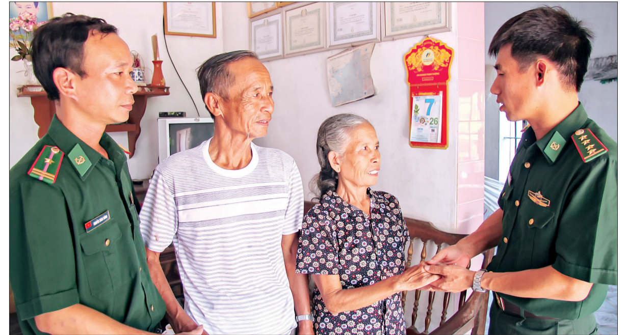
Vợ chồng ông Biên luôn coi cán bộ, chiến sĩ Bộ đội Biên phòng tỉnh như người thân.

60 năm qua kể từ ngày thành lập lực lượng công an vũ trang nhân dân (nay là Bộ đội Biên phòng) tỉnh Thái Bình, những người chiến sĩ "quân hàm xanh" vẫn luôn nhận được sự yêu thương, đùm bọc và chở che của nhân dân nơi biên giới biển của tỉnh. Ở nhà dân, cùng ăn, cùng làm với nhân dân và được nhân dân coi như người thân trong nhà là những kỷ niệm không bao giờ quên với các thế hệ cán bộ, chiến sĩ Bộ đội Biên phòng (BĐBP) tỉnh.